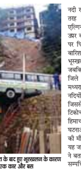
दिल्ली में भारी बरसात के बाद हुए भूस्तराल के कारण बाढ़ से लगी गिरी एक कार और बस

है। दक्षिण भारत के केरल में बाढ़ को वजह से मले वालों की संख्या बढ़कर 121 हो गई है। मलयालम के कलायुग और वायनाड के पुष्पुयना में शवों का पता लगाने के लिए ग्राउंड पेरिपेट्रिया टिम (जीपीआर) का इस्तेमाल किया जा रहा है जहां बाढ़ भयंकर प्रकृतियों ने दो लोगों का नामो-निशान मिटा दिया था। दिल्ली में भी रिवरवा को बारिश हुई और राधा अहिलदा तामपान 29.7 डिग्री सेल्सियस जबकि न्यूनतम तापमान 24.8 डिग्री सेल्सियस रहने लगा गया। अधिकांशों ने बताया कि यमुना में जलस्तर बढ़ने से दिल्ली सरकार ने बाढ़ की चेतावनी जारी की है। नचिचे इलाकों में रहने वाले लोगों को सुरक्षित जगह पर जाने की सलाह दी है क्योंकि यमुना में जलस्तर के खतरों के निशान को घर पर करने की आशंका है। केंद्रीय जल आयोग ने बताया कि उत्तर प्रदेश में गंगा, यमुना और घाघरा समेत कई नदियां उन्नत पर हैं। बदला, गद्युकोश, नरीय और फुंखाबाद में गंगा