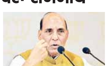
रक्षा मंत्री राजनाथ सिंह ने कहा कि पाकिस्तान के साथ बातचीत वह तक संभव नहीं है जब तक वह आतंकवाद को सहयोग देना और उसको बढ़ावा देना बंद नहीं करता है।

रक्षा मंत्री राजनाथ सिंह ने कहा कि पाकिस्तान के साथ बातचीत वह तक संभव नहीं है जब तक वह आतंकवाद को सहयोग देना और उसको बढ़ावा देना बंद नहीं करता है। सिंह ने रविवार को कहा कि अगर पाकिस्तान से बातचीत होगी तो केवल पाकिस्तान के कब्जे वाले कश्मीर (पीओके) पर होगी। हरियाणा में अक्टूबर में होने वाले विधानसभा चुनाव से पूर्व भाजपा की जन आरंभोदर रैली को हरी झंडी दिखाने से पहले सिंह यहां एक सभा को संबोधित कर रहे थे।