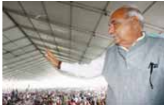
रोहनक में आयोजित रैली में नरेंद्र सिंह हुड्डा

विधानसभा चुनाव से पहले हरियाणा में कांग्रेस नई मुसौलत में सियाली है। कांग्रेस छोड़ने और अपनी नई पार्टी बनाने की खबरों के बीच हरियाणा के पूर्व मुख्यमंत्री और कद्दावर नेता भूपेंद्र सिंह हुड्डा ने जम्मू-कश्मीर से अनुच्छेद 370 हटाने का समर्थन करते हैं। हुड्डा ने रविवार को रोहनक में आयोजित रैली में न सिर्फ कि प्रदर्शन किया बल्कि बग़ीचे में भी हस्ताक्षर किए। उन्होंने कहा कि कांग्रेस रास्ते से भटक गई है। यह वह नरेंद्र मोदी की सरकार है।