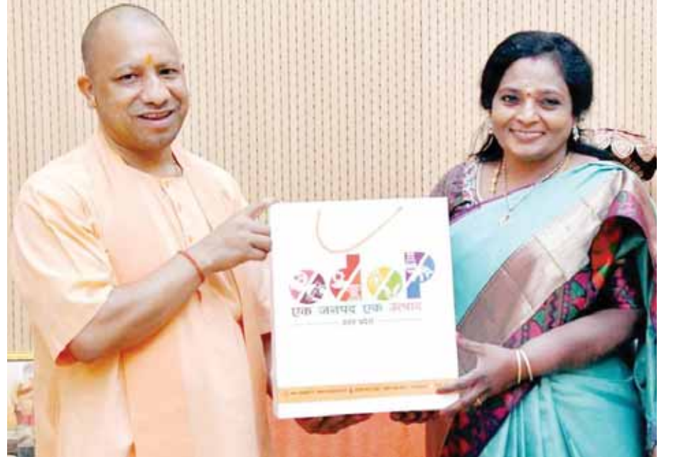
मुख्यमंत्री योगी आदित्यनाथ से उनके सरकारी आवास पर तेलंगाना की राज्यपाल तमिलिसाई सुंदरराजन की शिष्टाचार मुलाकत

विभाग की विभिन्न सेवाएं सहज रूप से उपलब्ध हैं। किसी को अपनी निजी भूमि से मिट्टी निकालनी होए खरीदी गई मिट्टी का परिवहन करना होए खनिज कार्यों के लिए लीज, परमिट, रजिस्ट्रेशन आदि को इस प्लेटफार्म से जोड़ा जाना लोगों को काफी सहुलियत देने वाला सिद्ध हो रहा है। बालू- मौरंग के खनन पट्टों में ऑनलाइन अधिम मासिक किश्त के स्थान पर 'पे एज यू गो' व्यवस्था लागू करते हुए महीने के अंत तक पूरी किश्त जमा करने का समय दिया जाना चाहिए। इससे पट्टाधारकों को सहुलियत होगी। खनन कार्यों के संबंध में अंतरराज्यीय परिवहन के लिए विनियमन शुल्क के दर में वृद्धि पर विचार किया जाना चाहिए।