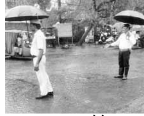
जल भराव का फाइनल फोटो।