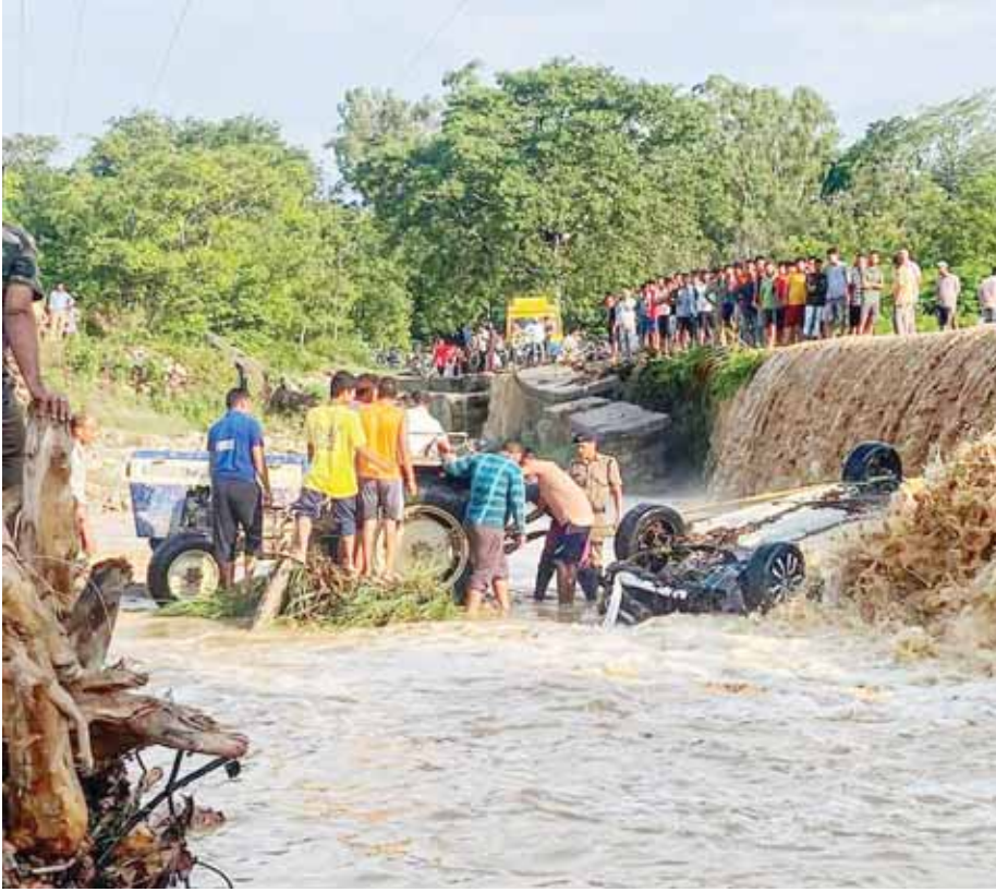
नैनीताल में रामनगर जिले में एक कार के डेला नदी में गिरने से स्थानीय नागरिक बचाव करते हुए।

वह 2019 के विधानसभा चुनाव परिणामों के बाद बारी-बारी से मुख्यमंत्री बनने के मुद्दे पर शिवसेना और भारतीय जनता पार्टी (भाजपा) के अलग होने का जिद्ध कर रहे थे। ठाकरे ने कहा, मुझे न्यायपालिका पर भरोसा है। उच्चतम न्यायालय का आदेश (बागी विधायकों को अयोग्य ठहराने के अनुरोध वाली याचिका पर) केवल शिवसेना तक ही सीमित नहीं होगा, बल्कि यह दिशा दिखाएगा कि लोकतंत्र किस तरफ जा रहा है। देश देख रहा है कि उच्चतम न्यायालय क्या फैसला देता है, क्योंकि यह देश में लोकतंत्र के भविष्य को भी रास्ता दिखाएगा और क्या लोकतंत्र के चारों स्तंभ अभी अपने कर्तव्यों का निर्वहन कर रहे हैं या नहीं। ठाकरे ने यह भी कहा कि वह पार्टी सांसदों से बातचीत करने के बाद यह तय करेंगे कि राष्ट्रपति चुनाव में किस उम्मीदवार को समर्थन देना है।