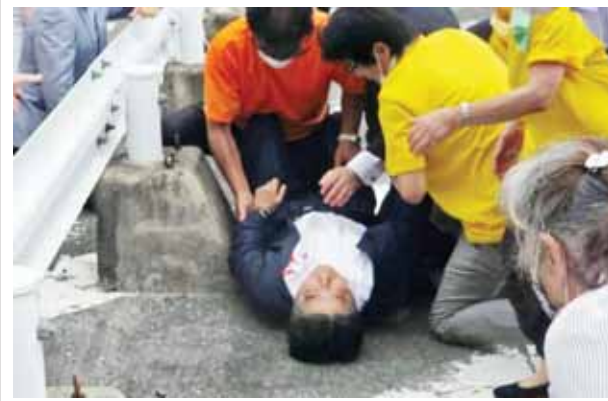
नारा (जापान)

जापान के सबसे शक्तिशाली और प्रभावशाली नेताओं में शुमार पूर्व प्रधानमंत्री शिंजो आबे की शुक्रवार को एक चुनावी सभा के दौरान भाषण देते समय गोली मारकर हत्या कर दी गई। दुनिया के सबसे सुरक्षित देशों में से एक माने जाने वाले जापान में इस घटना ने लोगों को स्तब्ध कर दिया है, जहां बंदूक नियंत्रण संबंधी कड़े कानून हैं। अधिकारियों ने बताया कि आबे (67) को देश के पश्चिमी हिस्से के नारा में भाषण शुरू करने के कुछ मिनटों बाद हमलावर ने पीछे से गोली मार दी।