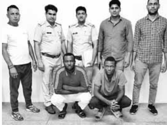
ठगी के आरोप में गिरफ्तार विदेशी नागरिकों के साथ साइबर थाना बल्लभगढ़ की पुलिस।