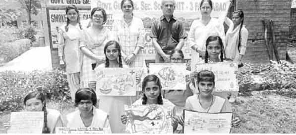
जल शक्ति अभियान-2 के तहत आयोजित प्रतियोगिता में पेंटिंग कर जागरूक करती एनएचसीन के सरकारी स्कूल की छात्राएं।