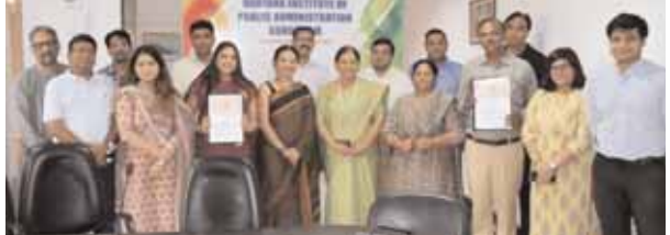
गुरुग्राम स्थित हिपा में गरीब परिवारों की लड़कियों को स्किल की ट्रेनिंग देने को फुटप्रिंट्स चाइल्ड केयर प्राइवेट लिमिटेड के साथ करार के दौरान मौजूद दोनों संस्थानों के अधिकारी व अन्य सदस्य।