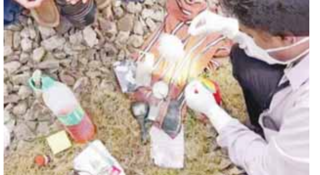
रेल पटरियों पर आरोपी के शवों से मिले सामान की जांच करती टीम

केरल के कोझिकोड में रविवार को एकसप्रेस ट्रेन में एक व्यक्ति ने यात्रियों पर पेट्रोल छिड़क कर आग लगा दी। इसमें कम से कम नौ यात्री झुलते हुए मरे। बाद में दो वर्षीय बच्ची समेत तीन लोगों के शव रेल पटरियों पर मिले। समझा जाता है कि आग से बच्चे के लिए चलती ट्रेन से कूदने के कारण इनकी मौत हुई। मामले में केरल पुलिस नोएडा के रहने वाले संदिग्ध आरोपी की तलाश कर रही है। केंद्रीय गृह एवं रेल मंत्रालय ने केरल सरकार से पूरे मामले की रिपोर्ट तलब की है। राज्य सरकार ने मामले