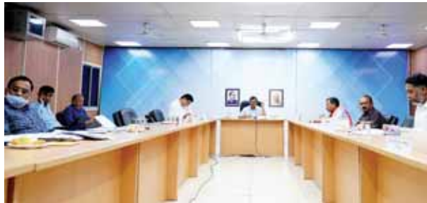
मुख्यमंत्री अरविंद केजरीवाल अधिकारियों के साथ बैठक करते हुए।

पड़ोसी राज्यों पर निर्भरता कम करने और दिल्ली को पानी के मामले में आत्मनिर्भर बनाने की कोशिश की जा रही है। पानी की आपूर्ति बढ़ाने के लिए अनधिकृत कालोनियों समेत पानी की कमी वाले क्षेत्रों में पर्याप्त स्वच्छ जल उपलब्ध कराने के लिए द्यूबवेल्स के साथ पहले चरण में 500 आरओ प्लांट लगाए जाएंगे।