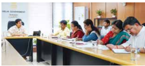
कल्चरल सेंटर को लेकर समीक्षा बैठक करतीं मंत्री आतिथी मालेना।

राजधानी दिल्ली में कला और संस्कृति को बढ़ावा देने के लिए केजरीवाल सरकार विकासपुरी में एक विश्व स्तरीय कल्चरल-सेण्टर बनवायेगी। कल्चरल सेंटर शानदार ऑडिटोरियम, आर्ट गैलरी, लाइब्रेरी, कॉफ़ेस रूम, ट्रेनिंग हॉल, गेस्ट रूम सहित तमाम अत्याधुनिक सुविधाओं से लैस होगा और करीब 1.09 एकड़ में फैला होगा। इस बावत कला, संस्कृति और भाषा मंत्री आतिथी ने साहित्य कला परिषद के अधिकारियों के साथ इस भविष्य के कल्चरल सेंटर को लेकर सोमवार को समीक्षा बैठक की। राज्य