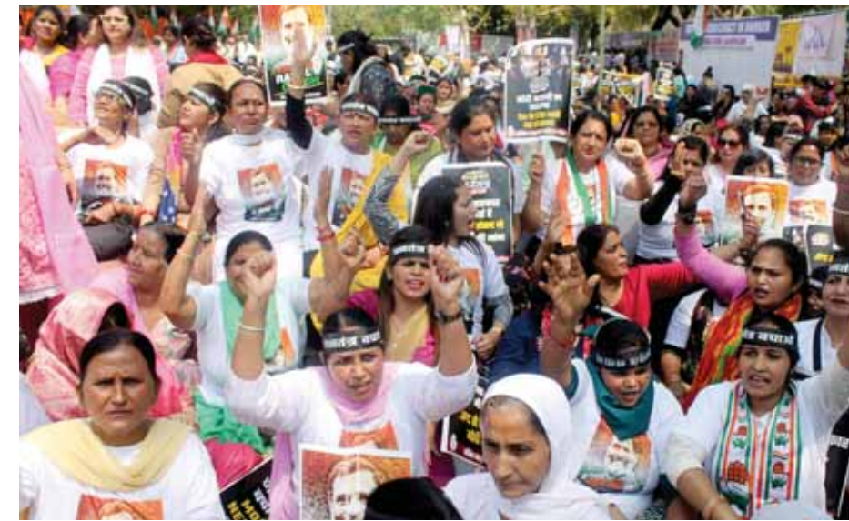
राहुल गांधी के लोकसभा से सदस्यता रद्द करने के विरोध में अखिल भारतीय महिला कांग्रेस ने जनतंत्र बचाओ रैली आयोजित की। एआईएमसी के सदस्यों का कहना है कि पूरा विपक्ष अखंडी मामले पर जेपीसी जांच की मांग कर रहा है लेकिन सरकार खामोश है। कांग्रेस ने लोकतंत्र की आवाज को दबाने के खिलाफ जनतंत्र बचाओ रैली का आयोजन किया है।

नई दिल्ली। मध्य दिल्ली के नबी करीम इलाके में प्लास्टिक के थैले में एक व्यक्ति का शव मिला है। पुलिस के मुताबिक, उसे चिन्योत बस्ती इलाके में एक व्यक्ति का शव पाए जाने की सूचना सुबह करीब साढ़े सात बजे मिली। पुलिस के एक वरिष्ठ अधिकारी के मुताबिक, व्यक्ति की उम्र 30 से 35 वर्ष के बीच है। पुलिस अधिकारी ने बताया कि मृतक के सिर पर चोट के निशान हैं। पुलिस ने मौके का मुआयना किया और मुल्तानी ढांडा की गली संख्या-10 में खून के धब्बे पाए, जो मुख्य रूप से शव को घसीटे जाने के कारण बने होंगे। शुरुआती जांच में अपराध स्थल से लगभग 80 मीटर की दूरी पर स्थित एक घर में रहने वाले एक व्यक्ति से संदेह पैदा हुआ है। संदिग्ध व्यक्ति फरार है।