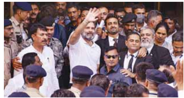
सूत्र में सोमवार को अदालत परिसर में लोगों का अभिवादन करते राहुल गांधी