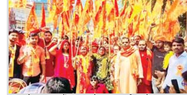
गुरुग्राम के सुभाष नगर में हनुमान जन्मोत्सव पर यात्रा निकालते श्रद्धालु।

हनुमान जन्मोत्सव पर सुभाष नगर से निकाली भव्य यात्रा