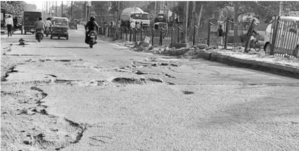
जिले की सड़क और पुलों के गड्ढों के दृश्य।

शहर में सड़कों पर बने गड्ढे और अन्य खामियों के कारण लोग आए दिन जान गंवा रहे हैं, लेकिन सड़कों की दशा में सुधार कराने की बजाए पुलिस चालान काट रही है। पिछले दिन महीने में शहर के विभिन्न हिस्सों में हुई सड़क दुर्घटनाओं में 75 लोग जान गंवा चुके हैं। वहीं पुलिस द्वारा इन तीन महीनों में सैकड़ों चालान काट कर तीन करोड़ रुपये जुर्माना वसूला है।