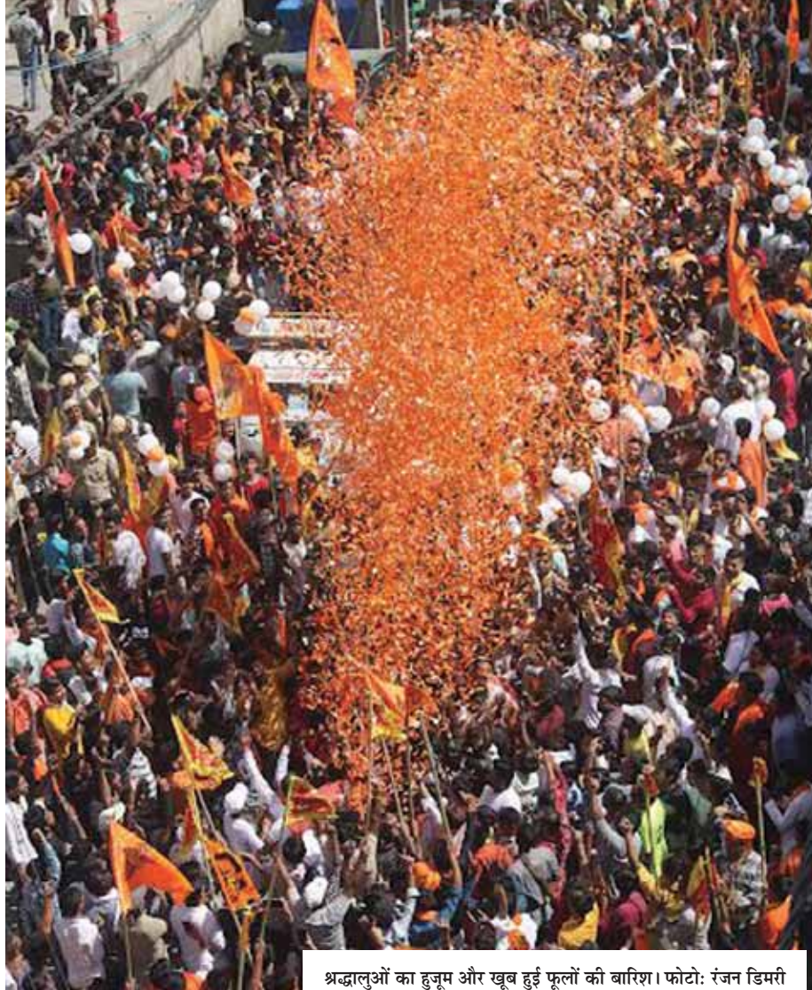
श्रद्धालुओं का हुजूम और खूब हुड़ फूलों की बारिश।

जहांगीरपुरी में गत वर्ष हनुमान जयंती के दिन शोभायात्रा निकली थी तो इसमें बवाल मचा गया था। कई दिनों तक इलाके में दंगे जैसे हालात बने रहें। इस बार शोभायात्रा के लिए जब हजारों की संख्या में वहां हुजूम उमड़ा तब पुलिस को भी व्यवस्था बनाने में पसीने छूटने लगे। निर्धारित दूरी तक पुलिस ने बैरिकेडिंग की और बड़ी संख्या में