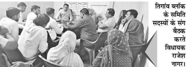
तिगांव ब्लॉक के समिति सदस्यों के संग बैठक करते विधायक राजेश नागर।

फरीदाबाद। विधायक राजेश नागर ने तिगांव ब्लॉक के सभी समिति सदस्यों के साथ बैठक कर उनकी समस्याओं और सुझावों के बारे में जानकारी ली। इस बैठक में अधिकांश समस्याएं सड़कों के निर्माण के बारे में पता चली। जिन पर जल्द काम करने के लिए विधायक राजेश नागर ने उन्हें आश्वासन दिया।