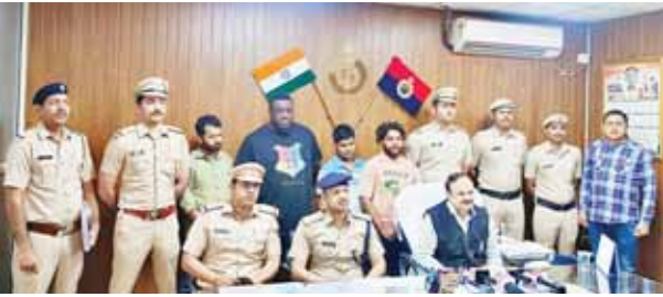
गुरुग्राम में महिलाओं से दोस्ती करके धोखाधड़ी से रुपये ऐंठने के आरोपी पुलिस गिरफ्तार में।

जानकारी के अनुसार 22 मार्च 2023 को एक महिला ने पुलिस थाना साईबर अपराध पूर्ण में शिकायत दी थी। जिसमें कहा गया कि जनवरी 2023 में उसके पास एक इंस्टाग्राम आईडी से फ्रेंड रिक्वेस्ट आई। जिसमें