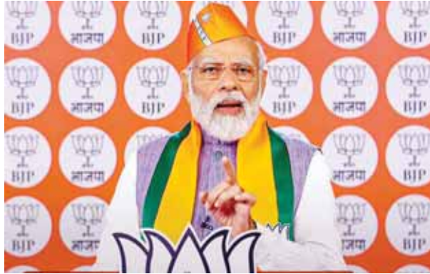
भाजपा के 44वें स्थापना दिवस पर पार्टी सदस्यों को संबोधित करते प्रधानमंत्री नरेंद्र मोदी

मेरी कन्न खोदने की धमकी दे रहे हैं। मोदी ने 10 लाख से अधिक स्थानों पर उनके करीब 50 मिनट के संबोधन को सुनने वाले पार्टी सदस्यों को अति आत्मविश्वास के प्रति आगाह किया और कहा कि यह पहले से ही कहा जा चुका है कि 2024 के लोकसभा चुनाव में सत्तारूढ़ पार्टी को कोई नहीं हरा सकता। उन्होंने कहा कि पहले से ही कहा जा रहा है कि 2024 के लोकसभा चुनावों में भाजपा को कोई नहीं हरा सकता लेकिन पार्टी कार्यकर्ताओं को अति आत्मविश्वास की भावना से सचेत रहना होगा। उन्होंने कहा, हम दुनिया की सबसे बड़ी पार्टी होने के बाद भी अति आत्मविश्वास का शिकार नहीं होना है। लोगों ने अभी से कहना शुरू कर दिया है कि 2024 में भाजपा को कोई नहीं हरा सकता। यह बात सही भी है लेकिन हमें एक भाजपा कार्यकर्ता होने के नाते इस देश के हर नागरिक का दिल जीतना है। प्रधानमंत्री ने कहा,