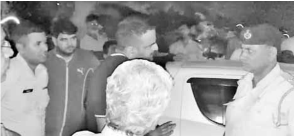
सोसायटी निवासियों और पवन के बीच मामला सुलझाते पुलिसकर्मी।