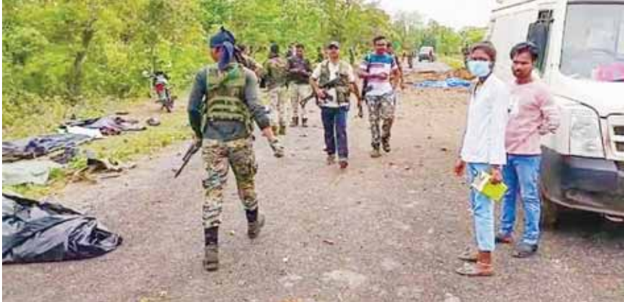
देतेवाड़ा में पुलिस वाहन पर नक्सली हमले के बाद घटनास्थल पर तैनात सुरक्षा बलों के जवान

● घटना में चालक की भी मौत, छत्तीसगढ़ के देतेवाड़ा जिले में हुई घटना, माओवादियों के खिलाफ ऑपरेशन से लौट रहे सुरक्षाकर्मी के वाहनों के काफिले पर घात लगाकर किया हमला, आईईडी का इस्तेमाल एंजेंसी। देतेवाड़ा