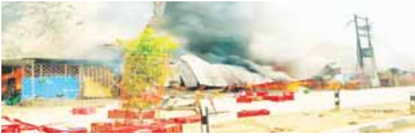
संवाददाता । चित्रकूट

सीतापुर सब्जी मंडी में भीषण आग लगने से आसपास के दुकानदारों में अफरा-तफरी मच गई। 15 से अधिक दुकानें जलकर राख हो गईं। दुकानों में रखा आलू, सेब, केला सब जल गया। लोगों ने पुलिस और दमकल को फोन से सूचना दी। ग्रामीण आग बुझाने में जुट गए। मौके पर पुलिस बल व दमकल टीम आग बुझा रही है।