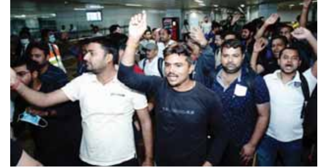
ऑपरेशन कावेरी के तहत 360 भारतीयों का पहला जत्था बुधवार दे रात नई दिल्ली पहुंचा

गुरुबुद्ध से घिरे अफ्रीकी देश सूडान से भारतीयों का पहला जत्था बुधवार दे रात नई दिल्ली पहुंच गया। इन लोगों को पहले हिंसा प्रभावित देश से निकालकर सऊदी अरब के जेदा लाया गया। वहां से 360 लोगों के साथ विमान ने दिल्ली के लिए उड़ान भरी थी। भारतीय वायु सेना के दो परिवहन विमानों के जरिए हिंसाग्रस्त सूडान से अब तक कम से कम 534