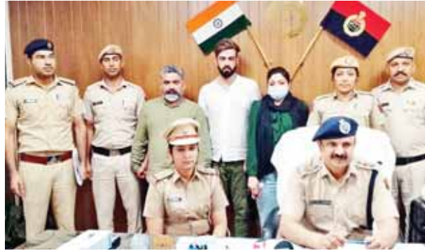
गुरुग्राम पुलिस की गिरफ्तार में हनी ट्रेप के आरोपी।

हनी ट्रेप करके एक महिला, उसका पति व एक अन्य साथी ने एक व्यक्ति से 60 लाख रुपये, कार, महंगा फोन, फर्नीचर और ज्वेलरी समेत अन्य सामान ठग लिया। इन सबके बाद उन्होंने 30 लाख रुपये और मांगे तो पीड़ित ने पुलिस को सूचना दी। पुलिस ने दंपति को गिरफ्तार कर लिया है।