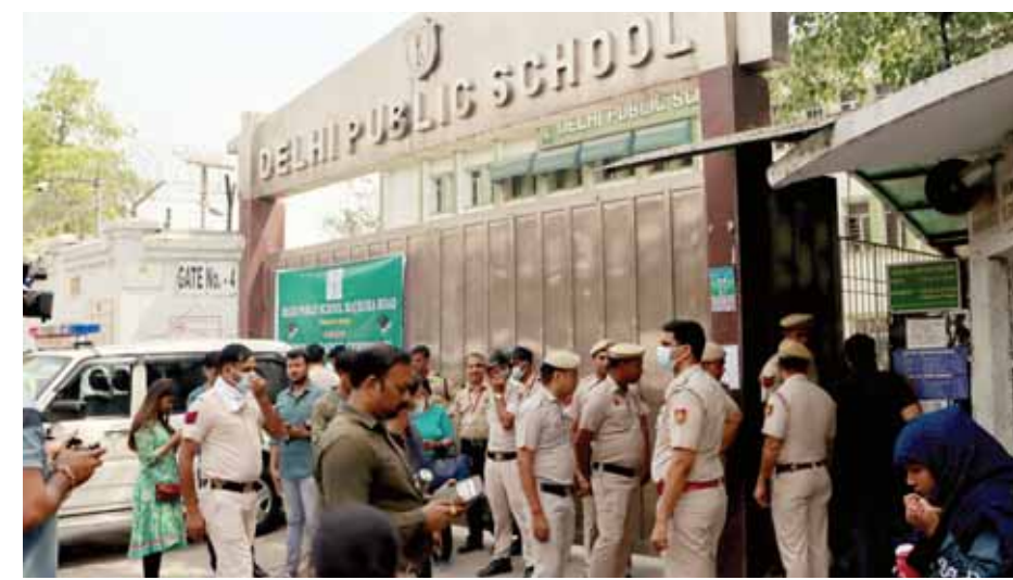
नई दिल्ली में बुधवार को मथुरा रोड स्थित दिल्ली पब्लिक स्कूल में बम की सूचना के बाद मौके पर पुलिस और मीडियाकर्मियों का दृश्य।

नहीं माने। वह स्थायी समिति के मामले को दिल्ली उच्च न्यायालय में ले गए लेकिन वहाँ भी आप और सरकार फैसले में देरी के लिए हर संभव प्रयास कर रही है।