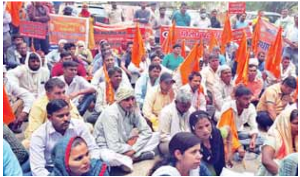
गुरुग्राम में अपनी मांगों को लेकर धरना-प्रदर्शन करते भारतीय मजदूर संघ से संबंधित सदस्य।

भारतीय मजदूर संघ के आह्वान पर राष्ट्रीय सभा सभा जिला मुख्यालयों पर कार्यकर्ताओं ने रोष प्रदर्शन कर केंद्र सरकार एवं राज्य सरकार के नाम जिला उपायुक्त के माध्यम से मांग पत्र सौंपा। गुरुग्राम में भारतीय मजदूर संघ के कार्यकर्ताओं ने राजीव चौक से जिला सचिवालय पैदल मार्च निकाला।