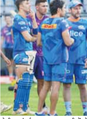
होगी। मुंबई इस समय दस टीमों में आठवें स्थान पर है। गेंदबाजी में देखना होगा कि कोहनी की चोट से जुड़ा रहे इंग्लैंड के जोफ्रा आर्चर खेलने के लिए फिट हैं या नहीं। जासन बेहेरिनडोफ, रिले मेरॉडिथ और अर्जुन तेंदुलकर महंगे साबित हुए हैं। दूसरी ओर राजस्थान के बल्लेबाज इस पिच पर 200 से अधिक रन बना सकते हैं। उनके पास जोस बटलर और यशस्वी जायसवाल जैसे शीर्षक्रम के बल्लेबाज हैं तो मध्यक्रम में संजू सैमसन, देवदत्त पड्डिकल , शिमरोन हेतमाएर और ध्रुव जुल्ल उतरते हैं। जुल्ल ने लगातार अच्छा प्रदर्शन किया है।

खराब दौर से जुड़ा रही मुंबई इंडियंस को इंडियन प्रीमियर लीग के मैच में रविवार को राजस्थान रॉयल्स के बल्लेबाजों को रोकने के लिए अपना सर्वश्रेष्ठ प्रदर्शन करना होगा। राजस्थान इस समय अंकतालिका में शीर्ष पर है जिसने चेन्नई सुपर किंग्स पर पिछले मैच में एकरफराज जीत दर्ज की। पिछले तीन में से दो मैच गंवाने के बावजूद संजू सैमसन की टीम हर विभागा में बेहतरीन फॉर्म में है। दूसरी ओर मुंबई की डैथ गेंदबाजी चिंता का विषय बनी हुई है जिसकी वजह से उसे पिछले दो मैचों में पराजय का सामना करना पड़ा। पिछले सप्ताह वानखेडे स्टेडियम पर हुए मैच में मुंबई के गेदबाजों ने आखिरी पांच ओवरों में 96 रन देकर पंजाब को चमत्कारिक जीत दर्ज करने का मौका दिया। इसके अलावा गुजरात टाइटंस के खिलाफ आखिरी 24 गेंद में 70 रन दे डाले। मुंबई के शीर्षक्रम के बल्लेबाजों को भी बेहतर प्रदर्शन करना होगा क्योंकि राजस्थान की बल्लेबाजी में काफी गहराई है। रोहित शर्मा, ईशान किशन और सूर्यकुमार यादव को प्रदर्शन में निरंतरता लानी