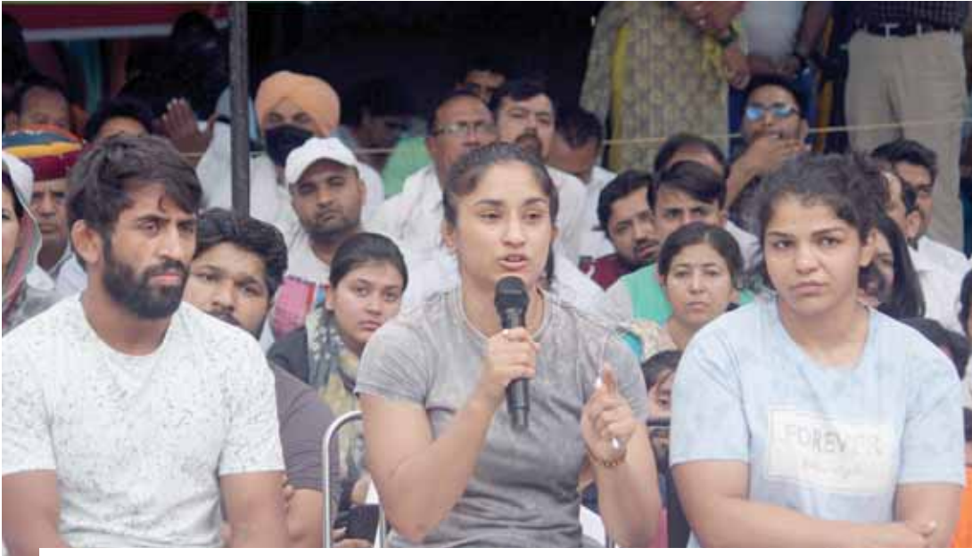
प्रेस वार्ता के दौरान पत्रकारों के सवालों को जवाब देती विनेश फोगाट, साथ में पहलवान साक्षी मलिक व बजरंग पुनिया।

कांग्रेस पार्टी की प्रियंका गांधी और भूपेंद्र सिंह हुड्डा, दिल्ली के मुख्यमंत्री अरविंद केजरीवाल, राष्ट्रीय लोकदल के नेता जयंत चौधरी, जम्मू और कश्मीर के पूर्व राज्यपाल सत्यपाल मलिक, दिल्ली सरकार के मंत्रियों