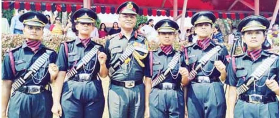
सेना की तोपखाना रेजीमेंट में पहली बार कमीशन पाने वाली पांच महिला अफसर। तोपखाना रेजीमेंट के महाविदेशक (डेसिगनेट) ने पासिंग आउट परेड के दौरान महिला अफसरों का स्वागत किया।