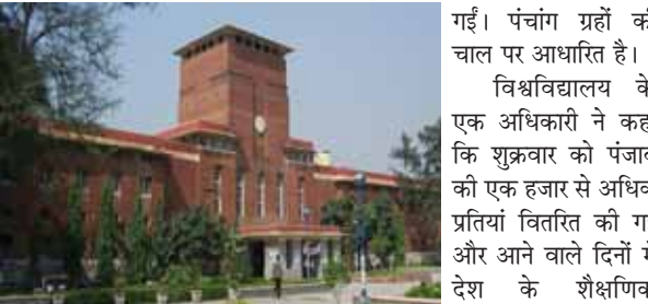
प्राचीन भारतीय ज्ञान प्रणाली पर आधारित पंचांग शैक्षणिक समुदाय में नौ हजार और

अधिकारियों ने शनिवार को यह जानकारी दी। विश्वविद्यालय के एक अधिकारी ने शनिवार को यह जानकारी देते हुए कहा कि यह पंचांग