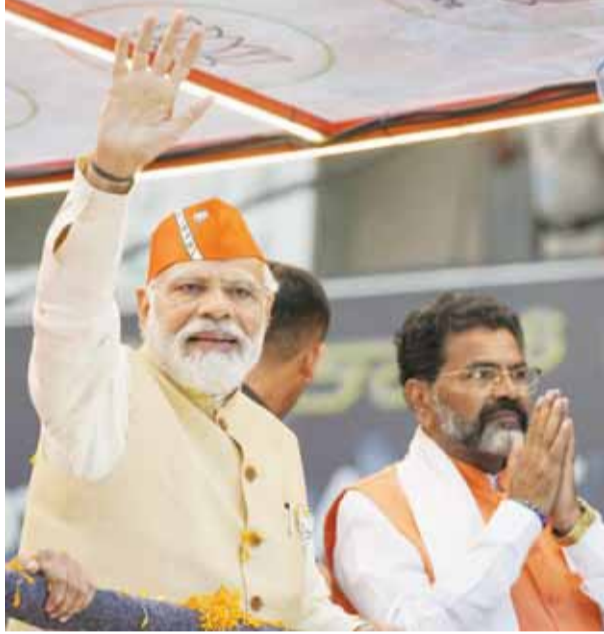
बंगलुरु में भाजपा प्रत्याशियों के पक्ष में रौशनी करते प्रधानमंत्री नरेंद्र मोदी

कांग्रेस पर कर्नाटक में लिंगायत समुदाय का भी अपमान करने का आरोप लगाते हुए मोदी ने कहा कि पार्टी ने बाबासाहेब आंबेडकर और वीर सावरकर को भी अपशब्द कहे हैं। कर्नाटक में 29 मार्च को चुनाव