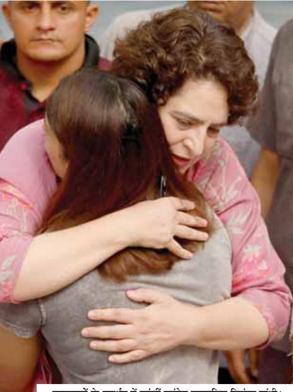
पहलवानों के समर्थन में पहुंची कांग्रेस महासचिव प्रियंका गांधी।

नई दिल्ली। कांग्रेस महासचिव प्रियंका गांधी वाड़ा ने शनिवार सुबह जंतर-मंतर पहुंच धरने पर बैठी पहलवानों से मुलाकात की और अपना समर्थन जताया। प्रियंका ने आरोप लगाया कि केंद्र सरकार एक बाहुबली और माफिया के सामने नतमस्तक हो गई है। प्रियंका ने यह भी कहा कि सरकार भारतीय कुश्ती महासंघ के प्रमुख बृजभूषण शरण सिंह को बचा रही है। कांग्रेस महासचिव ने कहा कि सबसे पहले सिंह को उनके पद से हटाया जाना चाहिए और उन्हें गिरफ्तार किया जाए, ताकि महिला पहलवानों को न्याय मिल सके (प्रियंका कर्नाटक विधानसभा चुनाव के लिए प्रचार के वास्ते खाना होने से पहले शनिवार सुबह जंतर-मंतर पहुंचीं। उन्होंने महिला पहलवानों से अलग बातचीत भी की। प्रियंका से बातचीत में महिला पहलवान भावुक हो गईं। प्रियंका करीब एक घंटे तक वहाँ रहीं। इस दौरान, दीपेंद्र हुड्डा भी उनके साथ थे। कांग्रेस महासचिव ने बाद में एक फेसबुक पोस्ट में कहा कि ये खिलाड़ी हमारा मान हैं। ये देश के लिए पदक जीतती हैं। पूरा देश उनके साथ है। इन्हें न्याय मिलना चाहिए। प्रियंका ने जोर देकर कहा कि इस मामले में कोई राजनीति नहीं होनी चाहिए।