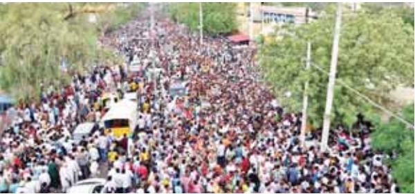
शनिवार को डेरा सच्चा सौदा ने 75वें रूहानी स्थापना दिवस पर आयोजित भंडारा कार्यक्रम में पहुंची साध-संगत का नजारा।