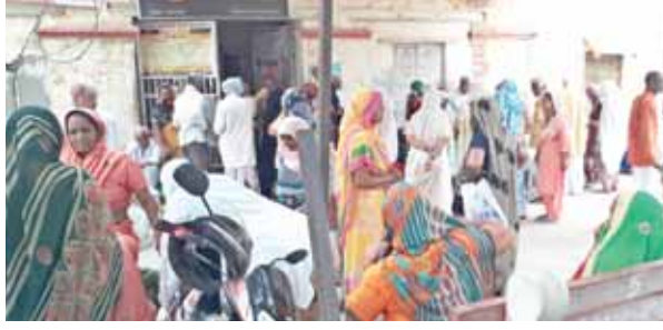
डाकघर सोहना पर पेंशनधारकों की लगी भीड़।

सोहना के मुख्य डाकघर में आधार कार्ड व पेन कार्ड लिंक न होने के कारण हजारों पेंशनधारकों की पेंशन पर प्रश्नचिह्न लगा। 80 फीसदी पेंशनधारकों की पेंशन न मिलने से हड़कंप मच गया। शहर में स्थित मुख्य डाकघर में पेंशन लेने आ रहे पेंशनधारक दूसरे दिन भी खाली हाथ अपने घरों को बैरंग लौट गए। केवल उन पेंशनधारकों को पेंशन दी गई। जिनका पहले से आधार कार्ड लाने व पेन कार्ड लिंक था। ऐसे पेंशनधारकों की संख्या 20 फीसदी है। मुख्य डाकघर से हर माह करीब 4 हजार पेंशनधारक हैं। जिनमें विधवा, वृद्ध, दिव्यांगजन आदि शामिल हैं।