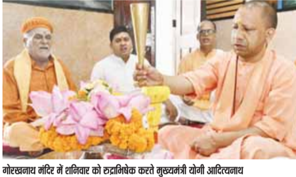
गोरखनाथ मंदिर में शनिवार को छद्मविधेक करते मुख्यमंत्री योगी आदित्यनाथ

जाती थी। गरीबों की सम्पत्तियों, व्यापारियों के प्रतिष्ठानों पर गुंडे, माफिया, सत्ताधारी दल के लोग कब्जा कर लेते थे, जबकि आज यूपी इस अराजकता से मुक्त हो चुका है। व्यापार उद्योग के क्षेत्र में रिकॉर्ड के अनेक कार्यों हुए हैं। आज वैश्विक बाजार पूरी तरह भारत के लिए खुला हुआ है। इन सबका सकारात्मक प्रभाव प्रति व्यक्ति आय और जीवन स्तर पर पड़ा है। भाजपा सरकार में बल्डै क्लास सिटी बनाने के लिए स्मार्ट एवं सेफ सिटी के कार्यक्रम चलाए जा रहे हैं। केंद्र सरकार में ती