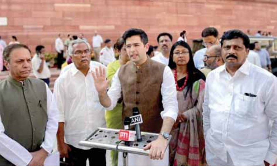
संसद में दिल्ली अध्यादेश के संबंध में प्रकरणों को संबोधित करते आप नेता व राज्यसभा सांसद राघव चड्ढा व अन्य पार्टी नेता।

ऐसे में राज्यसभा में आम आदमी पार्टी के सभी सदस्यों से अनुरोध है 4 अगस्त तक सदन की कार्यवाही स्थगित होने तक सुबह 11 बजे से सदन में बिना रुके उपस्थित रहें और पार्टी के रुख का समर्थन करें।