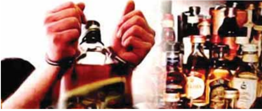
दरज कराया है।

नोएडा की कंपनी ने छत्तीसगढ़ में शराब के डुप्लीगेट होलोग्राम सप्लाई कर दिए। इन होलोग्राम को लगाकर करोड़ों रुपये की शराब अवैध रूप से बेच दी गई। इससे छत्तीसगढ़ सरकार को करीब 1200 करोड़ रुपये के राजस्व का घाटा हुआ। ये सब नोएडा की कंपनी ने छत्तीसगढ़ के आबकारी विभाग के अधिकारियों की साठगांठ से किया। लंबी जांच पड़ताल के बाद इस मामले में 2 अधिकारियों सहित 5 लोगों के खिलाफ नोएडा में केस