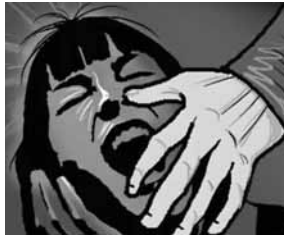
महिला थाना पुलिस ने किया दुष्कर्म करने का मुकदमा दर्ज

एक विवाहिता को मुंह दबाकर अपहरण किया गया। इसके बाद अपने घर के अंदर ले जाकर उसके साथ दुष्कर्म किया। विवाहिता की सास आरोपी के घर से उसे लेने पहुंची तो चाकू निकालकर उसे व उसकी सास को जान से मारने की धमकी दी गई। महिला थाना पुलिस ने अपहरण कर दुष्कर्म करने का मुकदमा दर्ज कर कार्रवाई शुरू कर दी है।