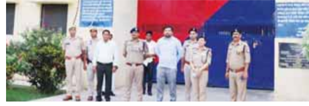
संवाददाता । चित्रकूट

जिलाधिकारी अधिभेक आनन्द तथा पुलिस अधीक्षक वृंदा शुक्ला ने जिला कारागार का औचक निरीक्षण कर व्यवस्थाओं का जायजा लिया। इस दौरान डीएम ने जेल अधीक्षक से कारागार की सुरक्षा व्यवस्था चुस्त-दुरुस्त रखने एवं सीसीटीवी लगातार चालू रखने के कड़े निर्देश दिये।