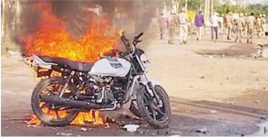
हरियाणा के नूंह जिले में विहिप की शोभायात्रा के दौरान दंगाड़यों ने एक गोटरेसइकिल को लगा दी आग

हरियाणा के नूंह जिले में भीड़ के विश्व हिन्दू परिषद के जुलूस को रोकने की कोशिश करने पर सोमवार को हिंसा भड़क उठी, जिसमें होमगार्ड के दो जवानों की मौत हो गई एवं दस से अधिक पुलिसकर्मी घायल हुए हैं। उग्र भीड़ ने जुलूस पर पथराव किया और कई वाहनों को आग के हवाले कर दिया। नूंह में हिंसा होने की खबर फैलते ही राज्य के फिरोजपुर झिरका, सोहना समेत कई कस्बों-शहरों में दुकानों और वाहनों को फूंक दिया गया और सड़क जाम कर दी। नूंह में