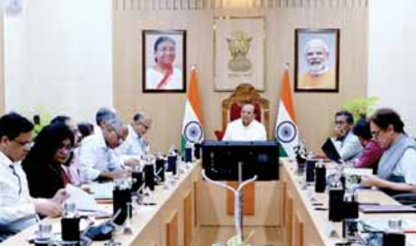
जी-20 शिखर सम्मेलन की तैयारियों की बैठक लेते उपराज्यपाल विनय सक्सेना।

नुकसान हुआ है। इसके मद्देनजर उपराज्यपाल विनय कुमार सक्सेना ने सोमवार को सितंबर में होने वाले जी-20 शिखर सम्मेलन की तैयारियों