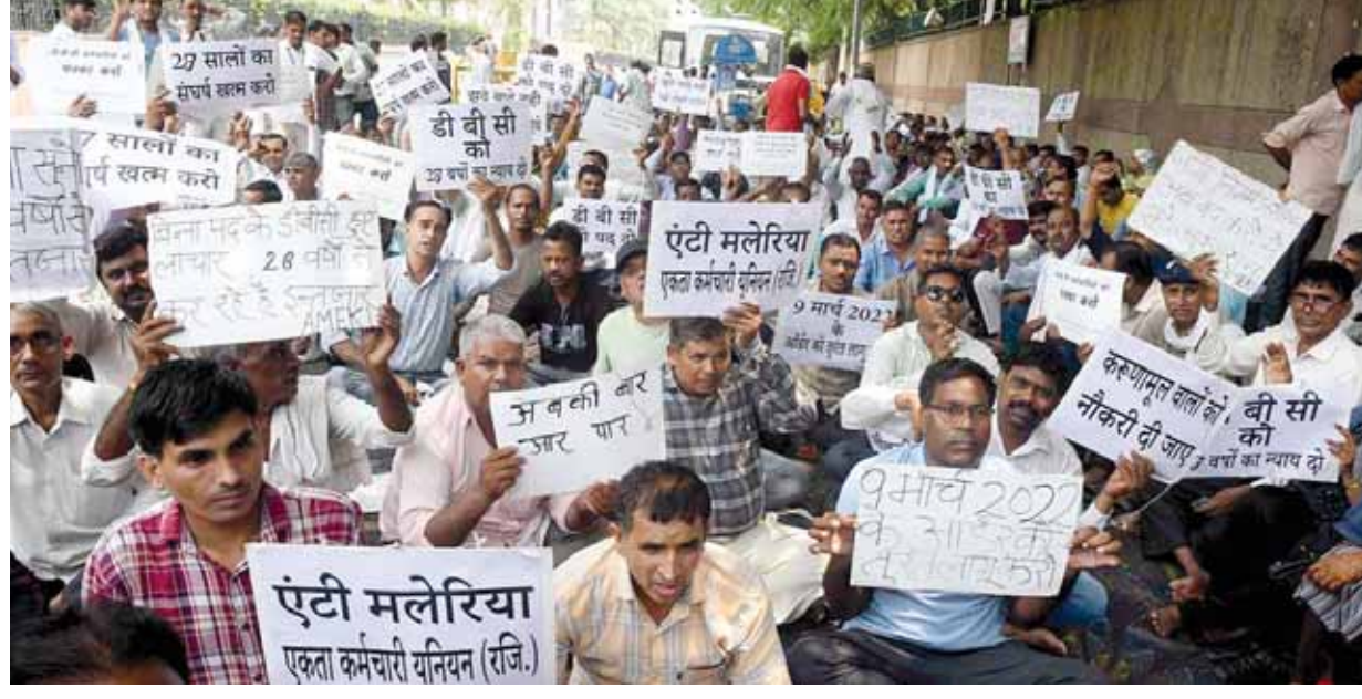
दिल्ली सचिवालय के बाहर अपनी मांगों को लेकर विरोध प्रदर्शन करते एंटी मलेरिया एकता कर्मचारी यूनियन के सदस्य।

नई दिल्ली। महिला एवं बाल विकास मंत्री आतिथी ने तिगड़ी स्थित सेंट्रलाइन्ड आंगनवाड़ी किचन निरीक्षण खाने के गुणवत्ता की जांच की। इस सेंट्रलाइन्ड किचन के जरिए दिल्ली सरकार 775 आंगनवाड़ियों में आने वाले 42,000 से अधिक बच्चों व गर्भवती महिलाओं को मुफ्त में पोषक आहार मुहैया कराया जाता है। आतिथी ने कहा कि, केजरीवाल सरकार हर जरूरतमंद महिलाओं और बच्चों तक पोषिक आहार पहुंचाने के लिए प्रतिबद्ध है। इस दिशा में सरकार 11 सेंट्रलाइन्ड किचनों के जरिए प्रतिदिन दिल्ली भर में 8 लाख बच्चों और महिलाओं तक पोषिक पका खाना और टेक होम राशन (टीएचआर) पहुंचाने का काम कर रही है।