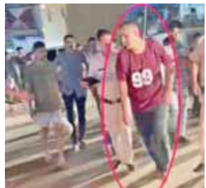
नशे में धुत हवलदार को पकड़कर ले जाते पुलिसकर्मी।

मानेसर चौक पर नशे में धुत एक हवलदार ने यातायात नियमों को तो तोड़ा ही, साथ में कई लोगों को चोटिल भी कर दिया। उनकी इस हरकत की सूचना पाकर पुलिस मौके पर पहुंची और उसे अपनी हिरासत में ले लिया। आरोपी हवलदार के खिलाफ मामला दर्ज सस्पेंड कर दिया