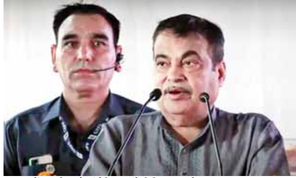
गुरुग्राम में समारोह को संबोधित करते नितिन गडकरी।

केंद्रीय सड़क परिवहन मंत्री ने गुरुग्राम की जनता से कहा कि उन्हें यातायात के जाम से जल्द ही मुक्ति मिल जाएगी। दिल्ली का रिंग रोड यूईआर-टू पानीपत से शुरू हो रहा है। इससे एयरपोर्ट पहुंचने में 15 से 20 मिनट का समय लगेगा। वे सोमवार को गुरुग्राम में भारत अंतरराष्ट्रीय सांस्कृतिक केंद्र के शिलान्यास समारोह में पहुंचे थे।