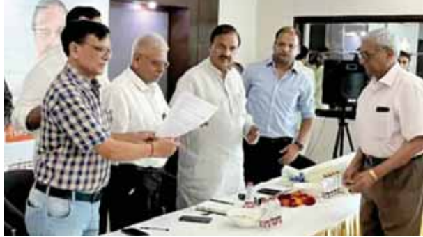
नोएडा में जनसंवाद कार्यक्रम के तहत समस्याओं को सुनते सांसद महेश शर्मा।

नोएडा के सेक्टर-119 की एलिटको आमंत्रण सोसाइटी में भाजपा सांसद डॉक्टर महेश शर्मा जनसंवाद कार्यक्रम के तहत रजिस्ट्रेंस से रूबरू हुए। सांसद ने सोसाइटी सहित आसपास की जन समस्याओं से जुड़े मुद्दों पर सुनवाई की। इस दौरान मौजूद नोएडा अर्थोर्टी के अधिकारियों को निर्देश के साथ संबंधित विभागों से शीघ्र समाधान का आश्वासन दिया। सांसद डा महेश शर्मा ने भाजपा