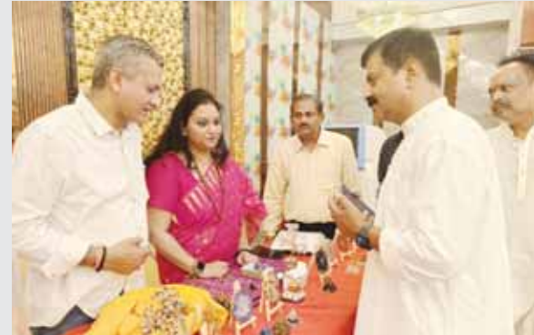
गाजियाबाद के वंसुधरा में आयोजित ज्योतिष शिविर में जुटे गणमान्य लोग।