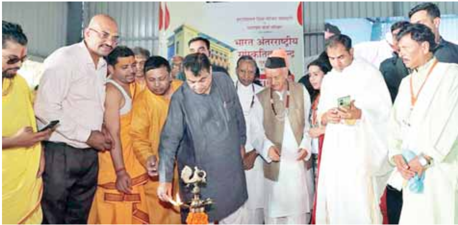
गुरुग्राम में भारत अंतरराष्ट्रीय सांस्कृतिक केंद्र के शिलान्यास समारोह में दीप प्रज्वलित करते केंद्रीय मंत्री नितिन गडकरी।

केंद्रीय सड़क परिवहन मंत्री नितिन गडकरी ने कहा कि दुनिया में निराशा का भाव फैला हुआ है। आज विश्व शांति के लिए दुनिया भारतीय संस्कृति की तरफ देख रही है। हमारे संतों ने विदेशों की धरती पर हमारी संस्कृति, विरासत और इतिहास का प्रचार-प्रसार किया है। वहां के लोगों को नई दिशा दी है। हमारी उपासना पद्धति अलग-अलग हो सकती है, लेकिन संस्कृति, विरासत, इतिहास एक है और यही भारत को विशेषता है। वे सोमवार को गुरुग्राम में बने वाले भारत अंतरराष्ट्रीय सांस्कृतिक केंद्र के शिलान्यास अवसर पर बोल रहे थे। यह तीन दिवसीय संस्कृति महोत्सव सोमवार को संपन्न हो गया। इस अवसर पर महाराष्ट्र के पूर्व राज्यपाल भगतसिंह कोश्यारी और