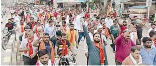
गुरुग्राम के खंड पटौदी में नूह हिंसा के विरोध में जुलूस निकालते हिंदू संगठनों के लोग।

मेवात में हुई हिंसा से आहत सैकड़ों की तादाद में आक्रोशित हिंदू संगठनों के सदस्य पटौदी के पुराने कोर्ट के बाहर एकत्रित हुए। इसके बाद वहां से प्रदर्शन करते हुए बाजारों को प्रदर्शनकारियों ने बंद करवाया। विश्व हिंदू परिषद के जिला अध्यक्ष