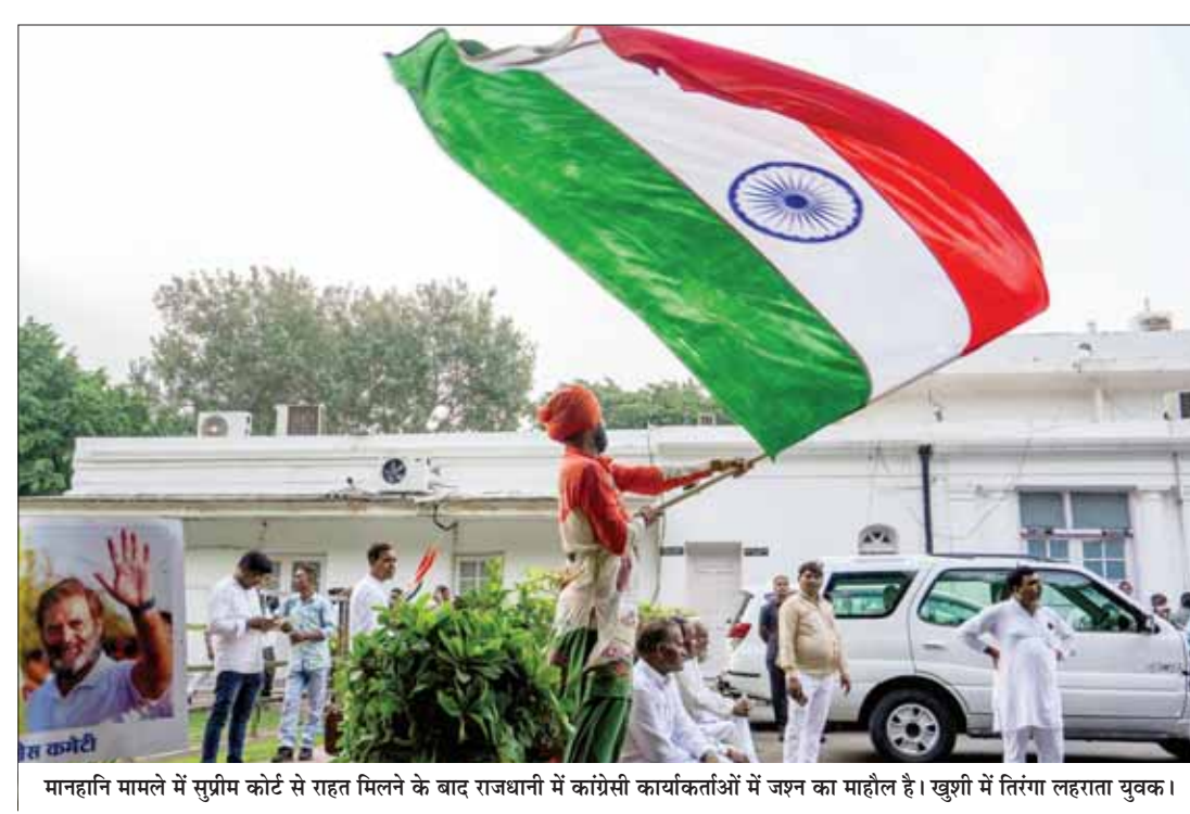
मानहानि मामले में सुप्रीम कोर्ट से राहत मिलने के बाद राजधानी में कांग्रेसी कार्यकर्ताओं में जश्न का माहौल है। खुशी में तिरंगा लहराता युवक।

गुजरात के पूर्व मंत्री पूर्णेश मोदी ने 13 अप्रैल 2019 को कर्नाटक के कोलार में एक चुनावी सभा में मोदी उपनाम के संबंध में की गई कथित विवादित टिप्पणी को लेकर राहुल के खिलाफ आपराधिक मानहानि का मुकदमा दर्ज कराया था। राहुल ने सभा में टिप्पणी की थी कि सभी चोरों का एक ही उपनाम मोदी कैसे हो सकता है?