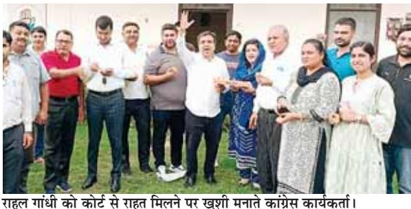
राहुल गांधी को कोर्ट से राहत मिलने पर खुशी मनाते कांग्रेस कार्यकर्ता।