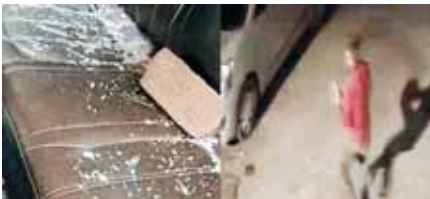
गुरुग्राम के भवानी एनक्लेव में शरारती तत्वों द्वारा तोड़ी गई गाड़ी के बाद अंदर पड़ी ईंट व सीसीटीवी में नजर आती एक उपद्रवी।

स्थानीय भवानी एनक्लेव में गुरुवार आधी रात के बाद शरारती तत्वों ने उत्पात मचाया। रात के अंधेरे का फायदा उठाकर युवकों ने क्षेत्र में खड़ी 30 गाड़ियों को पत्थर मारकर तोड़ा गया। शुरुवार को सुबह जब कालोनी के लोग उठे तो अपनी गाड़ियों की हालत देखी। इस संबंध में स्थानीय लोगों ने सेक्टर-9 थाना में अपनी शिकायत दर्ज कराई है। इसी बीच एक युवक गाड़ी में ईंट मारता हुआ सीसीटीवी में कैद हुआ है। फिलहाल पुलिस मामले की जांच में जुट गई है। गुरुवार देर रात लगभग डेढ़-दो बजे के करीब लाइट चली गई। लाइट जाते ही पूरी कालोनी में अंधेरा छा गया। इसी बीच कुछ शरारती किस्म के युवक आए और उन्होंने