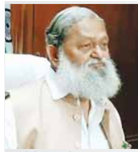
पत्रकारों से बात करते गृह मंत्री अनिल विज।

हरियाणा के गृह मंत्री अनिल विज ने कहा कि नूह हिंसा को अंजाम देने के लिए प्री-प्लान किया गया। गोलियां चलाई गईं और पहाड़ों पर चढ़कर गोलियां मारी गईं। इसी प्रकार छतों पर पत्थर इकट्ठे किए गए व मोर्चे बनाए गए। इन सबकी जानकारी ली जा रही है और इन सब पर कार्यवाही की जाएगी। यह बात उन्होंने चण्डीगढ़ में पत्रकारों से बातचीत में कही। उन्होंने कहा कि यह प्री-प्लान था और वहां पर लाठियों थी, मोर्चे बनाए गए, गोलियां चलाई गईं, यह किसी न किसी ने व्यवस्था की है। यह प्लानिंग के साथ किया गया है। हम इसकी गहराई तक जा रहे हैं। उन्होंने कहा कि नूह हिंसा के संबंध में जिस-जिस पर कसब बनाता है उस पर कार्यवाही की जाएगी और बुलडोजर के तहत भी जरूरत होने पर कार्यवाही होगी। उन्होंने कहा कि लोगों के ब्यान लिए जा रहे हैं और सीसीटीवी फुटेज खंगाली जा रही है। उस समय कवरज करने गए पत्रकारों से भी उनके द्वारा आग्रह किया गया है कि वीडियो व फोटो है तो अधिकारियों को मुहैया कराएं।