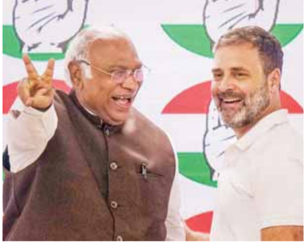
नई दिल्ली स्थित कांग्रेस मुख्यालय में राहुल गांधी और कांग्रेस अध्यक्ष मल्लिकार्जुन खरगे।

उच्चतम न्यायालय ने कांग्रेस नेता राहुल गांधी की लोकसभा सदस्यता बहाल करने का मार्ग प्रशस्त करते हुए मोदी उपनाम को लेकर की गई टिप्पणी के संबंध में 2019 में उनके खिलाफ दर्ज आपराधिक मानहानि मामले में शुक्रवार को उनकी दोषसिद्धि पर रोक लगा दी। लोकसभा अध्यक्ष अब उनकी सदस्यता बहाल कर सकते हैं या राहुल गांधी शीर्ष अदालत के आदेश के परिप्रेक्ष्य में एक सांसद के रूप में अपनी सदस्यता बहाल करने की अपील कर सकते हैं। लोकसभा में कांग्रेस के नेता अशोक रंजन चौधरी ने शुक्रवार को लोकसभा अध्यक्ष ओम