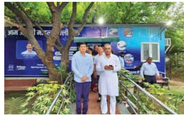
कर्नाटक के स्वास्थ्य मंत्री दिनेश गुंडुवाव व साथ में दिल्ली के मंत्री सौरभ भारद्वाज।