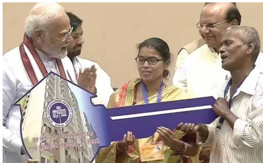
प्रधानमंत्री ने नवंबर 2022 में कालकाजी में यथास्थान झुग्गी-झोपड़ी पुनर्वास परियोजना के अंतर्गत बनाए गए फ्लैटों का किया था उद्घाटन। फाइल फोटो