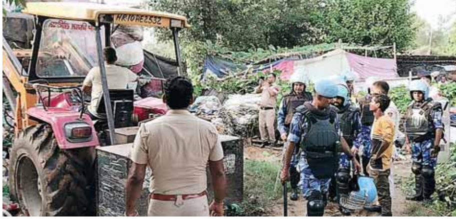
तावडू क्षेत्र में रोहिंग्याओं और अवैध घुसपैठियों के घरों को ढहाती जेसीबी।

नूह में 31 जुलाई 2023 को ब्रजमंडल धार्मिक यात्रा पर हमले के बाद हुए दंगों के बाद अब मनोहर सरकार के आदेश पर पुलिस ने क्षेत्र में अवैध रूप से रह रहे रोहिंग्याओं और अवैध घुसपैठियों के ठिकानों पर तालुका क्षेत्र में बुलडोजर चलाया है। इलाके में सरकारी जमीन पर कब्जा किए बैठे घुसपैठियों के 200 से ज्यादा घरों को ढहाया गया। इन क्षेत्रों, घरों में रह रहे युवकों का नाम एफआईआर में भी दर्ज है।