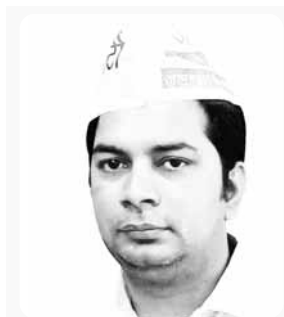
आप कार्यकर्ताओं ने जिले में चलाया बिजली आंदोलन अभियान

आम आदमी पार्टी के कार्यकर्ताओं ने शहर की में बिजली आंदोलन अभियान चलाया। इस दौरान आम आदमी पार्टी के कार्यकर्ताओं ने कॉलानोवासियों की समस्याओं को सुना। अभियान में लोगों से घर-घर जाकर आम आदमी पार्टी के कार्यकर्ताओं ने बिजली से संबंधित समस्याएं लिखीं और लोगों को आम आदमी पार्टी की नीतियों से अवगत कराया। उन्होंने कहा कि क्षेत्र में बिजली की बड़ी समस्या है, छह से आठ घंटे बिजली के कट लगते हैं। उन्होंने ने कहा कि जिला में प्रतिदिन सैकड़ों लोग आम आदमी पार्टी की नीतियों से प्रभावित होकर आम आदमी पार्टी में शामिल हो रहे हैं। जिस तरह दिल्ली और पंजाब में आम आदमी पार्टी बिजली, पानी, शिक्षा और स्वास्थ्य पर काम कर रही है। उसी तरह हरियाणा में भी आम आदमी पार्टी की सरकार बनने पर हर परिवार को बिजली 300 यूनिट प्रति महीना मुफ्त दी जाएगी। उन्होंने कहा