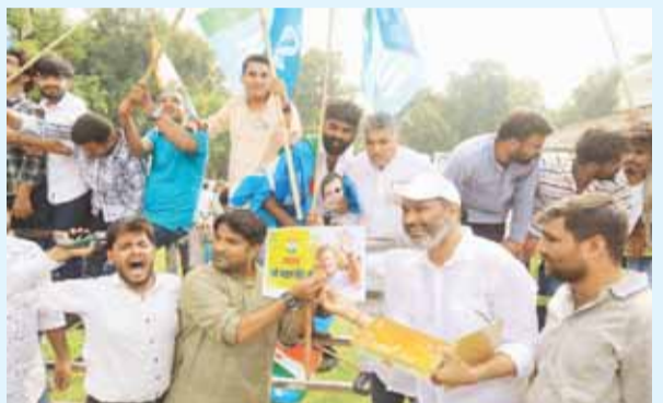
नई दिल्ली में शुक्रवार को जश्न मनाते कांग्रेस कार्यकर्ता।

कांग्रेस ने मोदी उपनाम वाली टिप्पणी से जुड़े मानहानि के मामले में शुक्रवार को उच्चतम न्यायालय से राहुल गांधी को राहत मिलने को लोकतंत्र, संविधान, सत्य और जनता की जीत करार दिया और यह आरोप भी लगाया कि इससे भारतीय जनता पार्टी की साजिश बेनकाब हो गई है। राहुल गांधी ने कहा कि सच्चाई की हमेशा जीत होती है और वह भारत की अवधारणा (आइडिया ऑफ इंडिया) की रक्षा करने के अपने कर्तव्य को निभाते रहेंगे। कांग्रेस अध्यक्ष मल्लिकार्जुन खरगे ने