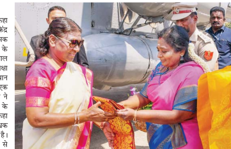
राष्ट्रपति द्रौपदी मुर्मू का स्वागत करती पुडुचेरी की उपराज्यपाल तमिलिसाई सौंदर्यराजन

इससे पहले, जेआईपीएमईआर में केंसर रोगियों के इलाज के लिए 17 करोड़ रुपए के अत्याधुनिक उपकरण का उद्घाटन करने के बाद राष्ट्रपति ने कहा