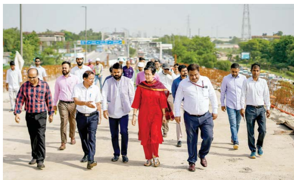
सराय काले खां फ्लाईओवर निर्माण का जायजा लेती लोक निर्माण मंत्री आतिशी।

लोक निर्माण मंत्री आतिशी ने सोमवार को सराय काले खां टी-जंक्शन पर बन रहे फ्लाईओवर का निरीक्षण किया। यहाँ निर्माण कार्य में एक महीने की देरी पर उन्होंने अधिकारियों को फटकार लगाई और चेतावनी देते हुए कहा कि बचा हुआ काम 1 महीने में पूरा किया जाए वरना