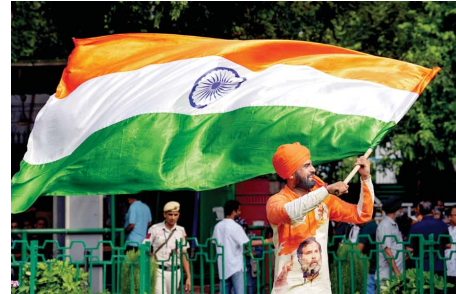
नई दिल्ली में राहुल गांधी की संसद सदस्यता बहाल होने की खुशी में कांग्रेस मुख्यालय पर तिरंगा लहराना पार्टी कार्यकर्ता।

मरीजों को पास के सफ्टरजंग अस्पताल में स्थानांतरित किया गया है। सूत्रों के मुताबिक, घटना के समय दूसरी मंजिल पर हड्डी विभाग का ऑपरेशन थिएटर चालू था और वहां से भी मरीजों को निकालना पड़ा। आग एंडोस्कोपी कक्ष के भंडारण क्षेत्र में लगी, लेकिन इसके कारण का अभी तक पता नहीं चल पाया है। उन्होंने बताया कि घटना के हताहत होने की सूचना नहीं है। नुकसान के आकलन के लिए एक सुरक्षा ऑडिट किया जाएगा।