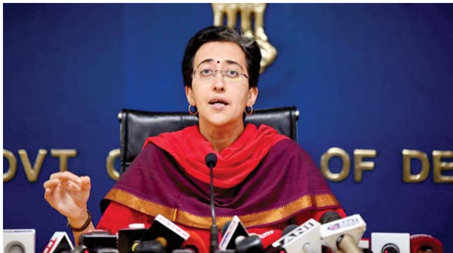
राजस्व मंत्री आतिशी सोमवार को एक प्रेसवार्ता में कृषि भूमि के सर्किल रेट में बढ़ोतरी की जानकारी देते हुए।

राजस्व मंत्री आतिशी ने कृषि भूमि और यमुना बांध से सटी कृषि भूमि के सर्किल रेट बढ़ाने का प्रस्ताव सीएम के समक्ष रखा था, जिसे उन्होंने स्वीकृति दे दी। आतिशी ने सोमवार को कहा कि जिलेवार तय सर्किल दरों में बढ़ोतरी की अधिसूचना उपराज्यपाल वीके सक्सेना की मंजूरी