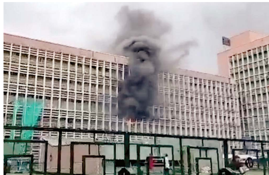
एमएस की पुरानी ओपीडी की दूसरी मंजिल पर एंडोस्कोपी कक्ष में आग लगने के बाद निकलता धुंआ।

एमएस के अधिकारियों ने बताया कि एमएस की मुख्य इमारत में पुरानी राजकुमारी अमृत कौर ओपीडी की दूसरी मंजिल पर सुबह करीब 11 बजकर 55 मिनट पर आग लग गई। उन्होंने यह भी बताया कि घटनास्थल