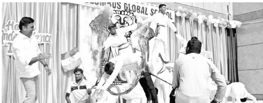
छात्राओं की अद्भुत प्रस्तुति को देखकर पूरा वातावरण देशभक्ति की भावना से सराबोर हो गया। इस अवसर पर मुख्य अतिथि ने छात्र-छात्राओं को संबोधित करते हुए कहा कि अध्ययन के साथ-साथ

का संदेश दिया। इस अवसर पर छात्र-छात्राओं ने अपनी कविताओं, भाषण, संगीत व नृत्य की रंगारंग प्रस्तुतियों के माध्यम से सभी को भाव विभोर कर दिया। देशभक्ति की भावना से ओत-प्रोत मेरा रंगदे बसंती चोला गाने से कार्यक्रम में प्रस्तुतियों का प्रारंभ हुआ। बच्चों ने देश के प्रति कर्तव्य को पुकारते हुए देशभक्ति के रंग में सराबोर तरी मिट्टी में मिल जावां पर नृत्य के माध्यम से अपनी प्रतिभाओं को दिखाकर सभी को मंत्रमुग्ध कर दिया। कंधों से मिलते हैं कंधे गाने