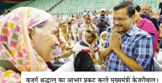
बुजुर्ग श्रद्धालु का आधार प्रकट करते मुख्यमंत्री केजरीवाल।

मुख्यमंत्री अरविंद केजरीवाल ने बताया कि योजना के तहत दिल्ली से अब तक 72 ट्रेन से 71 हजार लोग तीर्थ यात्रा कर चुके हैं। वह चाहते हैं कि दिल्ली का हर बुजुर्ग व्यक्ति तीर्थ