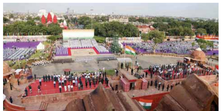
नई दिल्ली में रविवार को लाल किले पर स्वतंत्रता दिवस समारोह का पूर्वगियास किया गया

प्रधानमंत्री नरेन्द्र मोदी 15 अगस्त को दिल्ली के ऐतिहासिक स्मारक लाल किले की प्राचीर से 77वें स्वतंत्रता दिवस समारोह में देश को संबोधित करेंगे। इस अवसर पर विभिन्न क्षेत्रों से जुड़े 1800 से अधिक लोगों को विशेष अतिथि के रूप में आमंत्रित किया गया है। इस अवसर पर 75 जोड़े प्रत्येक राज्य और केंद्र शासित प्रदेश का प्रतिनिधित्व करते हुए पारंपरिक पोशाक में शामिल होकर इस विशिष्ट