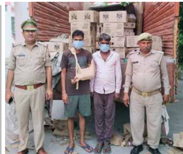
थाना नॉलेज पार्क पुलिस व आबकारी टीम ने कैटर ट्रक में भरकर अवैध शराब को तस्करी करने वाले दो अभियुक्त गिरफ्तार किए, इनके कब्जे से 270 पेट्री बरामद।

नोएडा। रविवार की दोपहर हिन्दन नदी से एक व्यक्ति का शव मिलने से हड़कंप मच गया। आनन फानन में थाना सेक्टर 142 पुलिस मौके पर पहुंची और शव को कब्जे में लेकर पोस्टमार्टम के लिए भिजवाया। रविवार की दोपहर थाना सेक्टर 142 पुलिस को किसी ने सूचना दी कि थाना क्षेत्र में हिंडन नदी में एक अज्ञात शव पड़ा है। नदी से शव मिलने पर पुलिस बल द्वारा मौके पर पहुंचकर देखा गया कि हिंडन में एक धरनाशिर पर 40 से 80 फीसदी 60 वर्ग मीटर तक के पलैट और 20 से 40 फीसदी 60 वर्ग मीटर से अधिक की राहत मिल जाएगी।