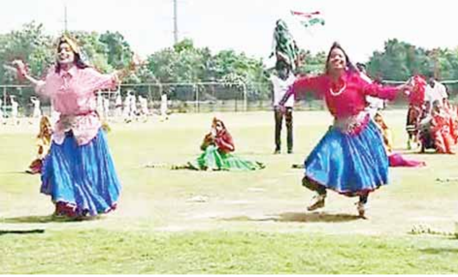
स्वतंत्रता दिवस समारोह के लिए फुल ड्रेस रिहर्सल करती छात्राएं।