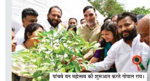
पांचवे वन महोत्सव की शुरुआत करते गोपाल राय

पांचवे वन महोत्सव का शुभारंभ नई दिल्ली। पर्यावरण एवं वन मंत्री गोपाल राय ने रविवार को उत्सव ग्राउंड, पटपटगांव से पांचवे वन महोत्सव की शुरुआत की गई। कार्यक्रम के दौरान वन एवं हरित क्षेत्र में प्रति रूचि रखने वाले सभी लोगों को प्रशिक्षित करने के लिए ट्रेनिंग पोर्टल जारी किया गया। राय ने बताया कि इस पोर्टल का मुख्य उद्देश्य वन एवं वन्य जीव विभाग की कार्यप्रणाली के बारे में जागरूक करना और हरित क्षेत्र की सुरक्षा को बढ़ावा देना है। पोर्टल के द्वारा वन एवं वन्यजीव विभाग के विभिन्न योजनाओं और कार्यों के बारे में प्रशिक्षण दिया जाएगा। केजरीवाल सरकार द्वारा इस साल लगभग 52 लाख से ज्यादा पौधे लगाने का लक्ष्य तय किया गया है। इसके अलावा 50 लाख पौधे एनडीएमसी द्वारा लगाए जाएंगे। कार्यक्रम में मौजूद सभी लोगों को विभाग द्वारा मुफ्त औषधीय पौधे भी बांटे गए।