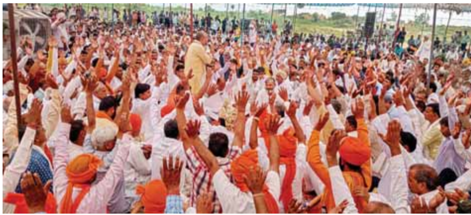
हरियाणा के पलवल जिले के पोडरी गांव में आयोजित हिन्दू विचारत में भाग लेते लोग

नूंह में विश्व हिंदू परिषद की बृजमंडल यात्रा 28 अगस्त को दोबारा निकाली जाएगी। यह फैसला रविवार को नूंह हिंसा के खिलाफ पलवल में हुई हिंदू संगठनों की महापंचायत में लिया गया। इस बैठक में हरियाणा की सैकड़ों खांपों, धार्मिक नेताओं और हिंदू संगठनों के प्रतिनिधि शामिल हुए। महापंचायत में नूंह हिंसा की जांच एनआईए से कराने, हिंदू परिवारों को हथियार लाइसेंस देने