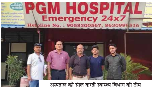
अस्पताल को सील करती स्वास्थ्य विभाग की टीम

10 अगस्त को महिला ने एक बच्चे को जन्म दिया। बच्चे को जन्म देने के बाद महिला की हालात बिगड़ गई। 11 अगस्त की रात को महिला की हालात अचानक बिगड़ गई। अस्पताल प्रबंधन ने महिला को रेफर