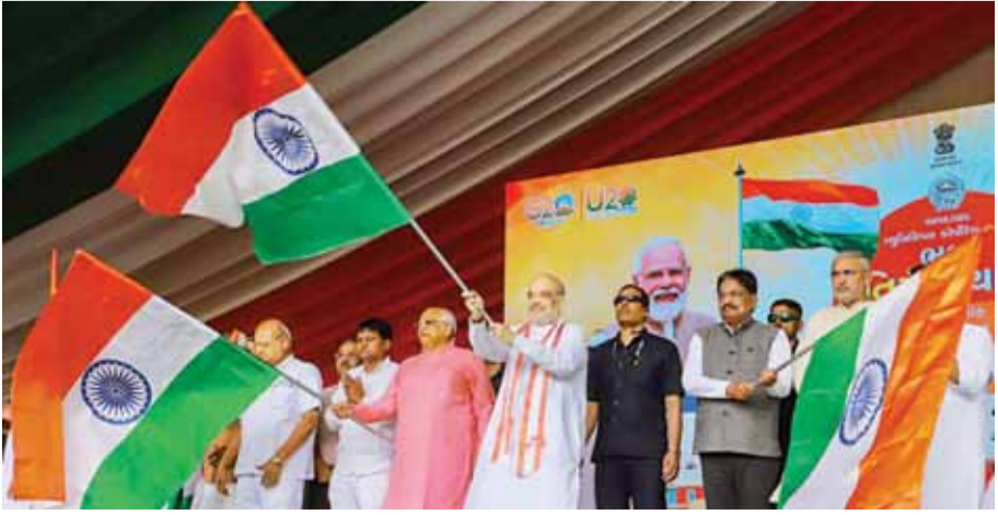
गुजरात में विरिंगा यात्रा की शुरुआत करते गृहनमंत्री अमित शाह व सीएम मोदी।