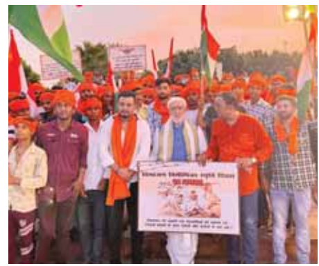
राजधानी में विभाजन विभीषिका स्मृति दिवस पर आयोजित मौन जुलूस में शामिल हुए केंद्रीय मंत्री अश्विनी चौबे।

नई दिल्ली। केंद्रीय मंत्री अश्विनी कुमार चौबे ने दिल्ली में विभाजन विभीषिका स्मृति दिवस के मौके पर आयोजित स्मृति सभा एवं मौन जुलूस में सम्मिलित हुए। उन्होंने कहा कि देश के बंटवारे के दर्द को कभी भुलाया नहीं जा सकता। विभाजन की विभीषिका में अपने प्राण गंवाने वाले एवं विस्थापन का दर्द झेलने वाले लाखों भारतवासियों को शत-शत नमन है। वहीं केंद्रीय मंत्री अश्विनी कुमार चौबे ने हर घर तिरंगा अभियान के तहत अपने दिल्ली स्थित सरकारी निवास एपीजे अब्दुल कलाम रोड कोठी संख्या 30 पर तिरंगा झंडा लगाया।