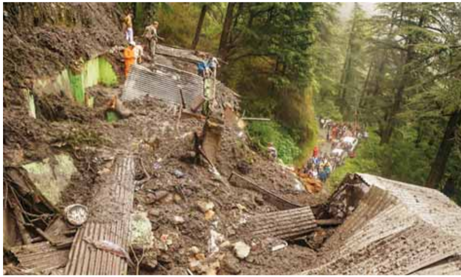
शिमला में भूस्खलन के कारण ध्वस्त मकानों में दबे लोगों को तलाशते राहत और बचावकर्मी