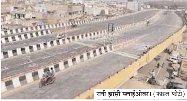
रानी झांसी फ्लाईओवर।