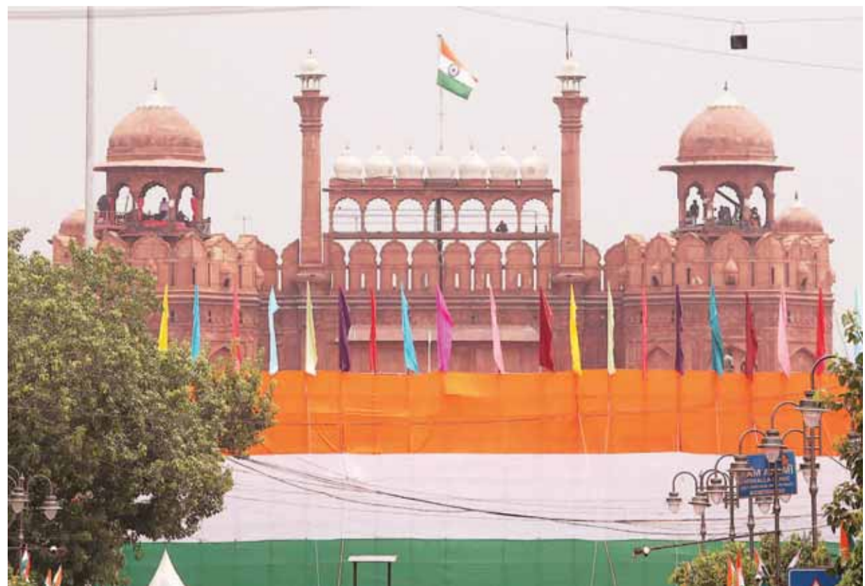
नई दिल्ली में सोमवार को स्वतंत्रता दिवस की पूर्व संध्या पर तिरंगे से सजा लाल किला।