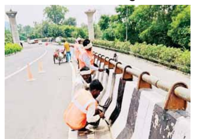
सम्मेलन स्थल से जुड़ी सड़कों के डिवाइडर सजाते और चमकते श्रमिक।

राष्ट्रीय राजधानी में सितंबर में होने वाले जी-20 शिखर सम्मेलन से संबंधित तैयारियों को हाल ही में बारिश और बाढ़ के कारण भारी नुकसान हुआ है। आयोजन का समय पास आने के साथ तैयारियों को समय से पूरा करने के लिए घड़ी की सुई की रफ्तार से काम किया जा रहा है। इस काम को अंतिम रूप देने में पूरा एक अमला जुटा हुआ है। उपराज्यपाल विनय कुमार सक्सेना ने तैयारियों से संबंधित कार्यों को पूरी रफ्तार देने के लिए दो महिला