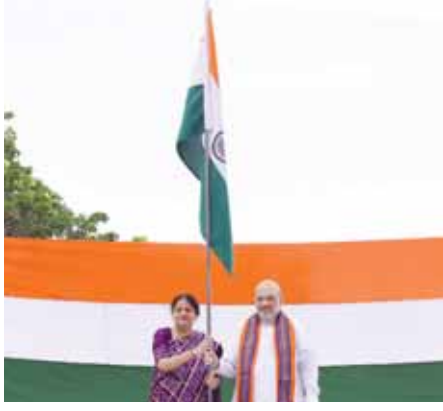
केंद्रीय गृहमंत्री अमित शाह ने हर घर तिरंगा अभियान के अंतर्गत अपने आवास पर राष्ट्रीय ध्वज फहराया।

शाह ने सोशल नेटवर्किंग साइट एक्स (पूर्व में ट्विटर) पर लिखा, हर घर तिरंगा अभियान के तहत अपने आवास पर मैंने आज तिरंगा फहराया। स्वतंत्रता दिवस से पहले भारतीय आसमान में लाखों तिरंगे भारत को फिर से महानता का प्रतीक बनाने के लिए राष्ट्र की सामूहिक इच्छा शक्ति को दर्शाते हैं। सरकार आजादी का अमृत महोत्सव के तत्वावधान में हर घर तिरंगा अभियान चला रही है। शाह ने सभी नागरिकों से अपने घरों पर राष्ट्रीय ध्वज फहराएं और अपनी सेल्फी हर घर तिरंगा डॉट कॉम पर अपलोड करें। उन्होंने सभी से अपने साथी नागरिकों को भी इसके लिए प्रेरित करने का अनुरोध किया।