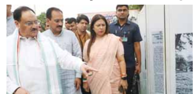
विभाजन विभीषिका स्मृति दिवस सेमिनार में भाजपा अध्यक्ष जेपी नड्डा व अन्य।