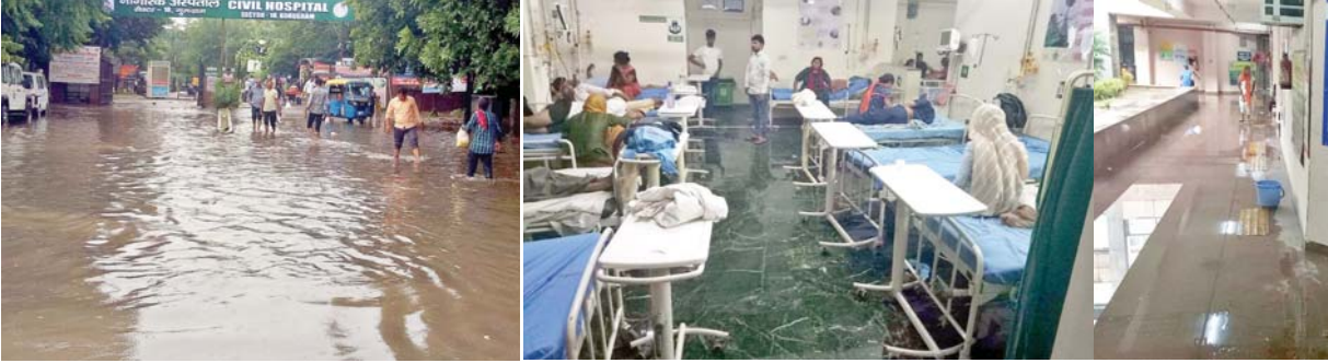
गुरुग्राम के सेक्टर-10 स्थित नागरिक अस्पताल के मेन गेट के सामने भरा बरसाती पानी। अस्पताल के सर्जिकल वार्ड व ओपीडी में भरा बरसाती पानी।