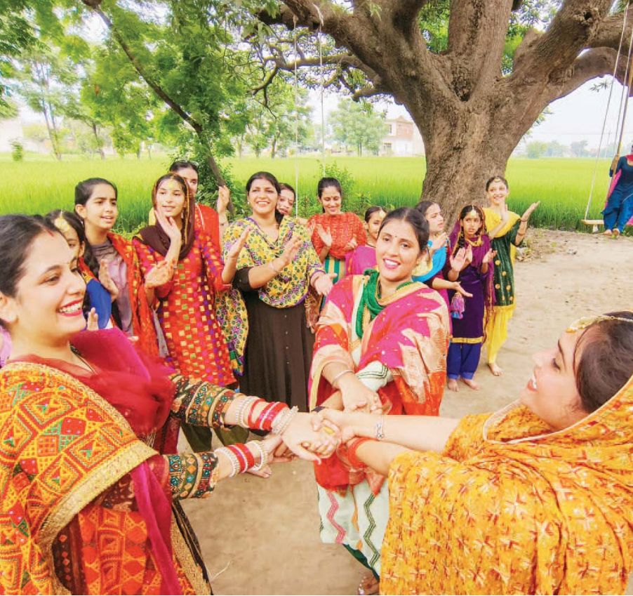
हरितालिका तीज पर नृत्य का आनंद लेती महिलाएं

ग्वालियर, छिदवाड़ा। मध्य प्रदेश के ग्वालियर एवं छिदवाड़ा जिले से गुजरने वाली दो ट्रेनों में शनिवार को आग लग गई। इन घटनाओं में किसी के हताहत होने की खबर नहीं है। एक अधिकारी ने बताया कि ग्वालियर जिले के सिधौली स्टेशन के पास उदयपुर-खजुराहो इंटरसिटी एक्सप्रेस ट्रेन के इंजन में आग लग गई।दर-मध्य रेलवे के जनसंपर्क अधिकारी मनोज कुमार सिंह ने कहा कि इंटरसिटी ट्रेन के लोको पायलट ने इंजन के मशीन रूम से धुआं निकलते देखा और ट्रेन को सिधौली स्टेशन के पास रोक दिया।उन्होंने बताया कि उन्होंने अग्निशमन विभाग और वरिष्ठ अधिकारियों को सूचित किया जिसके बाद आग पर कब्ू पा लिया गया गया। अधिकारी ने बताया कि इंजन बदलने के बाद ट्रेन खजुराहो के लिए रवाना हुई जिसने करीब तीन घंटे लगा। इसी तरह की घटना ने छिदवाड़ा जिले में पाहुना रेलवे स्टेशन के स्टेशन माल्टर गहेद सिंह ट्रेनम ने बताया कि एक यात्री ने नई दिल्ली से हैदराबाद जा रही तेलंगाना एक्सप्रेस की पेट्रीकार से धुआं निकलते देखा।