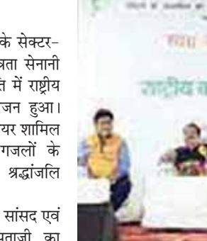
नोएडा में आयोजित राष्ट्रीय कवि सम्मेलन व मुशायरे में कविता पाठ करते कवि।