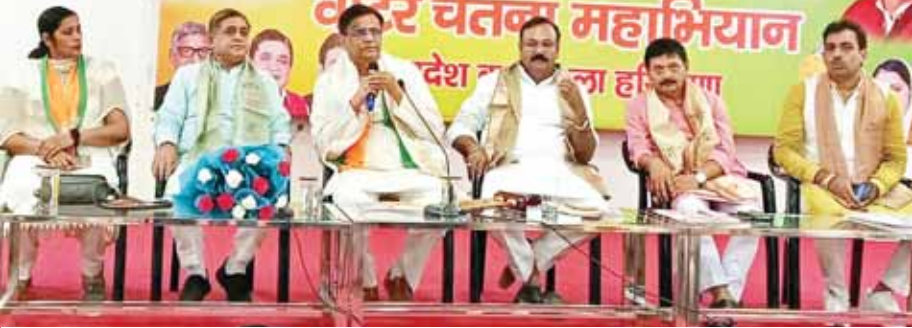
गुरुग्राम भाजपा कार्यालय में वोटर चेतना महाअभियान को लेकर कार्यशाला में बोलते प्रदेश अध्यक्ष ओमप्रकाश धनखड़ व मंचासीन अन्य वरिष्ठ पदाधिकारी।