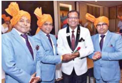
लायंस क्लब की शाखा लायंस क्लब गुड़गांव सिटी के 42वें स्थापना दिवस कार्यक्रम में शिरकत करते पदाधिकारी।