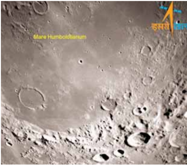
चंद्रयान-3 के लैंडर द्वारा भेजा गया चंद्रमा के सुदूर पार्व भाग का चित्र

चंद्रयान-2 आर्बिट्र के साथ चंद्रयान-3 के लैंडर में इंडियन डीप स्पेस नेटवर्क (आईडीएसएन), बड़े