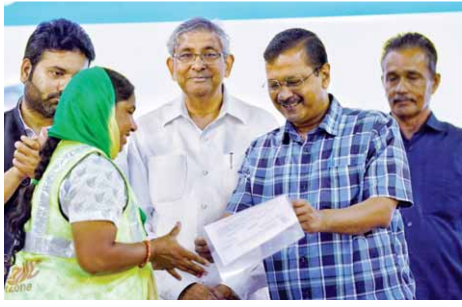
त्यागराज स्टेडियम में सोमवार को दिल्ली नगर निगम की महिला कर्मचारी को नियमित होने का नियुक्ति पत्र देते मुख्यमंत्री अरविंद केजरीवाल। इस अवसर पर एमसीडी कर्मियों ने कुछ इस तरह से आभार जताया।

● 13 साल बाद निगम कर्मचारियों को पहली तारीख को मिलाने लगा वेतन, सभी कर्मचारी बेहद खुश