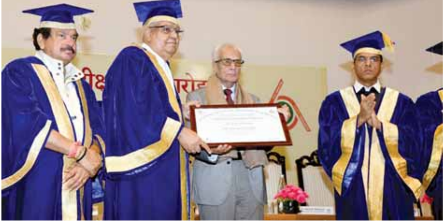
एम्स में आयोजित दीक्षांत समारोह में उपराष्ट्रपति जगदीप धनखड़ और केंद्रीय स्वास्थ्य मंत्री मनसूख मंडाविया।

शिथिलता, तनिक व्यावसायिकरण, तनिक नैतिक विचलन उन लोगों के लिए खराब साबित हो सकता है जिनकी वे सेवा करना चाहते हैं। इस अवसर पर केंद्रीय स्वास्थ्य मंत्री मनसूख मंडाविया और स्वास्थ्य राज्य मंत्री एसपी सिंह बघेल भी मौजूद थे। उपराष्ट्रपति ने कहा कि दीक्षांत समारोह तीन साल के अंतराल के बाद