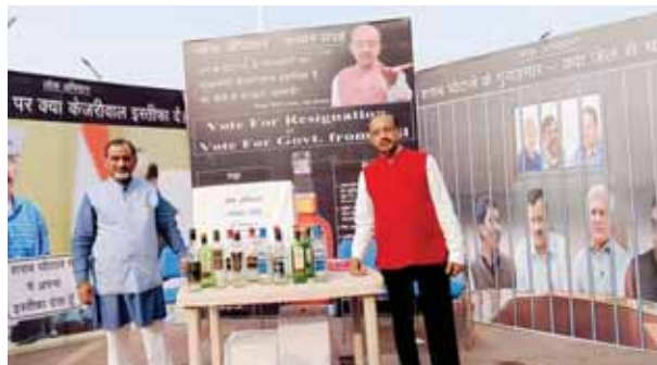
आप अभियान के विरोध में भाजपा के जनमत संग्रह वृथ पर विजय गोयल।

आम आदमी पार्टी ने में भी केजरीवाल हस्ताक्षर अभियान की शुरुआत की है। वही भाजपा ने भी विरोध में जनमत संग्रह करा रही है। भाजपा के पूर्व केंद्रीय मंत्री विजय गोयल ने शनिवार को लोक अभियान के कार्यक्रमों के साथ राजीव चौक मेट्रो स्टेशन गेट नंबर 6 पर शराब घोटाले में केजरीवाल की गिरफ्तारी पर जनमत संग्रह करवाया। इस जनमत संग्रह में लोगों से पूछा गया कि शराब घोटाले में यदि केजरीवाल को गिरफ्तार किया जाता है तो उनको इस्तीफा देना चाहिए या नहीं। गोयल ने बताया कि 83 फीसदी लोगों ने कहा कि केजरीवाल को इस्तीफा दे देना चाहिए जबकि 17 प्रतिशत ने कहा इस्तीफा नहीं देना चाहिए। पूर्व केंद्रीय मंत्री ने बताया यह मतदान जनता का, जनता के सामने गुप्त मतदान था, जबकि आम