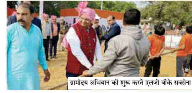
ग्रामोदय अभियान की शुरु करते एलजी वीके सक्सेना।

उपराज्यपाल विनय कुमार सक्सेना ने राजधानी में डीडीए की दिल्ली ग्रामोदय अभियान शुरु किया