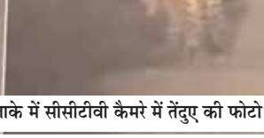
सैनिक फार्म इलाके में सीसीटीवी कैमरे में तेंदुआ को फोटो।

● वन अधिकारियों ने तेंदुआ को पकड़ने के लिए लगाए दो पिंजरे, दो दल किए गए तैनात