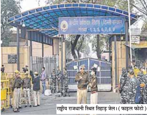
राष्ट्रीय राजधानी स्थित तिहाड़ जेल। (फाइल फोटो)

● जेल के और कर्मचारियों पर कार्टवाई का विचार कर रहा प्रशासन, पूरे नेटवर्क के बारे में कर्मचारियों से भी ले रहा है जानकारी