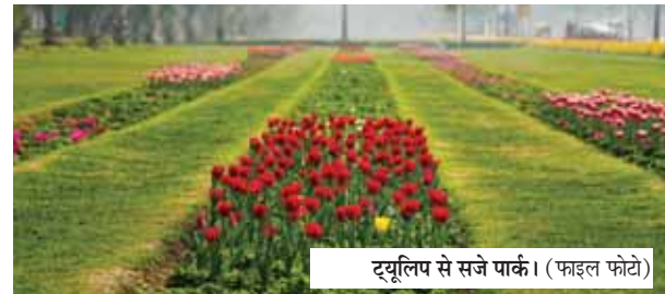
ट्यूलिप से सजे पार्क। (फाइल फोटो)