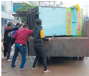
कोलनी मुख्य मार्ग, कोटा रोड में निगम के द्वारा बड़ी कार्रवाई करते हुए अशुभ कब्जों को हट्टया गया है। साथ ही शहर के भारत माता चौक से भी सभी अशुभ अतिक्रमण को हट्टाने की कार्यवाही की गई।