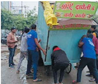
टीम के द्वारा चेतावनी के साथ हट्टया जा रहा है। तीसरे दिन इस कार्यवाही के तहत संजय नगर रोड में निगम का बुलडोजर चला। वहाँ जून-6 में टिकरापारा रोड, हरदेव लाला मॉडर के पास, जून-7 के अंतगत समतल

भाजपा की विजय के बाद तेजी से कार्यवाही का राही है। इसके तहत शहर के बीच स्थित शायद दुकानों के पास बने चखना दुकानों पर भी बुलडोजर चलाना जमींदोज किया जा रहा है। ट्रैफिक बाधित करने वाले अशुभ कब्जों को नगर निगम का