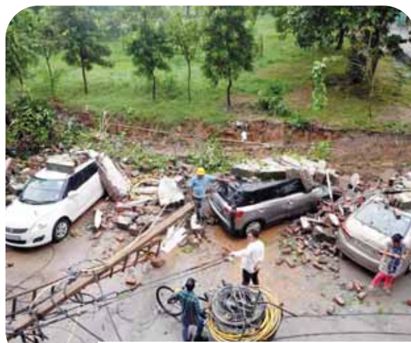
बारिश के कारण गिरी देशबंधू कॉलेज की चारदीवारी।

जहां से गड़कों से संबंधित कॉल प्राप्त हुई। एमसीडी के अधिकार क्षेत्र में आने वाले दो इलाकों में भी पेड़ गिरने की घटनाएं सामने आईं। एमसीडी अधिकारियों के मुताबिक, कालकाजी में हरिजन कॉलोनी, जंगपुरा एक्सटेंशन, पहाड़ाजंज में नबी करीम और शाहदरा के गौतम पुरी इलाके में जलजमाव की सूचना मिली है। एनडीएमसी ने जलभराव और पेड़