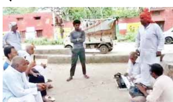
गुरुग्राम जिला में सूचना, लोकसम्पर्क, भाषा तथा संस्कृति विभाग द्वारा चलाए जा रहे विशेष प्रचार अभियान के दौरान ग्रामीणों को लोक शैली में सरकारी योजनाओं के बारे में जानकारी देते भजन मंडली।

भजन मंडली ने सोहना खण्ड में चलाया विशेष प्रचार अभियान