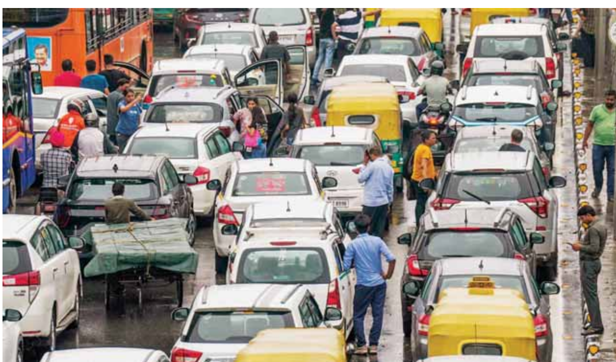
दिल्ली-हरियाणा समेत उत्तर भारत के ज्यादातर हिस्सों में शनिवार को भारी बारिश हुई। इन क्षेत्रों में सुबह साढ़े 8 बजे से दोपहर ढाई बजे तक 5 से 9 सेंटीमीटर वर्षा दर्ज की गई, जो इस सीजन की सबसे अधिक है। राजधानी दिल्ली सुबह से रात तक जलभराव और जाम से बेहाल रही। मौसम विभाग ने रविवार को भी मध्यम स्तर की बारिश का ठेका अलर्ट जारी किया है।