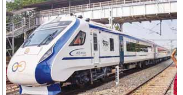
पायनियर समाचार सेवा। नई दिल्ली

रेलवे बोर्ड ने एक आदेश में कहा है कि वंदे भारत और अनुभूति तथा विस्टाडोम बोगियों वाली सभी ट्रेन में एसी चेर कर (सीसी) और एरजीक्यूटिव श्रेणी (ईसी) के किराए में यात्रियों की संख्या के आधार पर 25 फीसदी तक की कटौती की जाएगी। आदेश के मुताबिक, किराए में रियायत परिवहन के प्रतिस्पर्धी माध्यमों के किराए पर भी निर्भर करेगी।