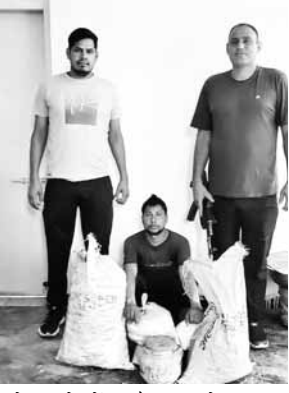
बने कमरे में अवैध पटाखे बनाकर उन्हें पैक करने का काम किया जाता है। आरोपी को अवैध पटाखों व उन्हें