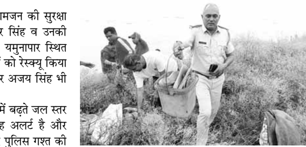
सुरक्षित स्थानों तक पहुंचाया है। उन्होंने बताया कि मजदूर लोग अमीपुर के जमींदारों की जमीन पर खेती करते हैं और वहाँ पर अपने परिवार के साथ रहते हैं। पुलिस द्वारा रेस्क्यू ऑपरेशन में वहां रह रहे लोगों को सेफ्टी जैकेट पहनाकर नाव की सहायता से यमुना के इस पार लाकर सुरक्षित स्थान पर छोड़ा गया है। उनके खाना खाने के लिए भी उचित प्रबंध किया गया है।

पुलिस प्रवक्ता ने बताया कि यमुना में बढ़ते जल स्तर को देखते हुए पुलिस प्रशासन पूरी तरह अलर्ट है और यमुना के आसपास के एरिया में लगातार पुलिस गश्त की जा रही है, ताकि समय पर हालातों का जायजा लिया जा सके। यमुना का जलस्तर बढ़ने के कारण इसके आसपास के गांव में बाढ़ का संकट और वहां पर रह रहे लोगों की जान को खतरा पैदा हो सकता है। नागरिकों की सुरक्षा को ध्यान में रखते हुए रात तिगांव पुलिस तथा एनडीआरएफ की टीम ने रात 12 बजे से सुबह तक रेस्क्यू ऑपरेशन चलाकर अमीपुर गांव के खेतों में रह रहे 90 लोगों को