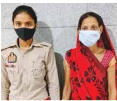
पुलिस गिरफ्त में आरोपी महिला।