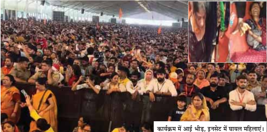
कार्यक्रम में आई भीड़, इनसेट में घायल महिलाएं।

इसी दौरान एक महिला करंट की चपेट में भी आई। बताया जा रहा है कि वीआईपी पास से पीछे छोटे से गेट से एंटी करवाई जा रही थी, वहां पर बिजली के तार होने की वजह से एक महिला को करंट लगा है। बताया जा रहा है कि भगदड़ मचने की वजह से बच्चे, बुजुर्ग और महिलाएं ज्यादातर घायल हुई हैं।