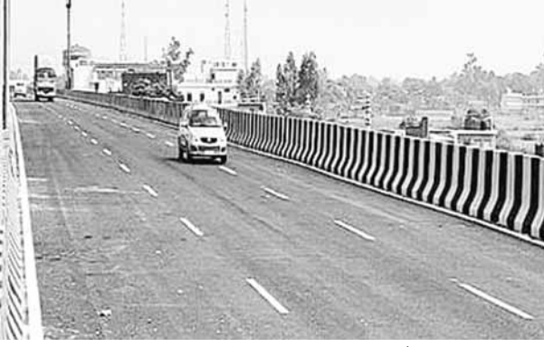
पुल बनाया जाएगा। इसका निर्माण सिंचाई विभाग की ओर से किया जाएगा, जबकि पैसे का भुगतान एनएचएआई करेगा।

दिल्ली-मुंबई एक्सप्रेस वे प्रोजेक्ट में मीठापुर के पास जमीन अधिग्रहण की प्रक्रिया पूरी होने के बाद निर्माण कार्य में रफ्तार आने की उम्मीद है। इसके साथ ही गुरुग्राम नहर पर बने खस्ताहाल पुल की जगह तीन लेन का नया