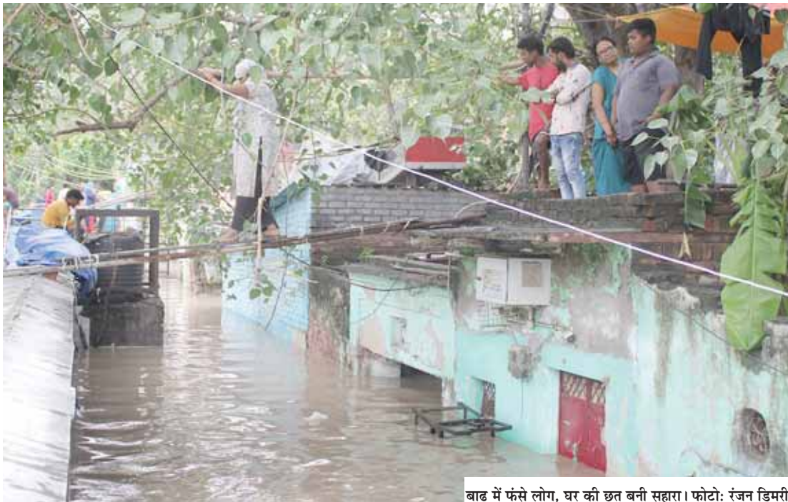
बाढ़ में फंसे लोग, घर की छत बनी सहारा।

एक और ट्वीट में यातायात पुलिस ने कहा, जलभराव के चलते रोहतक रोड पर राजधानी पार्क से मुंडका तक जाम है। इस