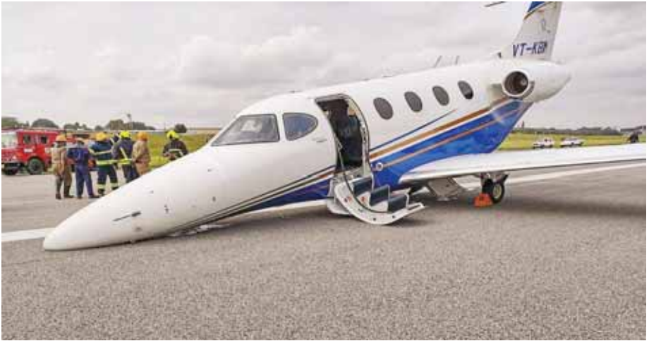
बेंगलुरु के हिंदुस्तान एयरोनॉटिव्स लिमिटेड (एएएल) हवाई अड्डे पर एक मिगी विमान को अपने नोज लैंडिंग गियर में तकनीकी खराबी के कारण आपातकालीन लैंडिंग करनी पड़ी।

जून में खुदरा मुद्रास्फीति की दर बढ़ने के बावजूद यह भारतीय रिजर्व बैंक के छह प्रतिशत के संतोषजनक स्तर के नीचे है। सरकार ने रिजर्व बैंक को खुदरा मुद्रास्फीति को दो प्रतिशत घट-बढ़ के साथ चार प्रतिशत तक सीमित रखने का दायित्व सौंपा हुआ है। रिजर्व बैंक खुदरा मुद्रास्फीति के आंकड़े को ध्यान में रखते हुए द्विमासिक मौद्रिक समीक्षा करता है। रिजर्व बैंक ने पिछले महीने की मौद्रिक समीक्षा में नीतिगत दर रेपो को 6.5 प्रतिशत पर कायम रखा था।