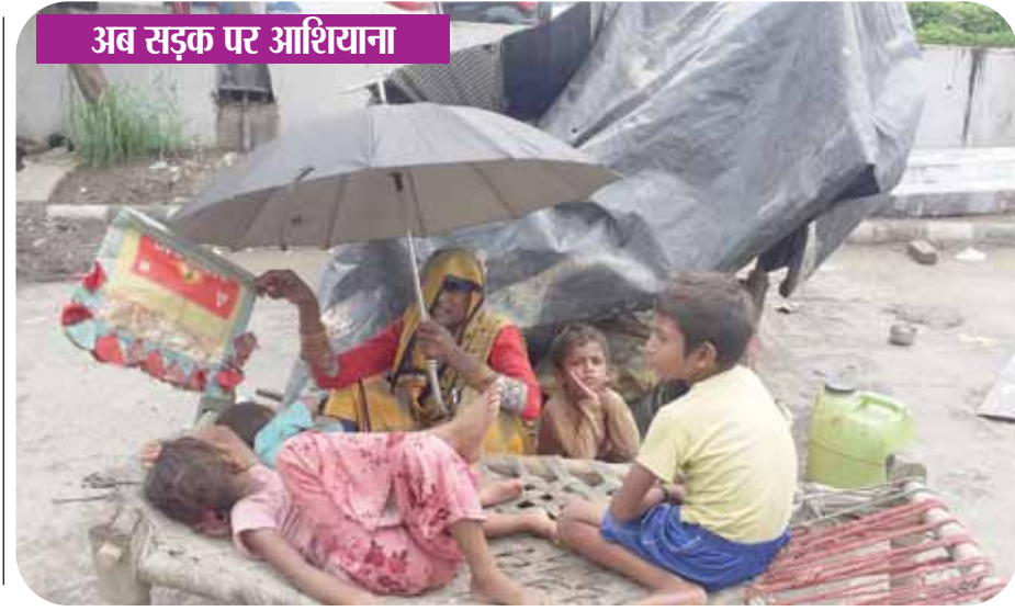
अब सड़क पर आशियाना

यमुना नदी का जलस्तर बुधवार को बढ़कर 207.83 मीटर पर पहुंच गया। एलजी उम्मीद जताए कि अगले कुछ दिनों में यमुना का जलस्तर कम हो जाएगा क्योंकि हरियाणा के हथिनीकुंड बैराज से पानी छोड़ा जाना कम हो गया है।