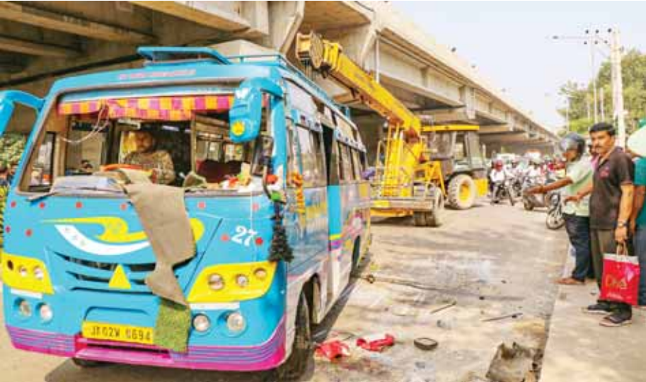
जम्मू में अखनूट रोड के पास एक दुर्घटना के बाद क्षतिग्रह गेटाडोर वैन।

मोदी 14 जुलाई को फ्रांस में बैस्टिल दिवस समारोह में विशिष्ट अतिथि होंगे। इसमें भारतीय सेना के तीनों अंगों की एक टुकड़ी भी हिस्सा ले रही है। इस यात्रा के दौरान फ्रांस