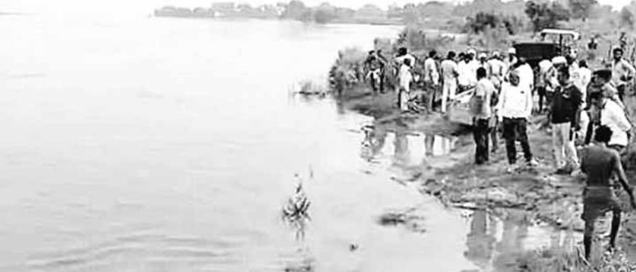
उन्हें निकाला नहीं जा सका। प्रशासन उन्हें निकालने के प्रयास में लगा है। बताया गया है कि गांव गुरुवाड़ी व प्रहलादपुर के बीच यमुना नदी के बीचों बीच करीब 35-40 एकड़ का टापू है। इस टापू पर गांव प्रहलादपुर

यमुना नदी में जलस्तर बढ़ने लगा है। सुबह यमुना में चारों तरफ पानी की पानी दिखाई देने लगे। ऐसे में गांव गुरुवाड़ी के समीप यमुना नदी के बीचों बीच टापू पर पशुओं के साथ रहने वाले करीब 10 लोग फंसे गए। टापू के दोनों तरफ पानी आने से वे निकल नहीं पाए। प्रशासन को सूचना मिलने पर भी देर शाम तक