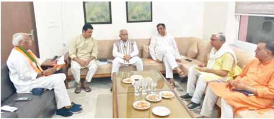
गुरुग्राम भाजपा कार्यालय में छोटी टोली की बैठक में खिलाड़ियों को सम्मानित करते मुख्यमंत्री मनोहर लाल, प्रदेश अध्यक्ष ओमप्रकाश धनखड़, प्रदेश प्रभारी बिप्लव देव।