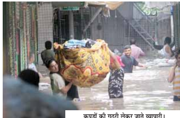
कपड़ों की गठरी लेकर जाते व्यापारी।

गाजियाबाद की ओर से आने वाले अन्य वाहनों को पुरता रोड की ओर मोड़ दिया जाएगा। साथ ही वजीरवादा पुल से मजनु का टीला की ओर आने वाले यातायात को मुकरबा की ओर मोड़ दिया जाएगा। बूलेवादी रोड से आईएसबीटी की ओर आने वाले यातायात को शमनाथ मार्ग और महात्मा गांधी मार्ग की ओर मोड़ दिया जाएगा। पुलिस ने यमुना के तटीय इलाकों में अलर्ट जारी किया हुआ है। इसे देखते हुए इन इलाकों में यात्रा करने से बचने की सलाह दी गई है।