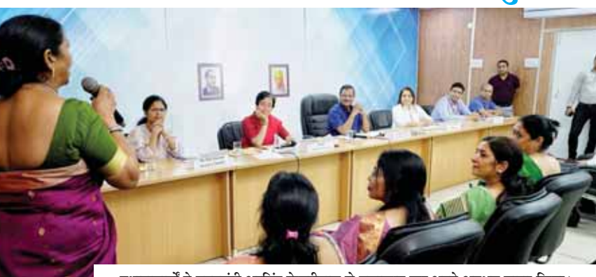
प्रधानाचार्यों ने मुख्यमंत्री अरविंद केजरीवाल से मुलाकात कर अपने अनुभव साझा किया।

इन प्रिंसिपलों को नेतृत्व क्षमता, बच्चों को अच्छी शिक्षा देने और माता-पिता को भागीदार बनाने समेत कई महत्वपूर्ण गुर सीखने का अवसर मिला। बुधवार को प्रधानाचार्यों ने मुख्यमंत्री अरविंद केजरीवाल से मुलाकात कर अपने अनुभव साझा किया। शिक्षा उनकी पहली प्राथमिकता है। इसी के मद्देनजर उनकी सरकार ने निगम स्कूलों के प्रिंसिपल को भी