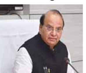
पायनियर समाचार सेवा। नई दिल्ली

उपराज्यपाल विनय कुमार सक्सेना ने यमुना के बढ़ते जलस्तर को लेकर बृहस्पतिवार को दिल्ली आपदा प्रबंधन प्राधिकरण (डीडीएमए) की बैठक बुलाई है। यह जानकारी राज