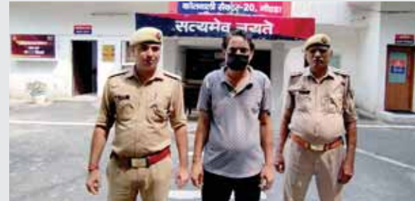
थाना सेक्टर-20 नोएडा पुलिस द्वारा गांजा तस्करी करने वाला एक तस्कर गिरफ्तार, कब्जे 1 किलो 200 ग्राम गांजा बरामद।