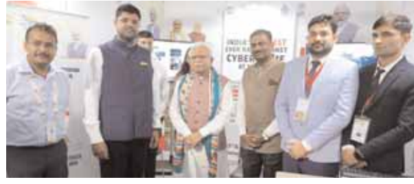
गुरुग्राम में जी-20 सम्मेलन में शिरकत करते मुख्यमंत्री मनोहर लाल।

इशिका सेनेटरी एंड हार्डवेयर उद्योग, श्री श्याम सहायता कोष व श्याम लाडली परिवार, विनटस ग्रुप, खंडेलवाल ग्रुप, वाइट लैंड डेवलपर्स की ओर से इस आयोजन में सहयोग दिया जा रहा है। माधव फाउंडेशन हजारों की संख्या में पधारें समस्त श्रद्धालु गणों का कलश यात्रा को सफल बनाने के लिए हार्दिक आभार प्रकट करता है।