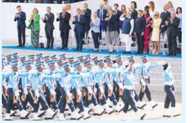
पेरिस में बैस्टिल डे के मौके पर मंच के सामने से गुजरता भारतीय दल।