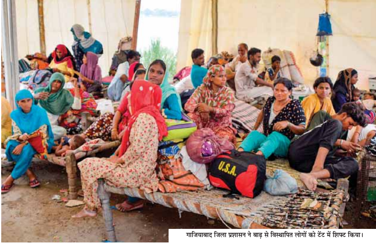
गाजियाबाद जिला प्रशासन ने बाढ़ से विस्थापित लोगों को टेंट में शिफ्ट किया।

ऐसे में समय रहते तटबंध अगर नहीं बना तो लोनी जलमग्न हो जाएगी। वहीं प्रशासनिक अधिकारी दावा कर रहे हैं कि स्थिति नियंत्रण में है। जबकि लोनी में लगातार पानी का जलस्तर बढ़ रहा है। पहले गांवों तक पानी था लेकिन अब ट्रोनिफा सिटी इंडस्ट्रियल एरिया से लेकर पुलिस चौकी तक पानी पहुंच गया है। कई फुट तक पानी पुलिस चौकी में भर गया है जिसकी वजह से पुलिस कर्मा चौकी में रखे दरतावेजों को अन्य स्थान पर ले जाते