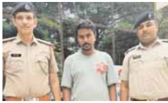
गुरुग्राम पुलिस द्वारा गिरफ्तार किया गया कंपनी को चूना लगाने का आरोपी पूर्व कर्मचारी।

स्थित चिकित्सा सुविधा प्रदान करने वाले अस्पतालों और बीमा कंपनियों के साथ काम करती है। बीमा कंपनियों के साथ बातचीत करके चिकित्सा बिलों का भुगतान वचुअल क्रेडिट कार्ड के माध्यम से करती है। किसी व्यक्ति ने इनकी कंपनी के सर्वर को एक्सेस करके कंपनी के साथ 778 डॉलर की धोखाधड़ी की अंजाम दिया। इस