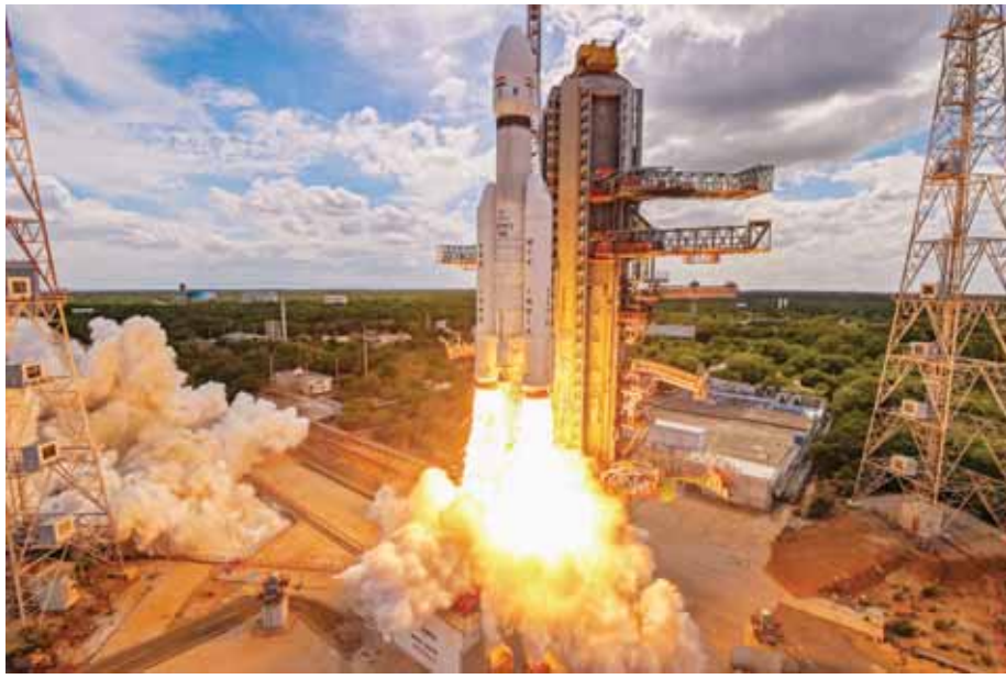
श्रीहरिकोटा स्थित सतीश धवन अंतरिक्ष केंद्र से एलवीएम3-एम4 रॉकेट के जरिए तीसरे चंद्र मिशन- चंद्रयान-3 का सफल प्रक्षेपण किया गया।

इसमें सफलता मिलते ही भारत ऐसी उपलब्धि हासिल कर चुके अमेरिका, पूर्व सोवियत संघ और चीन जैसे देशों के क्लब में शामिल हो जाएगा और यह इस तरह का कीर्तिमान स्थापित करने वाला विश्व का चौथा देश बन जाएगा। भारतीय अंतरिक्ष अनुसंधान संगठन (इसरो) ने कहा कि चंद्रयान-3 की सॉफ्ट लैंडिंग 23 अगस्त को शाम पांच बजकर 47 मिनट