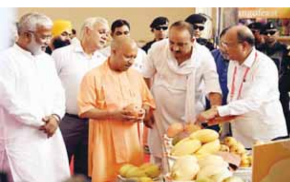
आम उत्पादन से जुड़े किसान हुए सम्मानित

मुख्यमंत्री योगी आदित्यनाथ ने कहा कि रूस में उत्तर प्रदेश के आमों की काफी मांग है। वहां पर 800 सी रुपये प्रति किलो आम बिक रहा है। यहां से कार्गो के माध्यम से आम भेजने में 190 रुपये का खर्च आता है। यानी कोई किसान अगर रूस में आम भेजेगा तो उसे 600 रुपये से ज्यादा का नेट प्रॉफिट होगा। हमें यहां के आमों को दुनिया के कोने-कोने में पहुंचाना है। यूरोप के बाजार उत्तर प्रदेश के आम का इंतजार कर रहे हैं। शॉर्टकट न अपनाएं अपनी गुणवत्ता पर ध्यान देते हुए मांग के