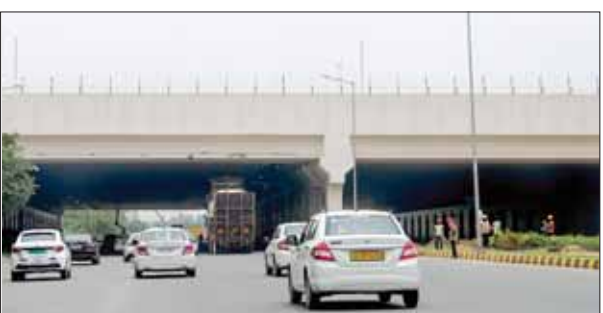
दिल्ली हवाईअड्डे पर निर्मित एलिबेडेड इस्टर्न क्रॉस टैक्सीवे।

इससे देश के सबसे बड़े हवाईअड्डे की क्षमता और परिचालन दक्षता बढ़ने की उम्मीद है। नागर विमानन मंत्री ज्योतिरादित्य सिंधिया ने यहां हवाईअड्डे पर आयोजित एक कार्यक्रम में इस्टर्न क्रॉस टैक्सीवे और नई हवाई पट्टी का उद्घाटन किया। इस मौके पर उन्होंने कहा कि देश का विमानन क्षेत्र इस समय वृद्धि का दौर का शुरूआत से गुजर रहा है। इंदिरा गांधी अंतर्राष्ट्रीय हवाई अड्डा