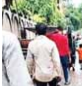
सोहना के बस स्टैंड मार्ग पर परिषद की दुकानों के सामने जमा नाले का गंदा पानी। परिषद के कर्मचारी दुकानों के साथ-साथ से जा रहा बर्बादी नाले पर अंधेय रूप से चकूते बनाकर कब्जा किया गया है। इन्होंने नती दुकानदारों को नुसरा पर टेली और मसबल की डना हो नहीं, दुकानदारों ने परिषद को नाले की सफाई के लिए प्रशासन को धरना प्रदर्शन की धमकी दे डाली है। बस स्टैंड मार्ग पर वनी नगर सड़क पर जमा होने से परेशान दुकानदार अब उन रूप लिये का आरोप प्रशासनिक कर्मचारियों के खिलाफ पर लगा रहे हैं। शुक्रवार को स्थानीय दुकानदारों ने जमा गिरे पानी के बीच में पेज प्रबल लगाकर चंद मिमट विरिध प्रदर्शन करना चाहा। लेकिन दुकानदारों का यह प्रदर्शन कामयाब नहीं हो सका।