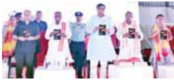
गुरुग्राम में अंतरराष्ट्रीय सांस्कृतिक केंद्र के शिलान्यास समारोह में मुख्य अतिथि बंडारू दत्तात्रेय। गुरुग्राम में अंतरराष्ट्रीय सांस्कृतिक केंद्र के शिलान्यास समारोह में मुख्य अतिथि बंडारू दत्तात्रेय।

राज्यपाल बंडारू दत्तात्रेय ने भारत अंतरराष्ट्रीय सांस्कृतिक केंद्र का किया शिलान्यास पायनियर समाचार सेवा। गुरुग्राम