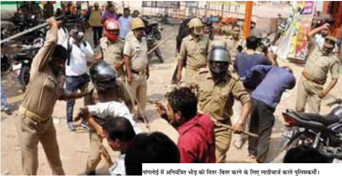
नांगलोई में अनिर्धारित भीड़ को तिर-बितर करने के लिए लाठीचार्ज करते पुलिसकर्मी

दोपहर के समय जैसे ही जुलूस चोक पर पहुंचा तो कुछ लोगों ने इसे सूरजमत स्टैंडियम की ओर ले जाने का प्रयास किया पुलिस ने चोक पर बैरिकेडिंग कर रखी थी। लोगों को आगे जाने से रोकते तो वे झगड़ कर पथराव करते हुए और कुछ लोगों में पथर फेंकना शुरू कर दिया।