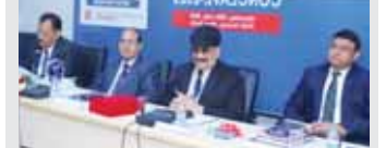
सर्टिफाइड कॉर्पोरेट इन्वेस्टिमेंट्स कार्यक्रम लॉन्च के मौके पर पदाधिकारियों