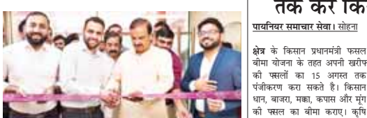
खुशी के मौके पर कहा, "हमें अपने नोएडा सेक्टर-18 शोरूम को फिर से लांच करने की खुशी है। हमें सपना में यह भरोसा है कि रीनोवेटेड शोरूम हमारे परामर्शदाताओं के लिए खरीदारी के अनुभव को और बेहतर बनाएगा और नए श्राकों को शोरूम में ज्वेलरी खरीदने के शानदार अनुभव का साथ देने के लिए आकर्षित करेगा। इस क्षेत्र में हमारी सेवा असाधारण रही है और हम अपने मूल्यवान ग्राहकों को सबसे अच्छी गुणवत्ता वाले आपूर्ण और सेवा प्रदान करने रहने के लिए उत्साहित हैं। फिर से लांच किए गए शोरूम में बड़ा इंटीरियर, बेहतर माहौल और कलेक्शन की एक बढ़ती रेंज है, जो ज्वेलरी की खरीदारी का अतुलनीय अनुभव प्रदान करने का भरोसा