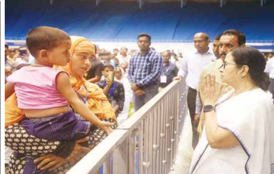
कोलकाता में पश्चिम बंगाल की मुख्यमंत्री तमना बनर्जी बालासोर ट्रेन दुर्घटना के पीड़ितों के परिहार के सदस्यों को वित्तीय सहायता और राज्य सरकार की नौकरियों के नियुक्ति पत्र देने के लिए आयोजित एक समारोह के दौरान

सहयोगियों का साथ छूटने के बाद राजग के घटक दलों में कमी आई है। वर्ष 2018 में राजग छोड़ने वाली तेलुगु देशम पार्टी (तेदेपा) के सुप्रीमो एन चंद्रबाबू नायडू नायडू और केन्द्रीय गृह मंत्री अमित शाह के बीच हुई हालिया बैठक ने उन चर्चाओं को एक बार फिर तेज कर दिया है कि दोनों दलों के बीच फिर से गठबंधन हो सकता है। सूत्रों का कहना है कि नायडू भी लंबे समय से इसके लिए प्रयासरत हैं। भाजपा के एक नेता ने कहा कि जल्द ही राजग का विस्तारित स्वरूप सामने आएगा जब इसकी एक बैठक होगी। हालांकि यह देखा जाना अभी बाकी है कि क्या बिना औपचारिक रूप से तैदेपा के साथ हाथ मिलती है।