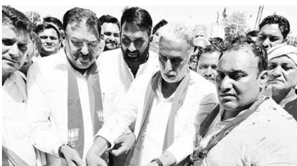
कार्यालय का उद्घाटन करते कृष्णपाल गुर्जर।

केंद्रीय राज्यमंत्री कृष्णपाल गुर्जर ने कहा कि देश के प्रधानमंत्री नरेंद्र मोदी के नेतृत्व में भाजपा सरकार का नौ सालों का कार्यकाल सेवा, सुशासन, गरीब कल्याण को समर्पित रहा है। मोदी सरकार ने अंत्योदय के मूल मंत्र को चरितार्थ कर जन कल्याण के लिए अनेक योजनाओं को लागू कर समाज के अंतिम व्यक्ति तक 100 फीसदी लाभ पहुंचाने का काम किया है और इन नौ सालों में भारत देश का पूरे