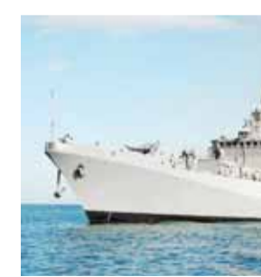
आईएनएस त्रिशूल की फाइनल फोटो। पीटरमैरिट्जबर्ग में पोत के बैंड ने महात्मा गांधी के कुछ पसंदीदा गान बजाए।

भारतीय नौसेना का अग्रिम पंक्ति का युद्धपोत आईएनएस त्रिशूल तीन दिवसीय सद्भावना यात्रा पर डरबन के बंदरगाह पहुंचा है। भारत और दक्षिण अफ्रीका के बीच राजनयिक संबंधों की बहाली के 30 साल पूरे होने और दक्षिण अफ्रीका के पीटरमैरिट्जबर्ग रेलवे स्टेशन पर महात्मा गांधी को ट्रेन से उतारे जाने