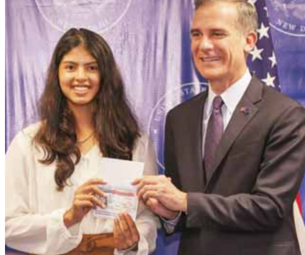
नई दिल्ली में बुधवार को भारत में अमेरिका के राजदूत एरिक गार्सेटी एक भारतीय छात्र के साथ जिसे अमेरिकी दूतावास में आयोजित सालाना छात्र वीजा दिवस कार्यक्रम के दौरान पासपोर्ट वीजा दिया गया।

भारत में अमेरिका के राजदूत एरिक गार्सेटी ने बुधवार को कहा कि 2022 में हर पांच अमेरिकी छात्र वीजा में से एक भारत में जारी किया गया जो विश्व में भारतीय जनसंख्या के अनुपात से अधिक है। अमेरिकी दूतावास ने बुधवार को देशभर में वार्षिक विद्यार्थी वीजा दिवस मनाया जिसके दौरान दिल्ली, चेन्नई, हैदराबाद, कोलकाता और मुंबई में वार्षिक दूतावासों में 3500 भारतीय विद्यार्थी वीजा आवेदकों का साक्षात्कार लिया गया। इस मौके पर गार्सेटी ने कहा, दुनिया के किसी भी अन्य देश की तुलना में अधिक भारतीय अमेरिका आते हैं। 2022 में हर पांच अमेरिकी छात्र वीजा में से एक यहां भारत में