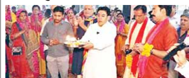
शक्ति पीठ मंदिर, सेक्टर-30, 31, 40, 41, जलवायु विहार एवं साउथ सिटी में हनुमान चालीसा का पाठ किया गया।