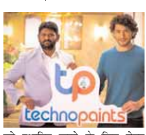
टेक्नो पेंट्स के रूप में प्रिंस महेश बाबू की छवि हमारी कंपनी को विस्तार करने में मदद करेगी।