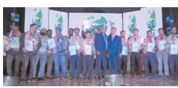
मिशन में 68 देशों के 1500 प्रतिनिधि शामिल, पृथ्वी को बचाने के प्रयासों को जन जन तक पहुंचाने की पहल

जलवायु परिवर्तन के साथ पृथ्वी पर बढ़ रहे खतरे से निपटने की आज जहां जरूरत है उसे ध्यान में रखते हुए विश्व पर्यावरण दिवस को केंद्र में रखते हुए सेव अर्थ मिशन ने विभिन्न जागरूकता कार्यक्रमों की श्रृंखला के साथ मिशन की शुरुआत की है।