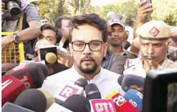
बैठक के बाद मीडिया से मुख्यातिव खेल मंत्री अनुराग ठाकुर।

खेलमंत्री अनुराग ठाकुर ने बुधवार को प्रदर्शनकारी पहलवानों से छह घंटे तक चली मुलाकात को सकारात्मक बताते हुए कहा कि बृजभूषण शरण सिंह के खिलाफ 15 जून तक आरोपपत्र दाखिल हो जाएगा और पहलवानों ने भी तब तक अपना प्रदर्शन स्थगित करने पर सहमत जताई है। एक नाबालिग समेत सात महिला पहलवानों के यौन उत्पीड़न के आरोपों का सामना कर रहे भारतीय कुश्ती महासंघ के निवर्तमान अध्यक्ष बृजभूषण की गिरफ्तारी की मांग को लेकर 23 अप्रैल से प्रदर्शन कर रहे पहलवानों को खेलमंत्री ठाकुर ने मुलाकात के लिए बुलाया था। इस बैठक में सरकार ने पहलवानों की अधिकार मांगों पर सहमत जताई है। बैठक के बाद ठाकुर ने पत्रकारों से कहा, अच्छे वातावरण में सकारात्मक बातचीत बहुत