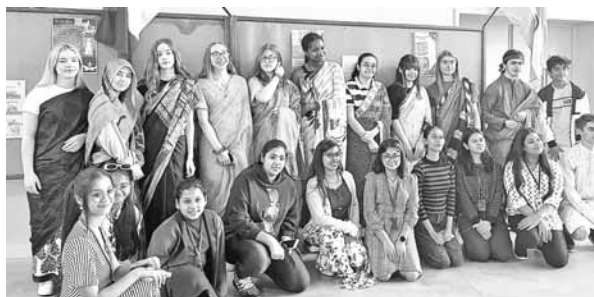
सुंदरता का अवलोकन किया। इसके साथ-साथ डीपीएस ग्रेटर फरीदाबाद के विद्यार्थियों को फ्रांसीसी छात्रों के साथ बातचीत करने और एक विदेशी देश की संस्कृति के बारे में समझने का भी मौका मिला। इस

फ्रांस दौरे पर गया। जहां फ्रांस के सेंट रेमी स्कूल व डीपीएस ग्रेटर फरीदाबाद के छात्र विनियम कार्यक्रम का आयोजन हुआ। इस भ्रमण के दौरान छात्रों ने एफिल टॉवर और लौवर संग्रहालय की