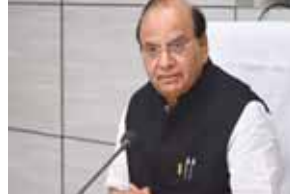
उपराज्यपाल ने चार नए गांवों को लिया गोद

वर्ष 2011 की जनसंख्या के मुताबिक निजामपुर की आबादी 6 से 7 हजार जबकि जौती की आबादी 8 से 9 हजार के बीच है। वहीं रावता की आबादी 2933 और देवराला की आबादी 524 है। इन गांवों का विकास कुतुबगढ़ की तर्ज पर किया जा रहा है जिसका मकसद इन गांवों के लोगों के जीवन की गुणवत्ता में सुधार और आर्थिक खुशहाली लाना है। जिस तरह से कुतुबगढ़ गांव को विकसित किया जा रहा है, उसी तरह से इन गांवों में पानी, कृषि जैसे मुद्दों को प्राथमिकता के आधार पर सुलझाया जाएगा। उपराज्यपालके सहयोग और उपस्थिति में कुतुबगढ़ गांव को विकसित करने का काम गांव के 500 किसानों द्वारा 1000 चंदन के पौधे लगाए जाने के साथ ही सितंबर 2022 में शुरू हुआ था।