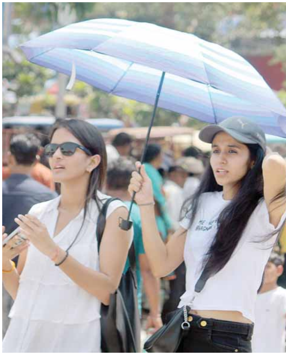
मंगलवार को राजधानी में भीषण गर्मी रही। छाते से तेज धूप का बचाव करती युवती।

लाख घरेलू मीटर हैं और इनमें से 11.7 लाख (मीटर पर) बिल बकाया हैं और उन्हें जमा नहीं किया गया है। बकाया राशि 5,737 करोड़ रुपए है। योजना के बारे में बताते हुए मुख्यमंत्री ने कहा कि इसे दो उप-खंडों में विभाजित किया जाएगा। एक के दायरे में वे लोग आएंगे जिनकी दो या दो से अधिक सही रीडिंग हैं और दूसरे चरण में वे लोग आएंगे जिनके यहां एक या एक भी सही मीटर रीडिंग नहीं हुई है। अगर हर बिल को ठीक करने की कोशिश करते तो उसे दुरुस्त करने में 100 साल से ज्यादा लग जाते। इस योजना के माध्यम से डीजेबी 11.7 लाख उपभोक्ताओं के बिल का निपटान करेगा।