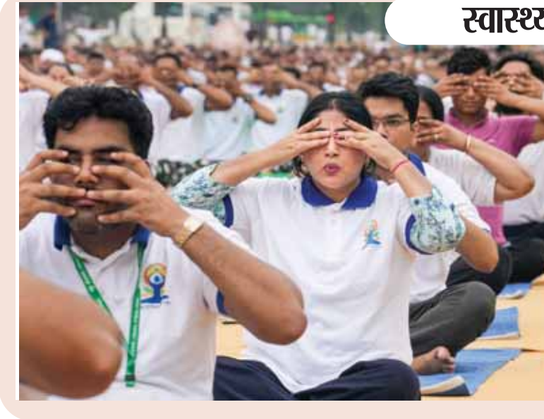
स्वास्थ्य की कुंजी

नई दिल्ली। भारत के प्रधान न्यायाधीश (सीजेआई) डी वाई चंद्रचूड़ और उच्चतम न्यायालय के अन्य न्यायाधीशों ने नवंबर अंतरराष्ट्रीय योग दिवस के अवसर पर बुधवार को यहां शीर्ष अदालत परिसर में योगासन किए। सीजेआई और अन्य न्यायाधीशों के अलावा, अधिकारियों और कर्मचारियों ने भी शीर्ष अदालत के नवनिर्मित विस्तारित भवन परिसर स्थित योग एवं मनोरंजन सभागार में आयोजित योगाभ्यास कार्यक्रम में हिस्सा लिया। इस आयोजन में भागीदारी स्वैच्छिक थी और योग विशेषज्ञों की देखरेख में योगासन कराए गए।