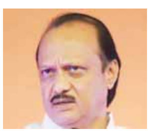
सरकार गिरने के बाद पिछले वर्ष जुलाई में नेता प्रतिपक्ष का पदभार संभाला था। तत्कालीन एमवीए सरकार में वह उपमुख्यमंत्री थे। शिवसेना में विद्रोह के कारण तत्कालीन एमवीए सरकार गिर गई थी।

राष्ट्रवादी कांग्रेस पार्टी (राकांप) के वरिष्ठ नेता अजित पवार ने बुधवार को पार्टी नेतृत्व से अपील की कि वह उन्हें महाराष्ट्र विधानसभा में नेता प्रतिपक्ष की जिम्मेदारी से मुक्त कर दें और उन्हें पार्टी संगठन में कोई भूमिका सौंपें। मुंबई में आयोजित, राकांप के 24 वें स्थापना दिवस कार्यक्रम में पवार ने यह मांग रखी। ताजा अटकलों को हवा देने वाली एक टिप्पणी में अजित पवार ने कहा, मुझे बताया गया है कि मैं नेता प्रतिपक्ष के तौर पर सख्त व्यवहार नहीं करता हूँ।