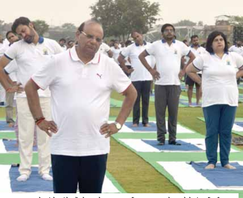
समय काले खां के बांसरा में योग करते उपराज्यपाल विनय कुमार सक्सेना।