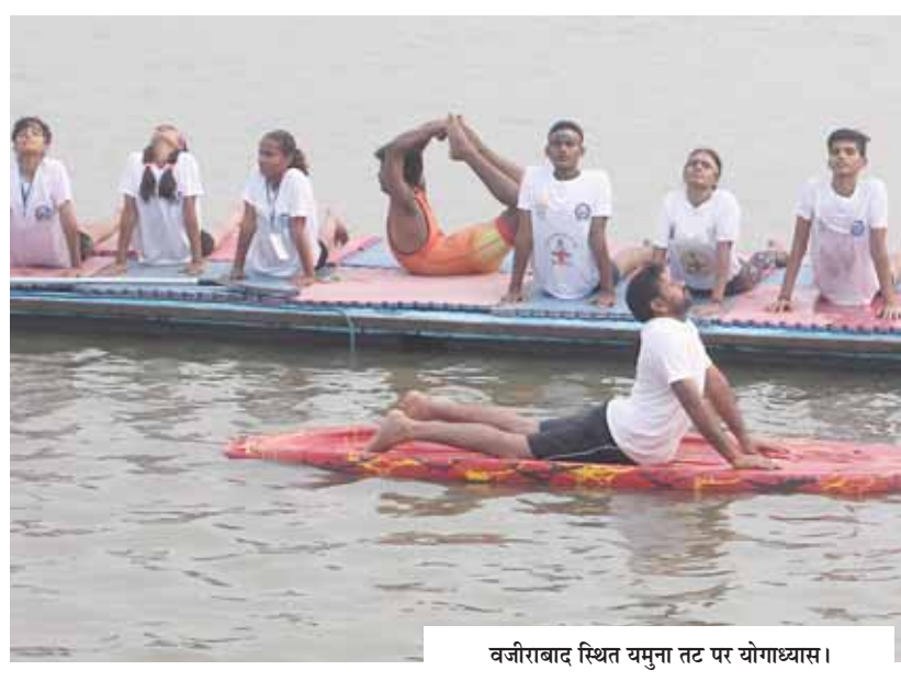
वजीराबाद स्थित यमुना तट पर योगाभ्यास।

के उपाध्यक्ष सतीश उपाध्याय ने नेहरू पार्क में एक कार्यक्रम में भाग लिया। उन्होंने ट्वीट किया, योग शरीर और मन के बीच सामंजस्य स्थापित करने में एक ऐसा जीवंत माध्यम है, जिसके नियमित अभ्यास से मनुष्य में एक नई आत्म-चेतना जाग्रत होती है। उन्होंने कहा कि प्रधानमंत्री मोदी के प्रयासों के कारण योग वैश्विक भाईचारे का प्रतीक बन गया है। पिछले साल कर्तव्य पथ के पुनर्विकास के बाद पहली बार वहां योग दिवस का आयोजन किया गया। सभी जगहों पर एलईडी स्क्रीन पर प्रधानमंत्री मोदी और उपराष्ट्रपति जगदीप धनखड़ के पहले से रिकॉर्ड संदेश प्रसारित किए गए।