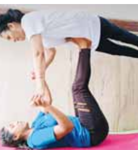
अंतरराष्ट्रीय योग दिवस कार्यक्रम में बेहतरीन करतब करती दो महिलाएं।

उन्होंने कहा कि जिस तरह से प्रधानमंत्री ने भारतीय संस्कृति के प्रतीक योग को पूरी दुनिया में प्रसिद्ध