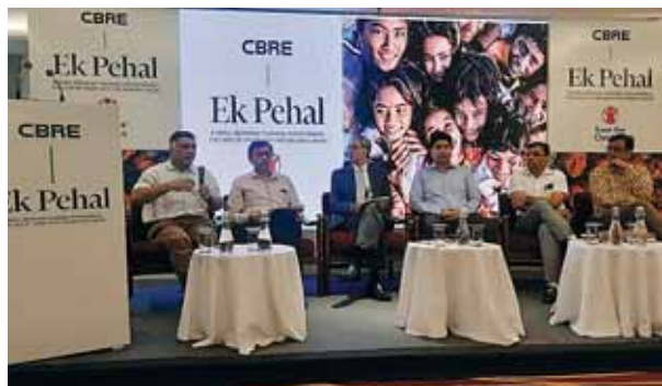
द्वितीय वर्ष के दौरान सीएसआर पहलों के लिए 9 5 करोड़ रुपये का एक कोष स्थापित किया है, जिसे वर्ष के अंत तक 9 15 करोड़ रुपये तक बढ़ाया जाएगा।

यह पहल सीखने की कमियों को दूर करने और सीखने की निरंतरता पर ध्यान केंद्रित करते हुए एचएसएमक उपाय प्रदान करके बच्चों की औपचारिक शिक्षा संस्थानों तक पहुंच सुनिश्चित करेगी। सीबीआई ने इस