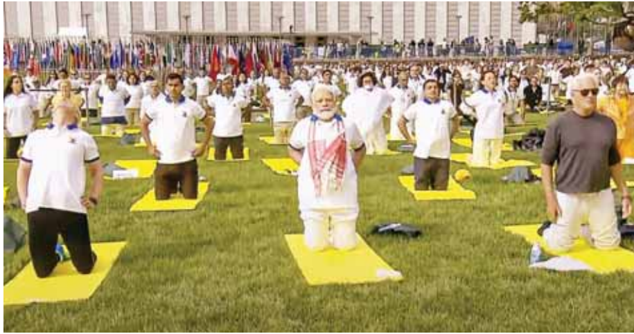
न्यूयॉर्क में संयुक्त राष्ट्र मुख्यालय पर अंतरराष्ट्रीय योग दिवस के मौके पर योग करते प्रधानमंत्री नरेंद्र मोदी और अन्य