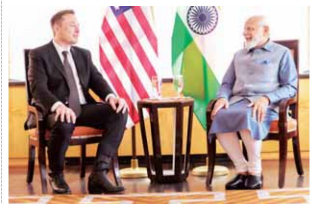
न्यूयॉर्क में प्रधानमंत्री नरेंद्र मोदी के साथ टेस्ला के सीईओ एलन मस्क।