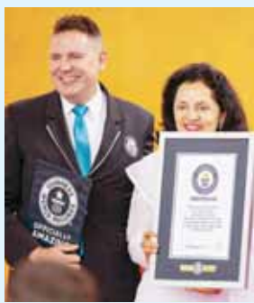
न्यूयॉर्क में अंतरराष्ट्रीय योग दिवस पर विश्व रिकॉर्ड प्रमाणपत्र के साथ यूएन में भारत की स्वामी प्रतिनिधि रुचिरा कांबोज

न्यूयॉर्क। संयुक्त राष्ट्र मुख्यालय में बुधवार को अंतरराष्ट्रीय योग दिवस के अवसर पर प्रधानमंत्री नरेंद्र मोदी की अगुवाई में आयोजित योग सत्र को सर्वाधिक देशों के लोगों की सहभागिता के मामले में गिनीज वर्ल्ड रिकॉर्ड में दर्ज किया गया है। राष्ट्रपति जो बाइडन और प्रथम महिला जिल बाइडन के निमंत्रण पर अमेरिका की अपनी पहली राजकीय यात्रा के पहले चरण में यहाँ आए मोदी ने नौवें अंतरराष्ट्रीय योग दिवस पर ऐतिहासिक समारोह का नेतृत्व किया। इसमें संयुक्त राष्ट्र के शीर्ष अधिकारियों, राजनयिकों और जानीमानी हस्तियों ने भाग लिया। अधिकारियों ने कहा कि प्रधानमंत्री मोदी के नेतृत्व में संयुक्त राष्ट्र मुख्यालय में आयोजित योग सत्र ने