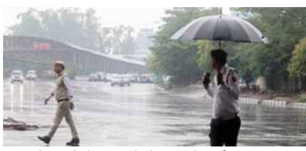
वृष्ट्युत्थान में बरसत के बीच यातायात नियंत्रित करता पुलिसकर्मी

राष्ट्रीय दिल्ली, हरियाणा और उत्तर प्रदेश में अगले दो दिन बारिश का दौर चलेगा। कहीं-कहीं तेज हवा के साथ ओले भी पड़ सकते हैं। मौसम विभाग ने देश के ज्यादातर हिस्सों में पांच मई तक आंधी, बारिश और ओले पड़ने का पूर्वानुमान बताया है। इससे पूरे उत्तर भारत में अगले चार-पांच दिन लू नहीं चलेगी। राजधानी दिल्ली में शनिवार और रिविवा को हल्की बारिश हुई, जिसके परिणामस्वरूप अधिकतम तापमान