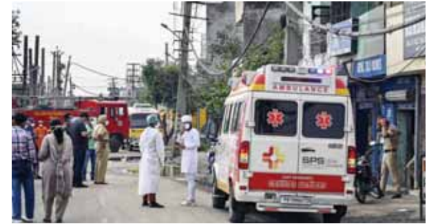
गैस रिसाव के पीड़ितों को एम्बुलेंस से लेकर जाते बचावकर्ता

उन्होंने बताया कि घटना के बाद इलाके को सील कर दिया गया, निवासियों को बाहर निकाल लिया गया और राष्ट्रीय आपदा मोचन बल (एनडीआरएफ) की टीम मौके पर पहुंच गई। उन्होंने बताया कि घटना की जांच मजिस्ट्रेट से कराने के आदेश दे दिए गए हैं, जबकि लुधियाना पुलिस ने अज्ञात लोगों के खिलाफ प्राथमिकी दर्ज की है। जिला प्रशासन द्वारा जारी एक आधिकारिक विज्ञप्ति