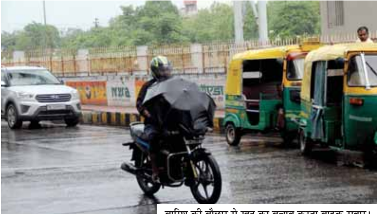
बारिश की बौछार से खुद का बचाव करता बाइक सवार।

पूरे एनसीआर में मौसम खुशनुमा बना हुआ है। यहां मौसम विभाग ने बारिश को लेकर यलो अलर्ट जारी किया है। मौसम विभाग का कहना है कि 4 मई से मौसम में सुधार होगा। लेकिन 7 और 8 मई को भी इन इलाकों में बारिश की