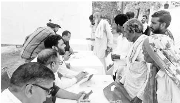
मुख्यमंत्री अंत्योदय परिवार उत्थान मेले में भाग लेते लोग।

सरकार की जनकल्याणकारी योजनाओं से समाज का अंतिम व्यक्ति भी लाभान्वित हो, इसी प्राथमिकता के आधार पर प्रदेश सरकार ने विभिन्न योजनाएं, परियोजनाएं व नीतियां लागू की हैं। सरकार ने इसी क्रम में ऐसे परिवार जिनकी वार्षिक आमदनी एक लाख 80 हजार रुपये से कम है, उनके आर्थिक स्तर को मजबूत करने के उद्देश्य से मुख्यमंत्री हरियाणा मनोहर लाल ने अंत्योदय परिवार उत्थान योजना की शुरुआत की, जिसके अंतर्गत जिला में चौथे चरण के अंत्योदय मेलों का शुभारंभ हो चुका है। पहला मेला होडल के मुन्दाना चौक पर स्थित राजकीय मॉडल