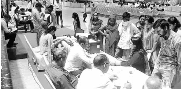
मेले में भाग लेते लाभार्थी।

मुख्यमंत्री अंत्योदय परिवार उत्थान मेला के तहत जिन परिवारों की वार्षिक आय 1,80,000 से कम है, उन परिवारों को आजीविका के सधनों में वृद्धि करने के लिए अंत्योदय मेला लगाया गया है। मुख्यमंत्री अंत्योदय परिवार उत्थान मेलों के माध्यम से समाज में अंतिम पंक्ति में खड़े व्यक्ति को सरकार की जनकल्याणकारी योजनाओं का सीधा लाभ पहुंचाया जा