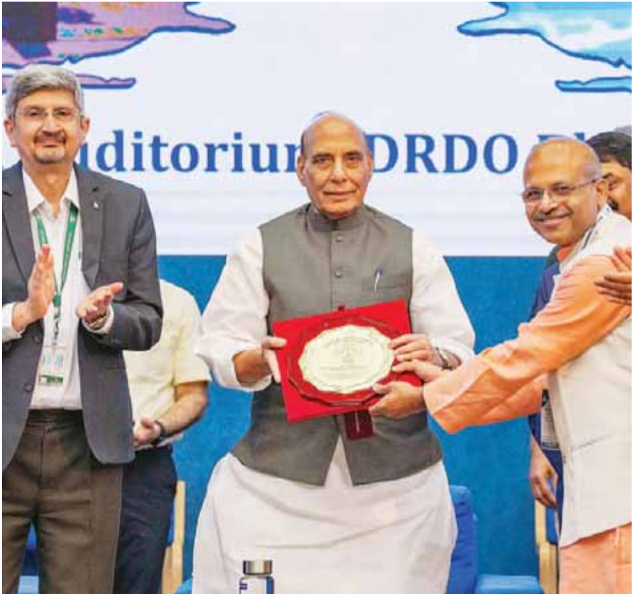
नई दिल्ली में रक्षामंत्री राजनाथ सिंह डीआरडीओ कानवलेवो का शुभारम्भ करते हुए।

मुंबई। महाराष्ट्र के उपमुख्यमंत्री देवेंद्र फडणवीस ने बृहस्पतिवार को प्रधानमंत्री नरेंद्र मोदी को विश्व नेता बताया और कहा कि वैश्विक मंच पर उनका कद उल्लेखनीय रूप से बढ़ गया है, लेकिन विपक्षी दल उनकी बढ़ती लोकप्रियता से दुखी है। यहां से करीब 400 किलोमीटर दूर सोलापुर में पत्रकारों से बातचीत में फडणवीस ने कहा कि विपक्षी पार्टियां केवल प्रधानमंत्री मोदी का विरोध करने के लिए एक साथ आ रही हैं लेकिन लोगों का उन पर (मोदी पर) भरोसा है। जापान के हिरोशिमा में हाल में हुए क्राइ शिखर सम्मेलन के दौरान अमेरिकी राष्ट्रपति जो बाइडन खुद चलकर मोदी के पास आए और उनसे जो बात की उनमें से एक यह भी थी कि उन्हें, वाशिंगटन डीसी की मोदी की अगले महीने होने जा रही राजकीय यात्रा के दौरान भारतीय नेता के कार्यक्रमों में शामिल होने के लिए प्रमुख नागरिकों से बड़ी संख्या में अनुरोध मिल रहे हैं।