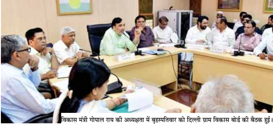
विकास मंत्री गोपाल राय की अध्यक्षता में बुधस्वतिवार को दिल्ली ग्राम विकास बोर्ड की बैठक हुई।

इसके तहत सड़कों, नालियों, जल निकास, सामुदायिक केंद्र, पार्क, स्मशान, खेल मैदान आदि से जुड़े विकास कार्य किए जाएंगे। सभी