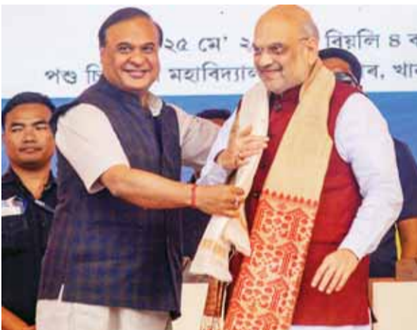
गुवाहाटी में असम के मुख्यमंत्री हिमंत विश्व शर्मा और केंद्रीय गृह मंत्री अमित शाह

उन्होंने कहा, मैं जल्द ही मणिपुर जाऊंगा और वहां तीन दिन रहूंगा, लेकिन उससे पहले दोनों गुटों को आपस में अविश्वास और संदेह दूर करना चाहिए और सुनिश्चित करना चाहिए कि राज्य में शांति बहाल हो। शाह ने कहा, केंद्र यह सुनिश्चित करेगा कि राज्य में हुई झड़पों में पीड़ित सभी लोगों को न्याय मिले, लेकिन लोगों को राज्य में शांति सुनिश्चित करने के लिए बातचीत करनी चाहिए। पिछले छह वर्षों के दौरान, हाल की झड़पों से पहले, मणिपुर में कोई नाकाबंदी या बंद नहीं था और लोगों को फिर से वैसी स्थिति