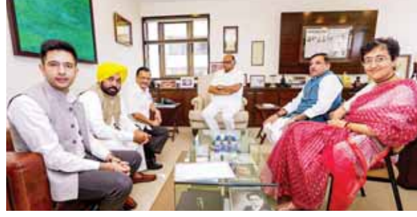
शरद पवार के साथ सीएम केजरीवाल, भगवंत मान, संजय सिंह व अन्य।

संयुक्त संवैधानिक सम्मेलन में अरविंद केजरीवाल ने कहा कि दिल्ली के लोगों के साथ बहुत अन्याय हुआ है। वर्ष 2015 में जब आम आदमी पार्टी की सरकार बनी थी, तो 23 मई 2015 को केंद्र सरकार ने एक साधारण अधिसूचना जारी कर अधिकारियों पर नियंत्रण करने की सारी पावर छीन ली। पिछले 8 साल से कोर्ट के चक्कर काट रहे थे। आठ साल के बाद सुप्रीम कोर्ट की पांच