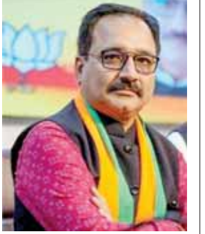
स्कूलों और पाठ्य पुस्तकों का दुरुपयोग करने की कोशिश कर रही है। चूंकि मध्य और माध्यमिक शिक्षा की किताबें एनसीईआरटी की हैं, इसलिए तत्कालीन शिक्षा मंत्री मनीष सिंसोदिया बहुत कोशिशों के बाद अपने संदेश को पाठ्य पुस्तकों में शामिल नहीं कर पाए, लेकिन शिक्षा मंत्री अतिशी ने सत्ता के कुछ महीनों के भीतर बड़ी चतुराई से अपनी तस्वीर और संदेश को एमसीडी की प्राथमिक पाठ्य पुस्तकों में स्थान दिया है।

एमसीडी के प्राथमिक विद्यालयों की किताबों में शिक्षा मंत्री आतिशी की फोटो और संदेश को प्रकाशित करने का मुद्दा गरमा गया है। प्रदेश भाजपा अध्यक्ष वीरेंद्र सचदेवा ने कहा है कि प्राथमिक शिक्षा व्यवस्था का राजनीतिकरण हो रहा है। भाजपा निगमायुक्त से शिकायत कर शिक्षा मंत्री के संदेश वाली पुस्तकों के हटाने का अनुरोध करेगी। किताबों में इस तरह का संदेश को प्रकाशित करना चैंकाने वाला है। वीरेंद्र सचदेवा ने कहा कि केजरीवाल सरकार पहली बार वर्ष 2013 में सत्ता में आई है, तब से वह अपने राजनीतिक प्रचार के लिए