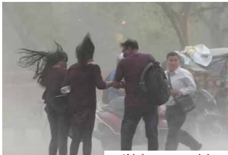
आंधी के दौरान खुद का बचाव करते लोग।

मौसम विज्ञान विभाग (आईएमडी) के अनुसार, दोपहर या शाम के समय अधिकतर स्थानों पर आमतौर पर आसमान में बादल छाए