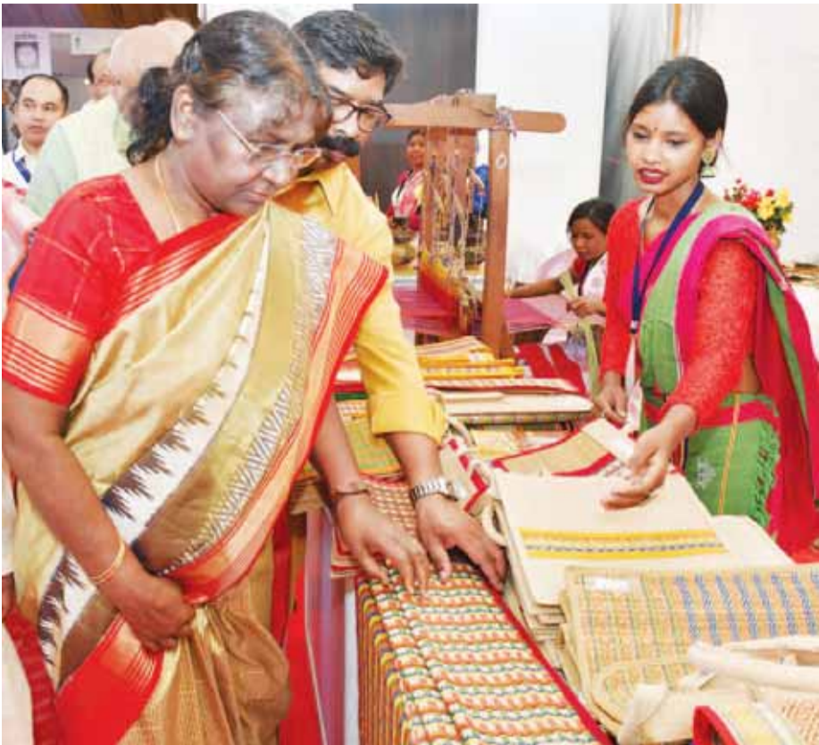
खूंटी में राष्ट्रपति द्रौपदी मुर्मू व झारखण्ड के मुख्यमंत्री हेमंत सोरेन स्वयं सहायता समूह द्वारा बनाए गए सामान को देखते हुए।

बिरसा मुंडा कॉलेज के स्टेडियम में कम से कम 25,000 जनजातीय महिलाओं ने इसमें हिस्सा लिया। राष्ट्रपति ने जोर दिया कि अनुसूचित जनजाति समुदायों की सांस्कृतिक पहचान संरक्षित करने की आवश्यकता है। साथ ही उन्होंने कहा कि उनके समाज में देहेज जैसी सामाजिक कुरीतियां नहीं हैं। राष्ट्रपति ने विभिन्न आदिवासी उत्पादों के स्टॉल भी देखे। झारखंड और बिहार के वन धन विकास केंद्रों और कई अन्य को इस प्रदर्शनी में भाग लेने के लिए आमंत्रित किया गया था। राष्ट्रपति इसके बाद रांची में भारतीय सूचना प्रौद्योगिकी संस्थान के दूसरे दीक्षांत समारोह में भी शामिल होंगी। उन्होंने रांची में करीब 550 क्रिस्टल कोर्स की लागत से बने झारखंड उच्च न्यायालय के नए भवन का भी उद्घाटन किया।