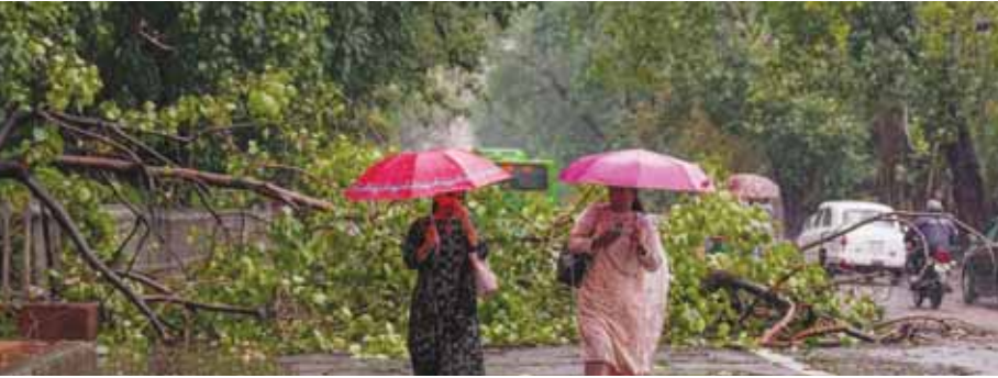
नई दिल्ली में आंधी-पानी के कारण गिरे पेड़ के पास से निकलती महिलाएँ

पूरे उत्तर भारत में तीन दिन से बारिश और आंधी के कारण व्यापक नुकसान हुआ और 28 लोगों की मौत हो गई। दिल्ली और उत्तर प्रदेश में शनिवार को तेज हवाओं के साथ हुई भारी बारिश से कई जगह पेड़ उखड़ गए और बिजली के खंभे गिर गए। वर्षा जलित घटनाओं में गाजियाबाद में दो और गोंडा में एक व्यक्ति की मौत हो गई। वहीं, राजस्थान और झारखंड में बारिश और बिजली गिरने की घटनाओं में 25 से अधिक लोगों की जान चली गई है। अधिकारियों के मुताबिक दिल्ली में शनिवार सुबह से ही घने बादल फिर आए और देखते-देखते तेज हवाओं के साथ बारिश होने लगी। तेज हवा के साथ बारिश के कारण कई जगह पेड़ उखड़ गए और बिजली लाइन, खंभों और ट्रांसफार्मर में खराबी आ गई। इससे दिल्ली के फतेहपुर बेरी, सैनिक फार्म, छतपुर, मुंडका, नजफगढ़,