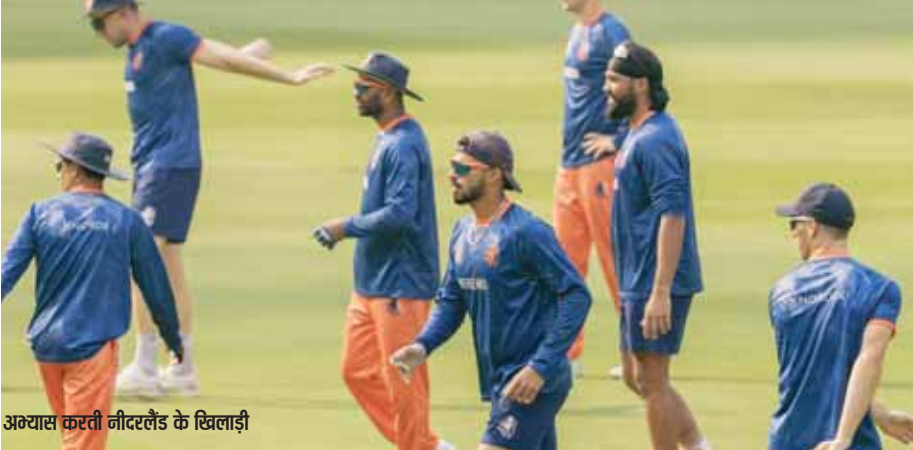
अगवासा करती नीदरलैंड के खिलाड़ी

● दोनों टीमों तैयार ● विश्व कप :अफगानिस्तान व नीदरलैंड का मैच आज