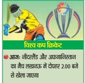
विश्व कप क्रिकेट

महिला कर्मिकों की संख्या बढ़ाकर 40 हजार कर दी है। मुख्यमंत्री ने कहा, सरकार नए सत्र से मुख्यमंत्री कन्या सुमंगला योजना के तहत 25 हजार रुपए देगी। इसके लिए बजट की व्यवस्था कर दी गई है। अभी तक इस योजना का लाभ 17 लाख बेटियों को मिल रहा है। यह संख्या और बढ़ाई जाएगी। मुख्यमंत्री ने 217 विकास परियोजनाओं का लोकार्पण और शिलान्यास भी किया। उन्होंने कहा, आगामी (शेष पेज 9)