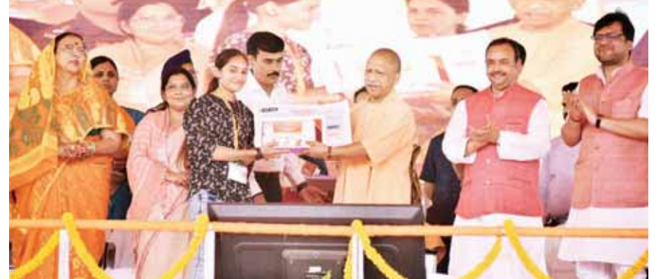
हरदोई में नारी शक्ति वंदन समेतन में उप के मुख्यमंत्री योगी आदित्यनाथ।

मुख्यमंत्री ने चर्चा नारी शक्ति वंदन समेतन को संबोधित करते हुए कहा, आधी आबादी को सम्मान दिए बिना कोई भी समाज सशक्त नहीं हो सकता। इसे प्रधानमंत्री नरेंद्र मोदी ने बहुत करीब से समझा है। यही वजह है कि आजादी के बाद पहली बार वर्ष