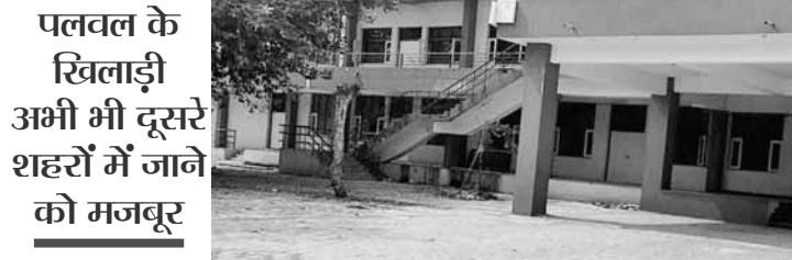
पलवल के खिलाड़ी अभी भी दूसरे शहरों में जाने को मजबूर