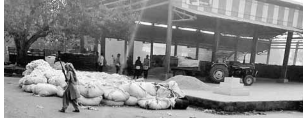
पायनियर समाचार सेवा। पलवल

अनाज मंडी पलवल में एकाएक कपास की आवक में बढ़ोतरी हुई है। मंडी में लगभग 20 हजार क्विंटल कपास की फसल आ चुकी है। मंडी में हर रोज 500 से 700 क्विंटल कपास की फसल बिक्री के लिए आ रही है। आवक बढ़ने से आदतियों के चेहरों पर रौनक आई है। वहीं इस बार पैदावार बेहतर होने व अच्छा दाम मिलने से किसान भी खुश हैं। पलवल अनाज मंडी में पिछले कुछ दिनों से कपास की फसल की आवक बढ़ी है। प्रतिदिन सैकड़ों क्विंटल फसल बिक्री के लिए मंडी में आ रही है। इस साल फसल की बिक्री न्यूनतम मूल्य से अधिक होने से किसान और आदतियों और मंडी अधिकारियों में खुशी देखी जा सकती है। सुबह से किसान अपनी कपास की फसल को लेकर मंडी में पहुंचना शुरू हो जाते हैं। इस समय कपास