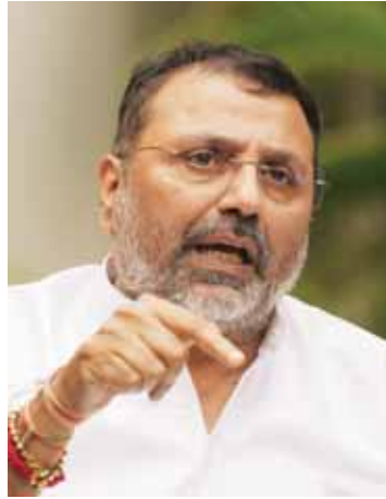
नई दिल्ली में संगठनदाता समूहों को संबोधित करते भाजपा सांसद निशिकांत दुबे।

साझा किए हैं। दिलचस्प बात यह है कि तेजतरंग और सबसे मुखर टीएमसी नेता अपने सभी लक्जरी बैग, सौंदर्य उत्पाद और अन्य सभी लक्जरी वस्तुएं एथिक्स कमेटी की जांच के लिए ले गईं, जैसा कि हीरानंदानी द्वारा लगाए गए आरोपों की जांच के लिए किया गया था। मामले से जुड़े सूत्रों ने आरोप लगाया कि उनके संसदीय खाते में लगभग 47 लॉग-इन दुबई से किए गए थे। लोकसभा की आचार समिति भाजपा सांसद निशिकांत दुबे के टीएमसी सांसद के खिलाफ 'कैश-फॉर-क्वैरी' आरोपों की जांच कर रही है। उन्होंने मोइजा पर एक प्रसिद्ध व्यापारिक परिवार के दुबई स्थित