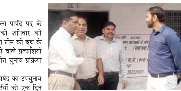
कड़ी सुरक्षा में होगा मतदान : रविवार को होने वाला पार्षद पद के उपचुनाव के दौरान मतदान केंद्र पर कड़ी सुरक्षा व्यवस्था होगी। मतदान केंद्र के आस पास धारा 144 लागू रहेगी। किसी भी व्यक्ति को मतदान केंद्र के आस पास से आने व जाने की अनुमति नहीं होगी। मतदान पूरी सुविधा और सुरक्षा के बीच कराया जाएगा।

रविवार को नगर के वार्ड-15 में पार्षद का उपचुनाव होगा। चुनाव में बनाई गई पोलिंग पार्टियों को एक दिन पहले शनिवार को एसडीएम कार्यालय में प्रशिक्षण देने के साथ चुनाव सामग्री के साथ रवाना किया जाएगा। चुनाव ईवीएम मशीन से कराया जाएगा। पोलिंग पार्टियों को प्रशिक्षण देने के साथ ही तुरंत शहर के राजकीय कन्या वरिष्ठ माध्यमिक स्कूल में बना मतदान केंद्रों के लिए रवाना किया जाएगा। यहां पर बूथ नंबर 30 और 31 में मतदान होगा। अभी तक वार्ड में कुल वोटों की संख्या 1500 के लगभग है। चुनाव में द्यूटियां लगा दी गई है। प्रत्याशियों का दी जाएगी जानकारी : शनिवार को ही प्रत्याशियों को ईवीएम मशीन के द्वारा कराया जाने वाला चुनाव की जानकारी दी जाएगी। ईवीएम मशीन की जांच कराई जाएगी। शनिवार को मतदान केंद्र पर प्रत्याशियों के एजेंटों के नाम लेने के साथ उनका प्रवेश कार्ड बनाया जाएगा।