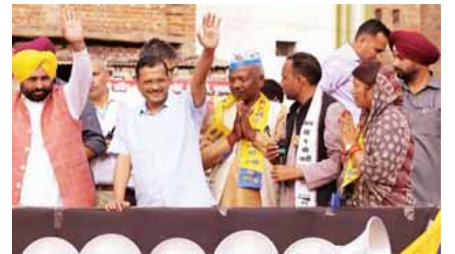
मध्य प्रदेश के सिंगरौली में दिल्ली के मुख्यमंत्री और आम आदमी पार्टी के संयोजक अरविंद केजरीवाल तथा पंजाब के मुख्यमंत्री भगवंत सिंह मान रोड शो में भाग लेते हुए। राज्य में जल्द विधानसभा चुनाव होने वाले हैं।