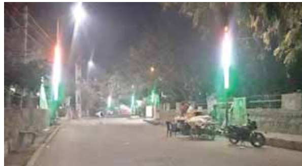
सोहना का नागरिक अस्पताल मार्ग तिरंगा रोशनी से जगमगाता हुआ।

अस्पताल मार्ग पर लगी लाइटें : ठेकेदार ने गुरुवार को राष्ट्रीय राजमार्ग