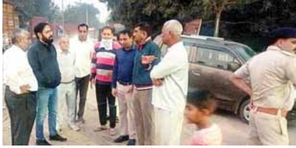
गुरुग्राम में सफाई व्यवस्था का जायजा लेते निगमायुक्त पीसी मीणा।

नगर निगम गुरुग्राम ने शहर की सफाई व्यवस्था को दुरुस्त करने के लिए और अधिक तेजी से कार्य शुरु कर दिया गया है। सप्ताह के सातों दिन कचरा उठान पर जोर दिया जा रहा है। कई क्षेत्रों में दिन ही नहीं, बल्कि रात के समय भी सफाई व्यवस्था व कचरा उठान कार्य तेज गति से किया जा रहा है। नगर निगम आयुक्त पीसी मीणा भी चुनाव द्यूटी से वापस आने के बाद लगातार शहर का दौरा कर रहे हैं।