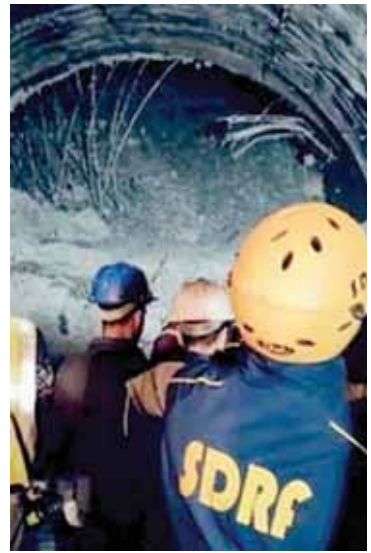
उत्तराखंड में चमोली भूकंप के बाद जलवायु-संबंधी विभीषिकाओं का खामियाजा भुगत रहे हैं। लगातार धंस रहा जोशीमट एक गंभीर चेतावनी है। इसके बावजूद निर्माण व विनाश का दुष्कर मानव जीवन को भारी नुकसान पहुंचा रहा है। उत्तरकाशी में बचाव कर्मा अपना काम कर रहे हैं, पर इस घटना ने एक बार फिर कोई बड़ी परियोजना शुरू करने से पहले सावधानी से विचार करने की आवश्यकता उजागर की है। यह बात देश के सभी परिस्थितिकीय रूप से संवेदनशील क्षेत्रों पर लागू होती है जिनमें सुदूर क्षेत्रों में घने जंगल, पश्चिमी घाट और हिमालयी क्षेत्र शामिल हैं। हालांकि, वर्तमान प्राथमिकता सुरंग में फंसे कर्मियों को सुरक्षित बाहर निकालना है, पर विकास और पर्यावरण संरक्षण के बीच संतुलित विकास के महत्व को दृष्टिकोण से भी रेखांकित किया जाना चाहिए। हिमालय के निचले क्षेत्रों की संवेदनशील परिस्थितिकी पर समुचित ध्यान देने से ही स्थानीय जनता तथा पूरे क्षेत्र की बेहतर सुनिश्चित की जा सकती है।