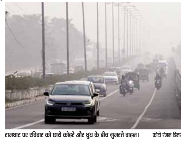
राजघाट पर रविवार को छाये कोहरे और धुंध के बीच गुजरते वाहन।

जहरीली हवा में सांस ले रहे दिल्ली वालों को हवा की गुणवत्ता में सुधार होने से कुछ राहत मिली है। रविवार सुबह राजधानी में वायु गुणवत्ता सूचकांक 290 यानी खराब श्रेणी में दर्ज किया गया है। एन्यूआई में सुधार होने पर ग्रैप चार के प्रतिबंध हटा दिए गए हैं।