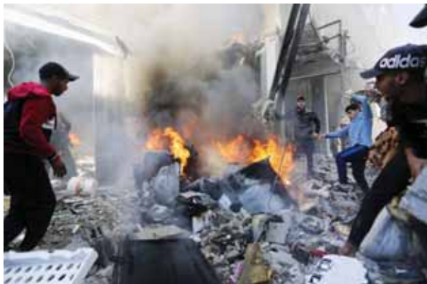
गाजा पट्टी पर इजराइली हमले के बाद जीवित लोगों तलाश करते लोग

इजराइली अधिकारियों के अनुसार, हमस ने हमले के बाद 7 अक्टूबर को लगभग 240 लोगों को बंधक बना लिया था, जब वे गाजा की सैन्यीकृत सीमा पार करके दक्षिणी इजराइल में घुस गए और लगभग 1,200 लोगों को मार डाला, जिनमें ज्यादातर नागरिक थे। वहीं फिलिस्तीनी क्षेत्र की हमस सरकार के अनुसार, गाजा पट्टी पर इजराइल के लगातार बमबारी और जमीनी हमले से अब तक 12,300 लोग मारे गए