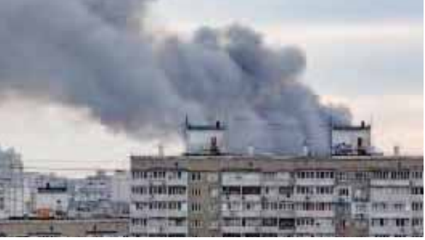
भाषा । कीव

रूस ने यूक्रेन की राजधानी कीव पर बीती रात ड्रोन हमले किए। ब्रिटेन के रक्षा मंत्रालय ने कहा कि युद्ध के दूसरे शौतकाल मौसम की ओर बढ़ने के बीच यूक्रेन सीमा पर बड़े बदलाव की कुछ तात्कालिक संभावनाएं हैं। सेना के एक बयान के अनुसार, रूस ने कीव, चर्कासी और पोल्टवा क्षेत्रों के निशाना बनाते हुए 20 ईंगनी ड्रोन से हमला किया। वहीं, यूक्रेन की विमान रोधी प्रणालियों ने 15 ड्रोन मार