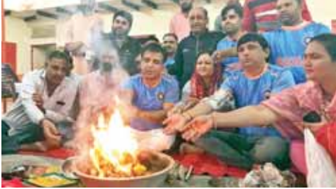
विश्व कप में भारत की जीत के लिए शीतला माता मंदिर में हवन करते कांग्रेस कार्यकर्ता।

गुरुग्राम। भारत-ऑस्ट्रेलिया के बीच रविवार को विश्व कप के फाइनल मैच में भारत की जीत को लेकर कांग्रेस कार्यकर्ताओं ने शीतला माता मंदिर में हवन-यज्ञ किया। मां शीतला से भारत की जीत की कामना की।