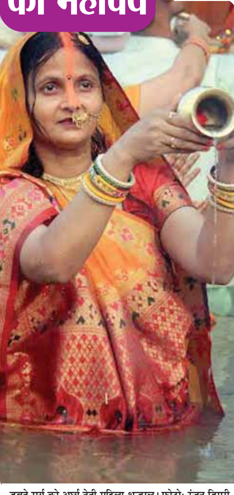
डूबते सूर्य को अर्घ्य देती महिला श्रद्धालु।