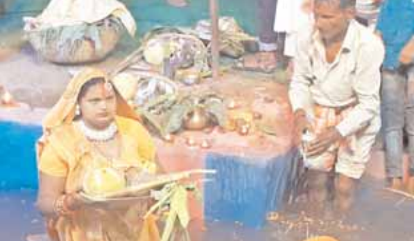
सोहना के देवीलाल खेल स्टेडियम में रविवार की शाम छठ से एक दिन पहले ढलते हुए सूरज का अर्घ्य देते हुए।