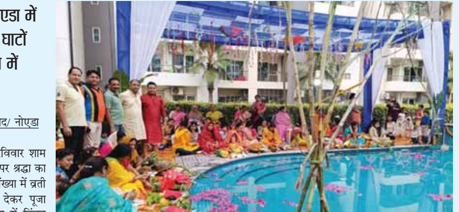
क्रासिंग रिपब्लिक स्थित पैरासाइट गिम्पनी सोसाइटी में रविवार को छठ पर्व मनाया गया। इस दौरान सोसायटी के सैकड़ों लोगों ने सामूहिक रूप से स्विमिंग पूल में सूर्य को अर्घ्य दिया।

छठ पर्व के अवसर पर आने वाले श्रद्धालुओं के आवागमन के दौरान श्रद्धालुओं के सुविधा एवं यातायात व्यवस्था के दृष्टिगत गाजियाबाद और नोएडा में आज से यातायात को डायवर्ट कर दिया गया है। लिंक रोड, डीपीएस सिद्धार्थ विहार एवं नया बस अड्डा की ओर से हिण्डन पुल की तरफ सभी प्रकार के व्यवसायिक वाहनों का आवागमन पूर्ण रूप से प्रतिबन्ध रहा। इसी प्रकार मोहननगर की ओर से हिण्डन पुल की तरफ सभी प्रकार के व्यवसायिक वाहनों के लिए