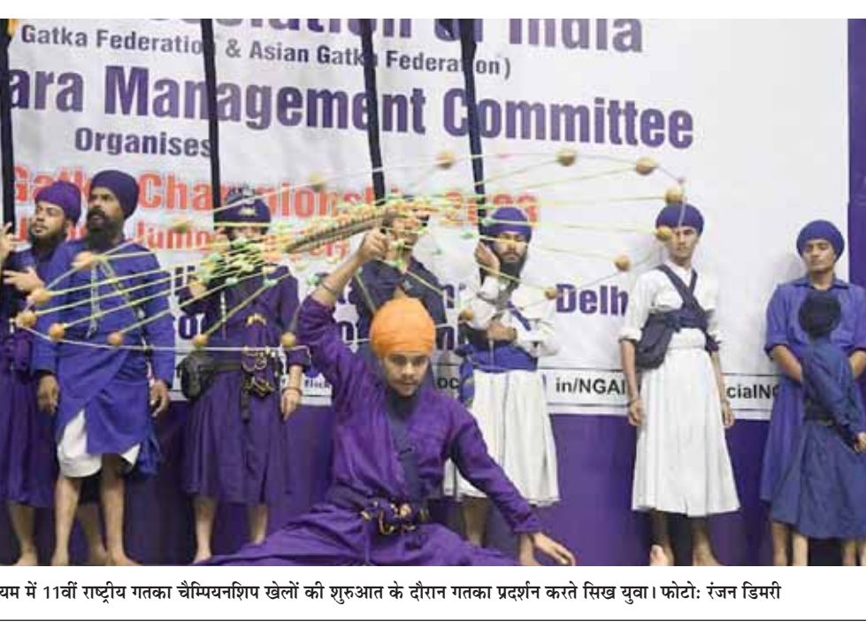
तालकटोरा स्टेडियम में 11वाँ राष्ट्रीय गतका चैम्पियनशिप खेलों की शुरुआत के दौरान गतका प्रदर्शन करते सिख युवा।