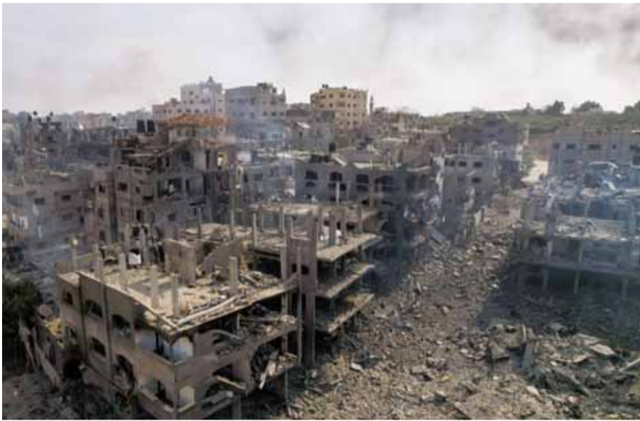
इजराइल की भीषण बमबारी के बाद फलस्तीन के गाजा शहर के आसपास की इलाकों में कई इमारतें जमींदोज हो गईं।

● हमास के खिलाफ अभियानों की निगरानी के लिए इजराइल ने यूनिटी गवर्नमेंट बनाई