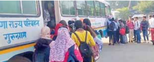
बुधवार को भी सोहना के सामान्य बस स्टैंड पर छात्राएँ गुरुग्राम जाने के लिए सामान्य बसों में धक्का मुक्की करते चढ़ते हुए।