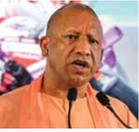
गाजियाबाद

मुख्यमंत्री योगी आदित्यनाथ गुरुवार यानि 12 अक्टूबर को गाजियाबाद आएंगे। वे रैपिड रेल प्रोजेक्ट का जायजा लेंगे। नवरात्र में इस प्रोजेक्ट का उद्घाटन पीएम नरेंद्र मोदी को करना है। इसके लिए तैयारियां युद्धस्तर पर चल रही हैं। सरकारी