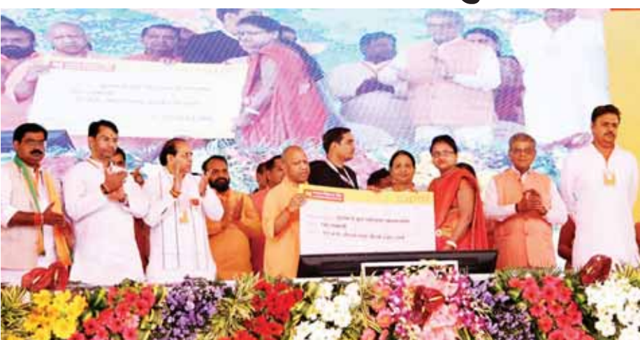
बुलंदशहर में आयोजित कार्यक्रम में मुख्यमंत्री योगी आदित्यनाथ ने 632 करोड़ रुपये के विकास कार्यों का ऐलान किया।

उत्तर प्रदेश के मुख्यमंत्री योगी आदित्यनाथ ने उज्वला योजना के लाभार्थियों को दिवाली उपहार के रूप में मुफ्त गैस सिलेंडर देने की घोषणा की है। उन्होंने यह ऐलान मंगलवार को बुलंदशहर में आयोजित एक कार्यक्रम के दौरान किया। इसके साथ ही मुख्यमंत्री ने बुलंदशहर वासियों को 632 करोड़ रुपये के विकास योजनाओं की सौगात दी। मुख्यमंत्री योगी आदित्यनाथ ने कहा कि प्रधानमंत्री नरेंद्र मोदी ने उज्वला योजना के माध्यम से हर परिवार को गैस सिलेंडर की कीमतों में 300 रुपये की कमी करके एक उपहार दिया था। इसके बाद अब यूपी सरकार ने निर्णय लिया है कि प्रत्येक उज्वला योजना कनेक्शन लाभार्थी