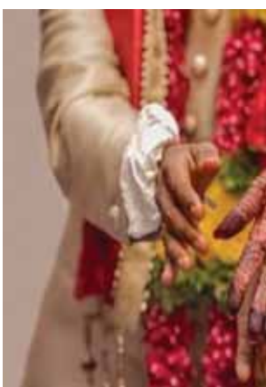
पायनियर समाचार सेवा। नई दिल्ली

● 23 नवंबर से 15 दिसंबर तक देश भर में लगभग 35 लाख शादियां होंगी