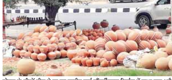
सोहना के बीचों बीच से जा रहा राष्ट्रीय मार्ग सौंदर्यीकरण निर्माण में बाधा बना अवैध अतिक्रमण।

शहर के एक मात्र राष्ट्रीय मार्ग और सर्विस रोड के बीच ग्रीन पट्टी में हो रहे अवैध कब्जे सौंदर्यीकरण में बाधा बने हुए हैं। भवन निर्माण सामग्री बेचने वालों से लेकर वाहन मिस्त्री, ढाबा संचालक, फल विक्रेताओं समेत चटाई-मटका बेचने वालों ने सामान रखकर अवैध कब्जा किया हुआ है। शहर के बीचों बीच में से जा रहा राष्ट्रीय मार्ग 248ए को दमदास चौक से नूंह जाने वाले मार्ग पर गांव रायपुर तक सौंदर्यीकरण का कार्य चल रहा है। इस करीब 3 किलोमीटर की दूरी में राष्ट्रीय मार्ग के साथ-साथ सर्विस रोड के बीच के खाली स्थान को रंग-बिरंगे फूल व सुगंध देने वाले पौधे लगाकर सौंदर्यीकरण किया जाना है। जिसका निर्माण कार्य चल रहा है। अभी तक 60 फीसदी कार्य हो चुका है। 40 फीसदी कार्य को जल्द से जल्द पूरा किया जाना है। इस 40 फीसदी कार्य को आने वाले दो माह में पूरा किया जाना है। ताकि जनवरी