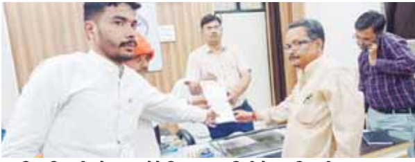
उप जिलाधिकारी को ज्ञापन देते हिन्दू युवा वाहिनी के पदाधिकारी