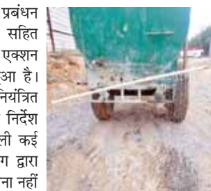
गुरुग्राम में सड़कों पर छिड़काव करता नगर निगम का टैंकर।

गुरुग्राम। केन्द्रीय वायु गुणवत्ता प्रबंधन आयोग द्वारा राष्ट्रीय राजधानी क्षेत्र सहित आसपास के क्षेत्रों में ग्रेडेड रैस्पॉस एक्शन प्लान (जीआरएपी) लागू किया हुआ है। इसके तहत प्रदूषण के स्तर को नियंत्रित करने के लिए संबंधित विभागों को निर्देश दिए हुए हैं तथा प्रदूषण बढ़ाने वाली गतिविधियों पर प्रतिबंध भी आयोग द्वारा लगाया हुआ है। जीआरएपी की पालना नहीं करने वालों पर नगर निगम गुरुग्राम ने 2.39 लाख रुपये जुर्माना लगाया है। नगर निगम द्वारा जीआरएपी की पालना में प्रदूषण स्तर को नियंत्रित रखने के लिए गंभीरता से कार्य किया जा रहा है। इसके तहत एक ओर जहां सड़कों की मैकेनाइज्ड स्वीपिंग के लिए 14 मशीनें कार्य कर रही हैं, वहीं दूसरी ओर धूल को उठने से रोकने के लिए नगर निगम की निर्माण साइटों पर टैकों के माध्यम से पानी का छिड़काव करने का कार्य भी लगातार जारी है। जीआरएपी के तहत प्रतिबंधित गतिविधियां करने वालों पर भी नजर रखी जा रही है तथा उनके नियमानुसार चालान करने की कार्रवाई निगम की टीमों कर रही हैं। जीआरएपी के तहत प्रतिबंधित गतिविधियां करने वाले 53 उल्लंघनकर्ताओं पर 2.39 लाख रुपये का जुर्माना लगाया गया है। इनमें मलबा फेंकने के मामले में 11 उल्लंघनकर्ताओं पर 1 लाख 20 हजार रुपये, कचरा जलाने के मामले में 3 उल्लंघनकर्ताओं पर 15 हजार रुपये, कचरा फैलाने के मामले में 26 उल्लंघनकर्ताओं पर 19 हजार रुपये, ठोस कचरा प्रबंधन नियमों की पालना नहीं करने वाले 13 उल्लंघनकर्ताओं पर 85 हजार रुपये के चालान किए गए हैं।