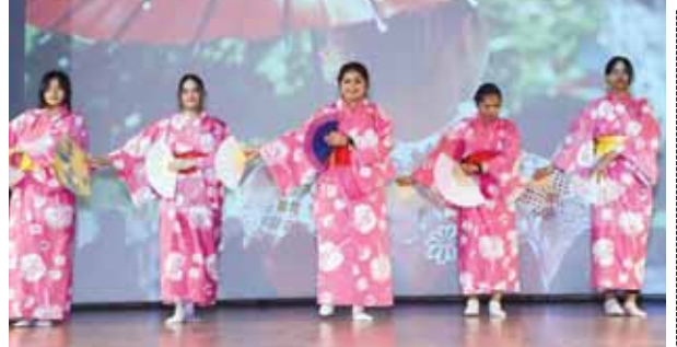
जापानी लोक नृत्य सकुरा सकुरा ओडोरी करती महिला कलाकार।

दिल्ली विश्वविद्यालय के एंथ्रोपोलॉजी विभाग द्वारा डीयू संस्कृति परिषद के सहयोग से दो दिवसीय 'कला उत्सव' का आयोजन किया गया। रामजस कॉलेज ऑडिटीोरियम में आयोजित इस कार्यक्रम में भारत, जापान और ब्राजील कला रूपों के विस्तार से उनकी समृद्ध विरासत, परंपराओं और कलात्मक अभिव्यक्तियों का जश्न