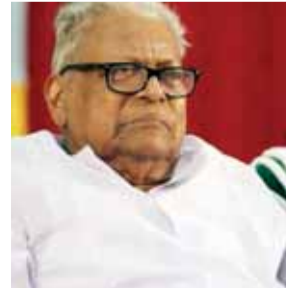
वीएस अच्युतानंद का फाइल चित्र