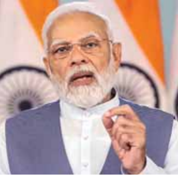
पायनियर समाचार सेवा। गाजियाबाद/नई दिल्ली

प्रधानमंत्री नरेन्द्र मोदी आज करेंगे साहिबाबाद-दुहाई खंड का उद्घाटन