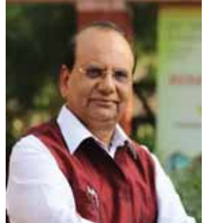
पायनियर समाचार सेवा। नई दिल्ली

● एयरोसिटी से तुगलकाबाद, जनकपुरी पश्चिम से आरके आश्रम, राहतगंज-रोशानारा रोड-पुलबंगश कॉरिडोर की बाधाएं दूर हुई