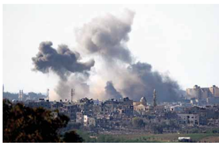
गाजा पट्टी में इजराइली हवाई हमले के बाद उठता धुआं।

इस संबंध में अमेरिका के राष्ट्रपति जो बाइडन ने कहा कि मिस्र के राष्ट्रपति गाजा पट्टी के लोगों तक मानवीय सहायता पहुंचाने के वास्ते 20 ट्रकों को अनुमति देने के लिए गाजा में अपनी सीमा को खोलने पर