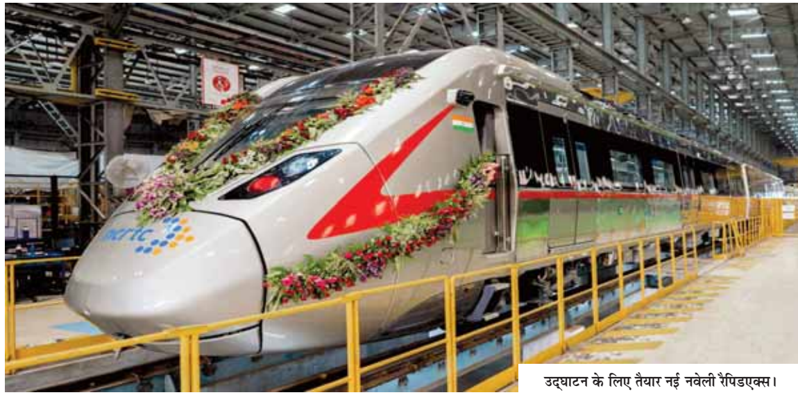
उद्घाटन के लिए तैयार नई नवेली रैपिडएक्स।