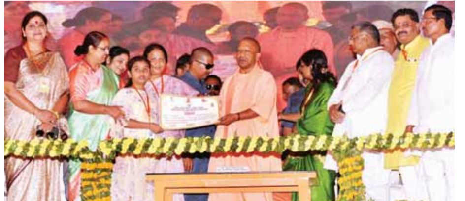
हाथरस में आयोजित नारी शक्ति वंदन महिला सम्मेलन में उप के मुख्यमंत्री योगी आदित्यनाथ ने 177.29 करोड़ लागत की 214 लोक-कल्याणकारी परियोजनाओं की दी।

उत्तर प्रदेश के मुख्यमंत्री योगी आदित्यनाथ ने बृहस्पतिवार को पिछले साढ़े नौ साल में देश में बदलाव आने और साढ़े छह साल में उत्तर प्रदेश में परिवर्तन आने का दावा करते हुए कहा, आज हम प्रधानमंत्री नरेंद्र मोदी के नेतृत्व में एक नया भारत देख रहे हैं। आज के भारत में, जाति, पंथ, धर्म, क्षेत्र, भाषा या लिंग के आधार पर किसी के साथ कोई भेदभाव नहीं है। हाथरस में आयोजित एक कार्यक्रम में