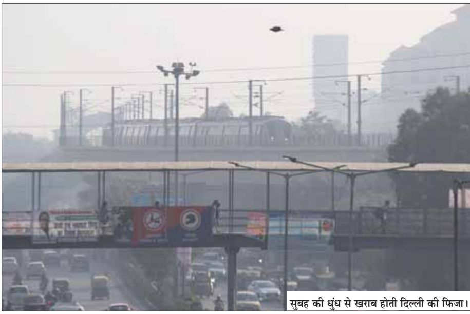
सुबह की धुंध से खराब होती दिल्ली की फिजा।

केंद्रीय वायु गुणवत्ता आयोग ने 23-24 अक्टूबर को एक्वआई बेहद खराब श्रेणी में रहने की जताई आशंका