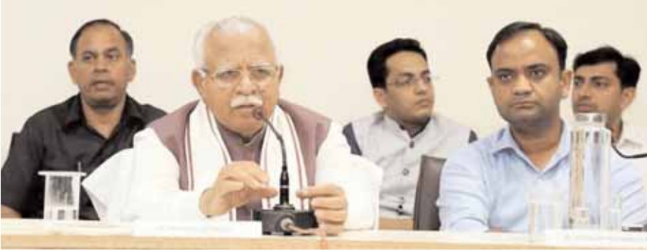
नूह में शांति समिति की बैठक में बोलते मुख्यमंत्री मनोहर लाल।

मुख्यमंत्री मनोहर लाल ने कहा कि मेवात क्षेत्र में 108 एकड़ में फैली कोटला झील को विकसित किया जाएगा। इसके अलावा केएमपी के साथ स्पेशल पाइप लाइन बिछाकर यमुना का पानी भी नूह जिले के लिए लाया जाएगा। उन्होंने कहा कि प्रधानमंत्री नरेंद्र मोदी ने नूह जिला को आकांक्षी जिला में शामिल करके इसे अन्य जिलों के बराबर खड़ा करने का संकल्प लिया है। शिक्षा, स्वास्थ्य, उद्योग, कृषि व कानून के अलावा हर मानदंड पर इस क्षेत्र को आगे ले जाने का कार्य किया जाएगा। वे नूह के लघु सचिवालय में शांति समिति की बैठक में बोल रहे थे।