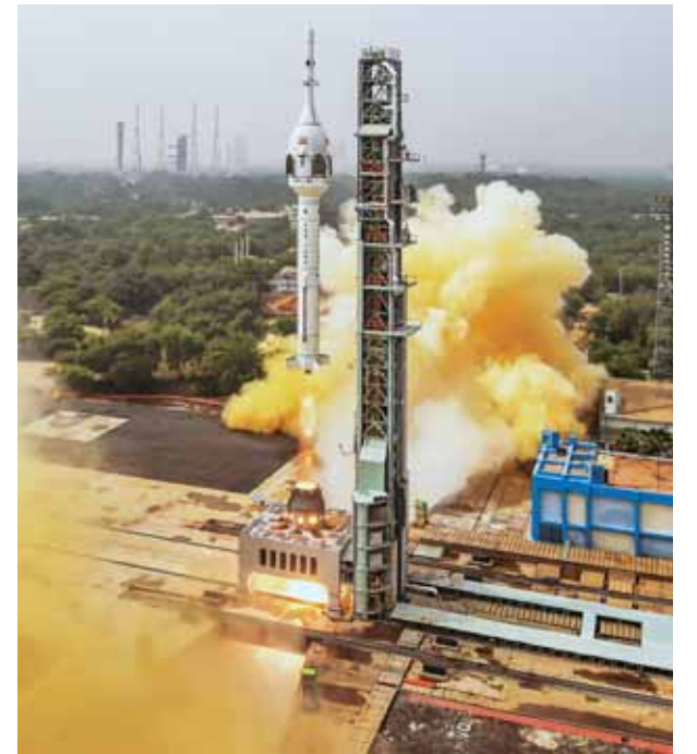
श्रीहरिकोटा से सफ्ट पर रवाना होता परीक्षण यान।

वैज्ञानिकों ने मिशन निष्फल होने की स्थिति में (अवॉर्ट सिचुएशन) टीवी-डी। परीक्षण यान से क्रू मांड्यूल (जिसमें अंतरिक्ष यात्री सवार होंगे) को बाहरी अंतरिक्ष में प्रक्षेपित करने के बाद वापस सुरक्षित लाने के लिए क्रू एस्केप सिस्टम यानी चालकदल बचाव प्रणाली (सीईएस) का परीक्षण किया। तय योजना के अनुसार, क्रू मांड्यूल और क्रू एस्केप सिस्टम नई दिल्ली और ओटावा में पारस्परिक राजनयिक उपस्थिति में समानता को वांछित बनाता है। इस साल जून (शेष पेज 9)