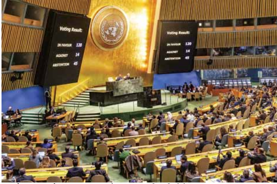
गाजा और इजराइल संघर्ष पर संयुक्त राष्ट्र महासभा में हुए मतदान का परिणाम डिजिटल होता हुआ।

दूसरी तरफ, भारतीय जनता पार्टी ने विपक्ष पर पलटवार करते हुए कहा कि सरकार ने सही कदम उठाया है और भारत कभी आतंकवाद के पक्ष में खड़ा नहीं हो सकता। भारत संयुक्त राष्ट्र महासभा में आम नागरिकों की सुरक्षा और कानूनी एवं मानवीय दायित्वों को कायम रखने शीर्षक वाले जॉर्डन के मसौदा प्रस्ताव पर मतदान से दूर रहा। इस प्रस्ताव में इजराइल-हमास युद्ध में तत्काल मानवीय संघर्ष-विराम और गाजा पट्टी में निर्बाध मानवीय पहुंच सुनिश्चित करने का आह्वान किया गया था। संयुक्त राष्ट्र की 193 सदस्य