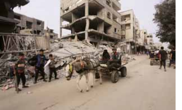
इजराइली बमबारी से बुरी तरह तबाह गाजा पट्टी का एक इलाका।

रियर एडमिरल डेनियल हैगरी ने शनिवार को कहा कि सेनाएं अब भी जमीन पर हैं और युद्ध जारी है। इससे पहले इजराइली सैनिक कुछ देर के लिए रात में जमीनी मार्ग से गाजा में गए थे और फिर लौट आए थे। इजराइली सेना ने शनिवार को एक वीडियो जारी किया था, जिसमें गाजा के खुले रेतीले इलाकों में बखरबंद वाहनों के काफिले धीरे-धीरे चलते नजर आ रहे थे। सेना ने कहा कि युद्धक विमानों ने दर्जनों हमास सुरांगों और भूमिगत बंकर को निशाना