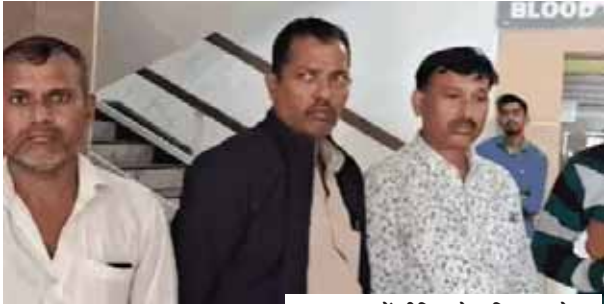
अस्पताल में पीड़िता के परिवार वाले।

सरेराह लूटपाट की और फिर फरार हो गया। 9 मुकदमे होने के बावजूद ये क्रिमिनल खुला घूम रहा था, इस पर भी पुलिस अफसरों ने नाराजगी जताई है। माना जा रहा है कि इस मामले में जल्द ही हल्का इंचार्ज दरोगा और बीट कांस्टेबल पर भी कार्रवाई हो सकती है। हापुड़ के