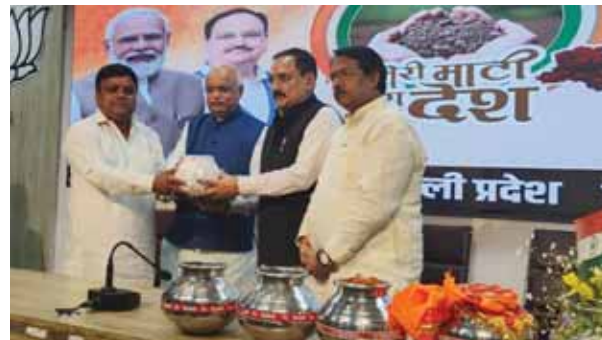
मेरी माटी मेरा देश का अभियान के समापन के दौरान प्रदेश अध्यक्ष सहदेवा व अन्य

इस प्रयास को कुछ लोग विभिन्नता का नाम देकर यह कहते हैं कि विभिन्नता से विभाजन की दुर्गंध आती है लेकिन हकीकत यह है कि विभिन्नता कभी विभाजन का आधार नहीं बन सकती। कार्यकर्ताओं के बीच विभिन्न भाषा होने के बावजूद उनकी सोच एक है। इस विभिन्नता के अंदर समाहित है एकता का स्वर।