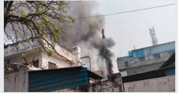
ट्रोनिका सिटी क्षेत्र की ड्राईफ्रूट पैकेजिंग फैक्ट्री में लगी आग।