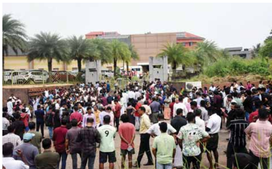
कोच्चि में प्रार्थना स्थल में हुए सिलसिलेवार धमाके के बाद इकट्ठा लोग।

कि ऐसा कोई भी व्यक्ति वर्तमान में उनके संगठन का हिस्सा नहीं है। विस्फोटों की जिम्मेदारी लेने वाले व्यक्ति ने कहा कि सभी को बम धमाकों और इसके बाद हुए गंभीर नतीजों के बारे में पता चल गया होगा। उसने वीडियो, जो अब सोशल मीडिया पर उपलब्ध नहीं है, में कहा, वहां क्या हुआ, मुझे ठीक-ठीक पता नहीं है, लेकिन मैं जानता हूँ कि यह (विस्फोट) हुआ और मैं इसकी पूरी जिम्मेदारी लेता हूँ। व्यक्ति ने कहा कि उसने लोगों को यह बताने के लिए वीडियो बनाया कि उसने यह निर्णय क्यों लिया। उसने इसे 'अच्छी तरह से सोचा-समझा' निर्णय बताया।