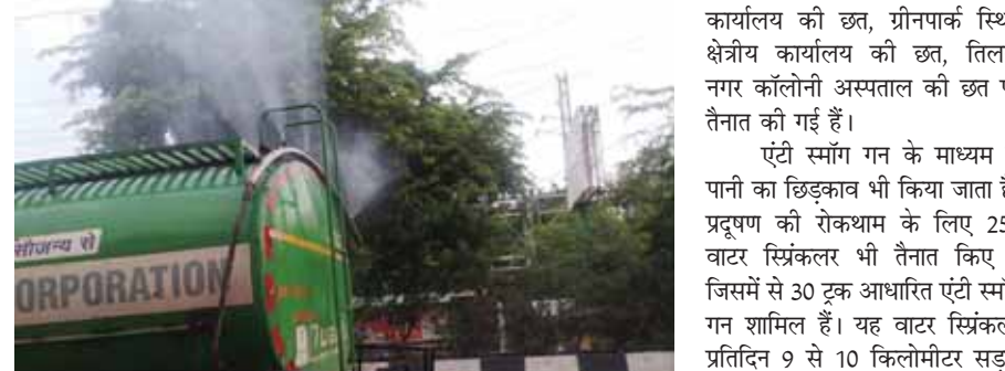
पानी का छिड़काव करती निगम की मशीन

सर्दी के मौसम से इतर गर्मी के मौसम में बाहरी से ज्यादा स्थानीय कारक सांस फुला रहे हैं। इस समस्या से निपटने के लिए दिल्ली नगर निगम शहर में प्रदूषण को रोकथाम के लिए अपना कार्यक्रम और मशीन तैनात कर दी है। निगम ने प्रदूषण के हॉटस्पॉट इत्यादि स्थानों पर तैनात की गई हैं। दिल्ली नगर निगम के पास 52