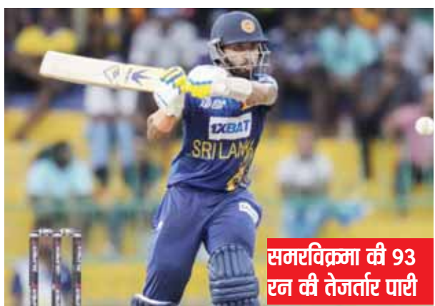
समरविक्रमा की 93 रन की तेजतार पारी