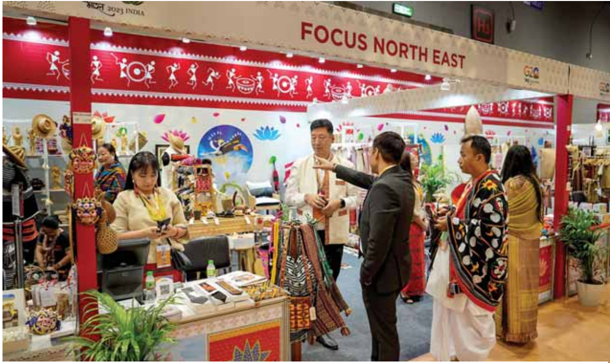
भारत मंडप में जी20 शिखर सम्मेलन के दौरान शिल्प बाजार में उत्तर-पूर्व भारत स्टॉल मेहमानों के लिए आकर्षण का केंद्र रहा।