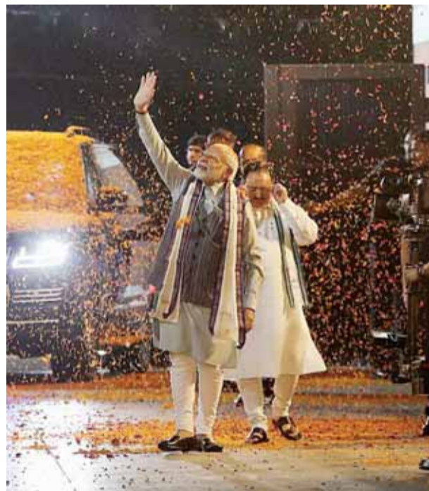
जी 20 के सफल आयोजन के बाद भाजपा मुख्यालय में प्रधानमंत्री नरेंद्र मोदी के आगमन पृष्ठ वर्षा कर स्वागत करते कार्यकर्ता

जी-20 शिखर सम्मेलन के सफल आयोजन के बाद पहली बार प्रधानमंत्री नरेंद्र मोदी बुधवार को भाजपा मुख्यालय पहुंचे जहां कार्यकर्ताओं ने उन पर फूलों की बारिश की और मोदी-मोदी के नारे लगाए। प्रधानमंत्री ने भी कार्यकर्ताओं और पार्टियों नेताओं का अभिवादन किया। यहां पार्टी अध्यक्ष जेपी नड्डा ने उनका स्वागत किया।