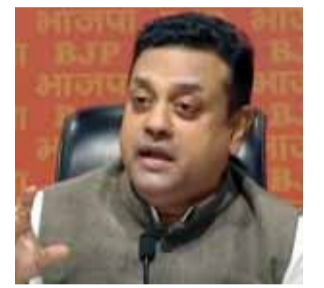
पायनियर समाचार सेवा। नई दिल्ली

● विपक्षी नेता सनातन धर्म पर हमला करने की योजना पर काम कर रहे हैं और अपमानजनक टिप्पणियां कर रहे हैं: पात्रा