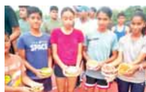
से उपलब्ध खाद्यान्नों से शरीर में पोषक तत्वों की कमी दूर की जा सकती है। उन्होंने बताया कि अंकुरित मूंग दाल, चना व अन्य सबुत अनाज प्रोटीन व अन्य पोषक तत्वों के अच्छे स्रोत हैं। दौलताबाद आवासीय अकादमी व नर्सरी में प्रशिक्षु खिलाड़ियों को अंकुरित दालों व सबुत अनाज की महत्ता के बारे में विस्तार से जानकारी दी गई।