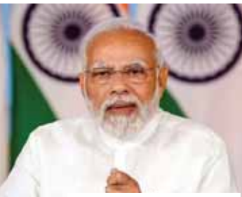
प्रधानमंत्री नरेंद्र मोदी पायनियर समाचार सेवा। नई दिल्ली

जी-20 सुरक्षा में योगदान देने वालों का सम्मान भारत मंडपम में होगा, पुलिस आयुक्त ने हर जिले के कांस्टेबलों और इंस्पेक्टरों की मांगी सूची