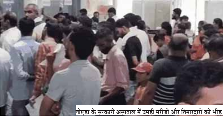
नोएडा के सरकारी अस्पताल में उमड़ी मरीजों और निमागदारां की भीड़।

यहां अब तक 432 केस मिल चुके हैं। हेथ्य टीमों ने 7449 घघों के सर्वे किया है। इस दौरान 141 घर ऐसे मिले, जहां एडीज लार्वा मिला है। 131 अगस्त को एक युवा कारोबारी की डेंगू से मौत हुई थी। 2 दिन पहले एक और महिला की मौत हुई। हालांकि, स्वास्थ्य विभाग ने जांच के बाद ये दावा किया कि महिला की मौत डेंगू नहीं, किसी अन्य बीमारी की वजह से