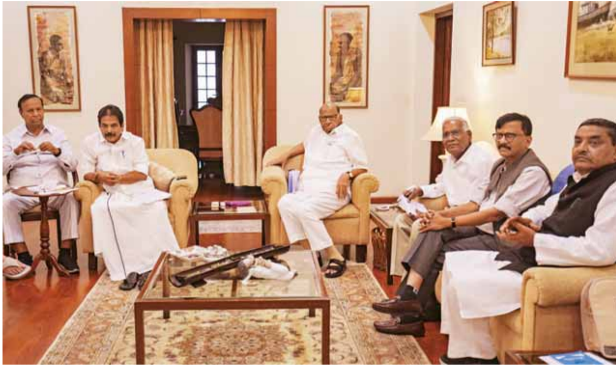
राजधानी दिल्ली में एनसीपी प्रमुख शरद पवार के आवास पर आयोजित इंडिया गठबंधन समन्वय समिति की पहली बैठक में विपक्षी दलों के प्रमुख नेता।