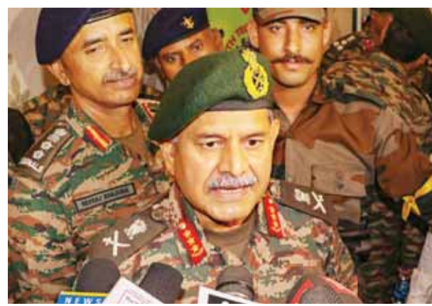
मुठभेड़ के बारे में प्रकारी को जानकारी देते सेना के वरिष्ठ अधिकारी