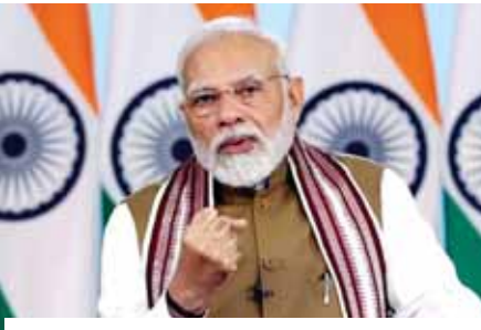
प्रधानमंत्री नरेंद्र मोदी

आईआईसीसी को व्यापार और उद्योग को आकर्षित करने के मकसद से बैठकों, प्रोत्साहनों, सम्मेलनों और प्रदर्शनीयों (एमआईसीई) गतिविधियों को बढ़ावा देने के लिए एक आधुनिक केंद्र के रूप में विकसित किया जा रहा है। परियोजना को दो चरणों में विकसित किया जा रहा है। पहले चरण में एक सम्मेलन केंद्र और संबंधित सुविधाओं