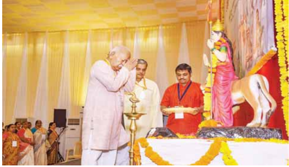
पुणे में आरएसएस की अखिल भारतीय समन्वय बैठक के दौरान सरसंचालक मोहन भागवत