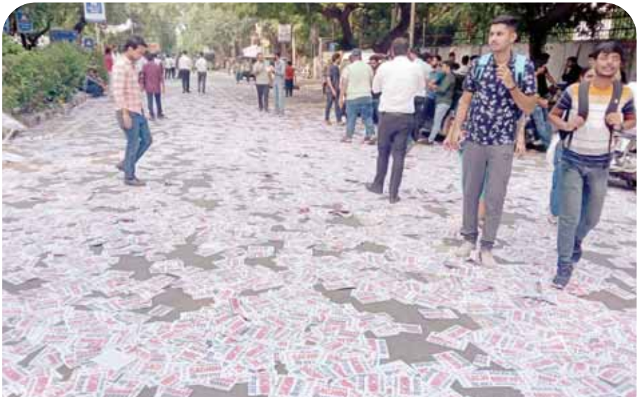
22 सितंबर को होने वाले दिल्ली विश्वविद्यालय छात्र संघ चुनाव को लेकर पोस्टरों से पटा कॉलेज परिसर।

कोकरनाग क्षेत्र के ऊंचे इलाकों में बुधवार को आतंकवादियों के साथ मुठभेड़ में एक बटालियन के कर्मांडर कर्नल, एक मेजर समेत तीन सैन्यकर्मी और जम्मू-कश्मीर पुलिस के एक पुलिस उपाधीक्षक की मौत हो गई थी, जबकि एक सैनिक लापता है। सिंह ने कहा, मैं मांग करता हूँ कि सरकार (शहीद एवं लापता जवानों के) परिवारों का ख्याल रखे।