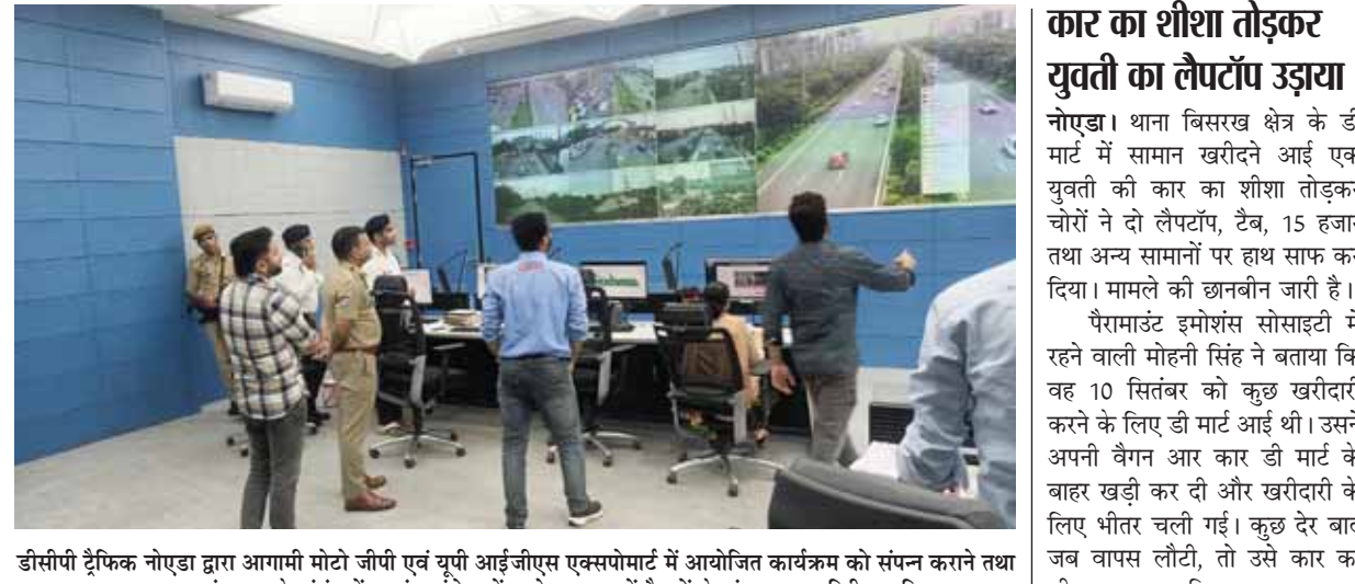
डीसीपी टैफिक नोएडा द्वारा आगामी मोटो जीपी एवं यूपी आईजीएस एक्सपोमार्ट में आयोजित कार्यक्रम को संपन्न कराने तथा सुगम यातायात संचालन के संबंध में कमांड कंट्रोल सेंटर सेक्टर-94 में कैमरों के संचालन का निरीक्षण किया।