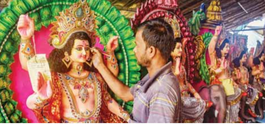
विश्वकर्मा पूजा के लिए भगवान विश्वकर्मा की मुर्ति को अंतिम रूप देना कलाकार

राज्यपाल ने उन्हें राज्य विधानसभा में बहुमत साबित करने के लिए कहा था, जिसके बाद उन्होंने यह फैसला किया था। पिछले साल जुलाई में, शिंदे नीत सरकार ने औरंगाबाद और उस्मानाबाद शहरों का नाम बदलकर क्रमशः छत्रपति संभाजीनगर और धाराशिव करने को कैबिनेट की मंजूरी दे दी थी। एमवीए सरकार की आखिरी कैबिनेट बैठक में औरंगाबाद का नाम बदलकर संभाजीनगर कर दिया गया, लेकिन शिंदे सरकार ने इसके आगे छत्रपति भी जोड़ दिया। शिंदे के नेतृत्व वाली शिवसेना, भारतीय जनता पार्टी (भाजपा) और अजित पवार के नेतृत्व वाले राष्ट्रवादी कांग्रेस पार्टी (राकांपा) गुट की वर्तमान सरकार ने हर साल 17 सितंबर को मनाए जाने वाले मराठवाड़ा मुक्ति दिवस की 75वीं वर्षगांठ मनाने के लिए शनिवार को छत्रपति संभाजीनगर में एक विशेष कैबिनेट बैठक की।