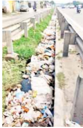
गुरुग्राम एनएच-48 पर नरसिंहपुर के पास गंदगी से अटा नाला।

हाइवे किनारे नरसिंहपुर गांव से लेकर राजीव चौक से पहले ओमनगर तक नाले के हालात बहुत खराब हैं। इसी तरह से राजीव चौक से खेडकौदीला टोल तक आते समय भी नाले के हालात बुरे हैं। गंदगी से दोनों तरफ से अटे नाले प्रशासन के दावों की पोल खोल रहे हैं। कहने को तो बरसात के समय नाले की जेसीबी से सफाई करके गंदगी निकाली जाती है, लेकिन इसका कोई स्थायी समाधान