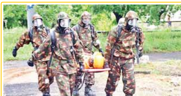
गुरुग्राम के नयागांव में इंडियन ऑयल के एलपीजी प्लांट में गैस पाइप लाइन रिसाव की माॅकड्रिल के दौरान बचाव का कार्य करते एनडीआरएफ के सदस्य।

जिला प्रशासन व राष्ट्रीय एनडीआरएफ (नेशनल डिजास्टर रिसपॉन्स फोर्स) द्वारा थॉडसी क्षेत्र के नयागांव स्थित इंडियन ऑयल के एलपीजी बॉयलिंग प्लांट में गैस पाइप लाइन रिसाव को लेकर माॅक ड्रिल की गई। आपातकालीन दुरुस्त्या की स्थिति में आपातकालीन तैयारी की जांच किए जाने के लिए यह ऑफ साइट इमरजेंसी ड्रिल थी। इस माॅक ड्रिल में एनडीआरएफ की टीम ने पाइप लाइन गैस रिसाव होने की स्थिति में वहां पर फसे लोगों