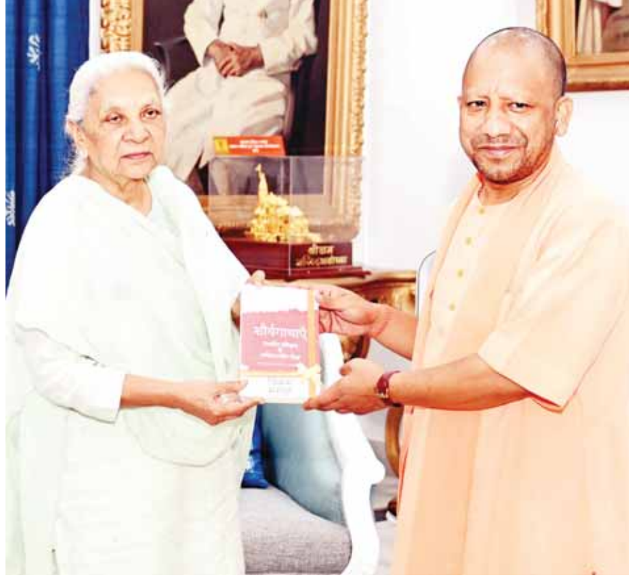
मुख्यमंत्री योगी आदित्यनाथ ने शनिवार को राजभवन में राज्यपाल आनंदीबेन पटेल से की शिराधार बैठक

एवं आईजीआरएस तथा सीएम हेल्पलाइन की मासिक रैंकिंग की समीक्षा करते हुए जिलाधिकारियों को निर्देशित किया। उन्होंने कहा कि जिलों में हर स्तर पर जनसुनवाई प्रत्येक कार्य दिवस पर होना सुनिश्चित किया जाए। डीएम, एडीएम, तहसीलों पर एसडीएम, पुलिस कप्तान, सीओ और एसीपी अपने अपने कार्यालय में हर रोज जनसुनवाई करेंगे। मुख्यमंत्री ने कहा कि तहसील और थानों की कार्यप्रणाली को और सुधारने की आवश्यकता है। उन्होंने विशेष रूप से कहा कि सुनवाई के दौरान जनता के साथ दुर्व्यवहार अस्वीकार्य है। ऐसा करने वाले अधिकारियों के खिलाफ सख्त कार्रवाई की जाए। मामलों का निस्तारण तय समयसीमा में होना चाहिए, इसके लिए जिलाधिकारी मैकेनिज्म तैयार करें। भू माफिया और खनन माफिया के खिलाफ कठोर कार्रवाई धीमी ना होने पाए।