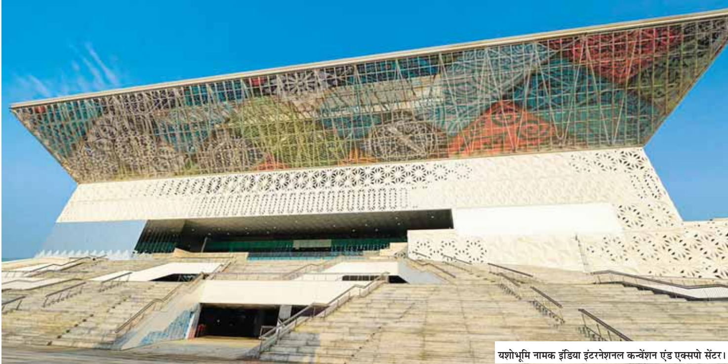
यशोभूमि नामक इंडिया इंटरनेशनल कन्वेंशन एंड एक्सपो सेंटर।

वहीं इसे द्वारका एक्सप्रेसवे और छह लेन की अर्बन एक्सप्रेस रोड भी सीधे तौर पर जोड़ने की दिशा में काम चल रहा है। इसके अलावा इसके 10 किलोमीटर के दायरे में इंटरनेशनल एयरपोर्ट, एयरपोर्ट एक्सप्रेस लाइन और बड़ी संख्या में फाइव स्टार होटल हैं। मौजूदा स्थिति में इस क्षेत्र में उपलब्ध 3500 से अधिक कमरों के अलावा लगभग इतने ही और बनाए जाने का अनुमान है।