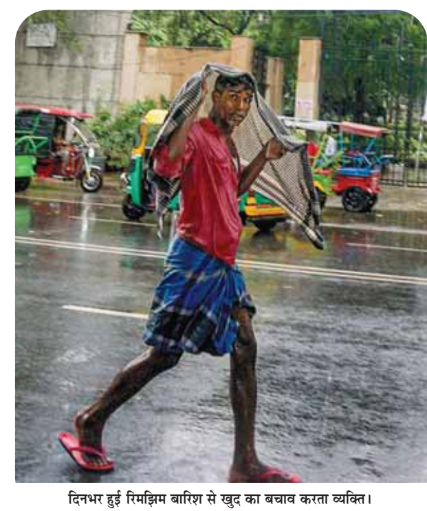
दिवर भुइँ रिमाइंग बारिश से खुद का बचाव करता व्यक्ति।

फोरडा ने केंद्रीय स्वास्थ्य मंत्री को लिखा पत्र नई दिल्ली। फेडरेशन ऑफ रजिटेड डॉक्टर्स एसोसिएशन (फोरडा) ने शुक्रवार को केंद्रीय स्वास्थ्य मंत्री मनसुख मांडवीया को एक पत्र लिखा है। इस पत्र में उसने नीट-पीजी, 2023 परीक्षा के लिए कट-ऑफ अंकों में कमी पर विचार करने का अनुरोध किया है। फोरडा ने पत्र में कहा, पिछले वर्षों में, हमने नीट-पीजी के लिए कई दौर की काउंसिलिंग के बाद भी देश भर के मेडिकल संस्थानों में खाली सीटों के रूप में लगातार एक चुनौती देखी है। यह न केवल स्वास्थ्य सेवा प्रणाली के लिए बल्कि उन महत्वाकांक्षी चिकित्सा पेशेवरों के लिए भी बड़ी चिंता का विषय है, जो हमारे देश के स्वास्थ्य सेवा बुनियादी ढांचे में योगदान करने के लिए उत्सुक हैं। फेडरेशन ऑफ रजिटेड डॉक्टर्स एसोसिएशन ने पत्र में कहा, इस मुद्दे के आलोक में वह विनम्रतापूर्वक अनुरोध करते हैं कि नीट-पीजी 2023 परीक्षा के लिए कट-ऑफ अंक कम करने की संभावना पर विचार करें।