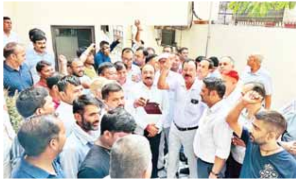
गुरुग्राम में विधायक सुधीर सिंगला से मिलने पहुंचे वेंडर्स।

पंचायत भवन में वेंडर्स की दुकानों में तोड़फोड़ को लेकर वेंडर्स ने विधायक सुधीर सिंगला से मुलाकात की। इस दौरान वेंडर्स ने अपनी समस्या विधायक के समक्ष रखी। विधायक ने मौके पर ही मंत्री से बात की और तोड़फोड़ रुकवाई। पंचायत भवन परिसर में काफी वेंडर, टाइपिस्ट हैं। यहां बनी दुकानों में पिछले कुछ दिनों से तोड़फोड़ की कार्रवाई प्रशासन द्वारा की जा रही है। इससे वेंडर्स का काम प्रभावित हो रहा