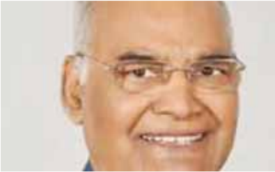
भुवनेश्वर

देश में एक साथ चुनाव कराने पर गौर करने और सिफारिशें करने के लिए उच्च स्तरीय समिति के प्रमुख पूर्व राष्ट्रपति रामनाथ कोविंद ने कहा कि समिति की पहली बैठक 23 सितंबर को होगी। सरकार ने दो सितंबर को लोकसभा, राज्य विधानसभाओं, नगर पालिकाओं और पंचायतों के एक साथ चुनाव कराने की संभावना पर गौर करने और सिफारिश करने के लिए आठ सदस्यीय समिति को अधिसूचित किया था। कोविंद ने शनिवार को यहां संवाददाताओं से कहा, पहली बैठक 23 सितंबर को होगी। वह एक निजी विश्वविद्यालय के दीक्षांत समारोह में भाग लेने के लिए भुवनेश्वर में थे।