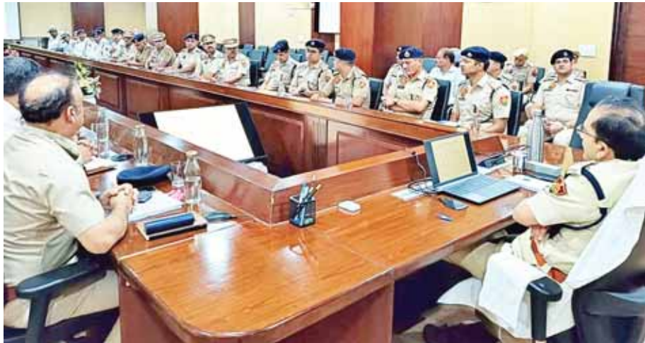
गुरुग्राम में यातायात पुलिस अधिकारियों, कर्मचारियों की बैठक लेते पुलिस आयुक्त विकास कुमार यादव।

ट्रेफिक एंड रोड सेफ्टी रिव्यू मीटिंग में डीसीपी यातायात विवेन्द्र विज, ट्रेफिक विंग के सभी एसपी, टीआई, एसएचओ, टीपीएस, टीपीएस केएमपी समेत अन्य पुलिस अधिकारियों/ कर्मचारियों से यातायात के सुगम व व्यवस्थित संचालन में आने वाली समस्याओं के बारे में विस्तार से बात की गई। पुलिस आयुक्त ने अधिक यातायात वाले स्थानों को चिह्नित करने तथा उन स्थानों पर यातायात जाम के कारणों का पता लगाकर उनका निवारण करने के आदेश दिए। बैठक में यातायात पुलिस ने मुद्दा उठाया कि चालान के समय लोग ऑनलाइन/व्युआर कोड से जैसे पेटीएम, फोन पे समेत अन्य माध्यम से पेमेंट करने की कहते हैं। चालान मशीन में यह सुविधा नहीं होने के कारण ऑनलाइन पेमेंट नहीं हो पा रही। जन सुविधा को ध्यान में रखते हुए पुलिस