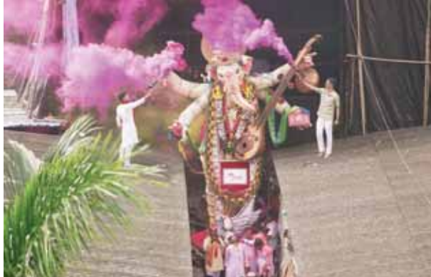
मगवान गणेश को विसर्जन के साथ विदा करते मगवान

मंत्रालय ने हैदराबाद...आदि स्थानों में और इकाइयों को मंजूरी दी। और लोग इन वीजा पर काम कर सकते हैं। हमने अपनी प्रणाली में बदलाव किया, हमने कड़ी मेहनत की और इस वर्ष दस लाख आरजन वीजा आवेदकों के निपटारे का लक्ष्य पा लिया। उन्होंने कहा, भारत के साथ हमारी साझेदारी अमेरिका के अहम द्विपक्षीय संबंधों में से एक है... भ्रमण यह तो दुनिया के सबसे अहम संबंधों में से एक है। हमारे लोगों के बीच संबंध पहले से कहीं अधिक मजबूत हैं, हम आने वाले महीनों में अधिक से अधिक भारतीय आवेदकों को अमेरिका की यात्रा करने और अमेरिका-भारत मित्रता का प्रत्यक्ष अनुभव करने का अवसर देने के लिए वीजा कार्य जारी रखेंगे। मिशन ने पहले ही 2022 में निपटारा गए मामलों की कुल संख्या को पार कर लिया है और 2019 में कोविड महामारी से पहले की तुलना में लगभग 20 प्रतिशत अधिक आवेदनों पर कार्यवाही कर रहा है।