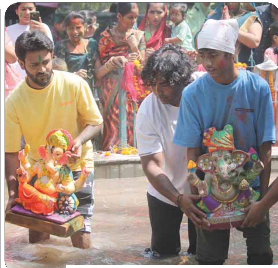
कृत्रिम तालाब में भगवान गणेश की मूर्ति विसर्जित करते श्रद्धालु।

गुगल प्ले स्टोर से ऐप डाउनलोड करें। ऐप खोलें। छात्र या शिक्षक आईडी का उपयोग करके पंजीकरण करें। उपयोगकर्ता के प्रकार का चयन करने के लिए ड्रॉपडाउन से लॉगिन प्रकार पर क्लिक करें। पंजीकृत मोबाइल नंबर पर भेजा गया ओटीपी दर्ज करें। एक डैशबोर्ड दिखाई देगा। नई शिकायत या प्रश्न दर्ज करने के लिए नए मुद्दे पर क्लिक करें। फोटो के साथ शीर्षक और विवरण दर्ज करें और सबमिट करें। शिकायतों की स्थिति और पिछली शिकायतों/प्रश्नों को देखने के लिए पिछले अंक पर क्लिक करें।