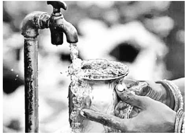
पायनियर समाचार सेवा। फरीदाबाद

एसजीएम नगर में पेयजल से जुड़ रहे लोगों के लिए राहत की खबर है। नगर निगम ज्यादा पेयजल प्रभावित क्षेत्रों में ट्यूबवेल लगाने का रहा है। निगम बड़खल विधानसभा में करीब 39 ट्यूबवेल लगवाने जा रहा है। इस पर करीब 406.20 लाख रुपये खर्च होंगे। शहर में पेयजल की सप्लाई यमुना