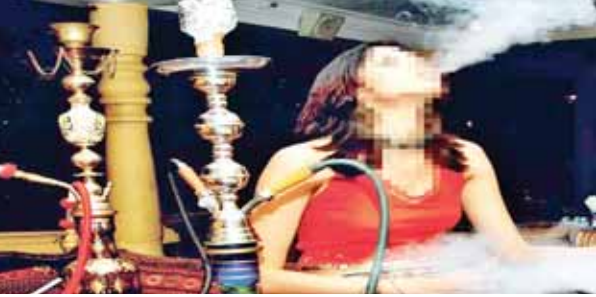
हुक्का बार में हुक्का पीती एक युवती। सांकेतिक तस्वीर।

नशीली चीजों की बिक्री पर प्रतिबंध के लिए प्रदेश सरकार की ओर से कार्रवाई की जा रही है। सरकार नशा ना करने के प्रति जहाँ जागरूकता अभियान चला रही है, वहीं नशा बेचने वालों के खिलाफ सख्ती भी दिखा रही है। इस कड़ी में