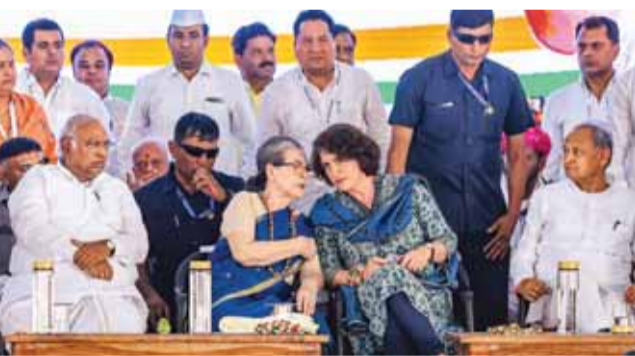
जयपुर में एक जनसभा के दौरान कांग्रेस अध्यक्ष मल्लिकार्जुन खड़गे, पार्टी नेता सोनिया गांधी, पीठिका गांधी और अशोक गहलोत के साथ।

कांग्रेस ने शनिवार को प्रधानमंत्री नरेंद्र मोदी पर देश की गरिमा और लोकतंत्र को तार-तार करने का आरोप लगाया और दावा किया कि विपक्षी नेताओं को भाजपा में शामिल होने के लिए मजबूर करने के लिए विभिन्न हथकण्डे अपनाए जा रहे हैं। 2024 के लोकसभा चुनावों के लिए अपनी पहली चुनावी रैली को संबोधित करते हुए, सबसे लंबे समय तक सेवा करने वाली पार्टी अध्यक्ष सोनिया गांधी ने दावा किया कि पिछले 10 वर्षों से, देश एक ऐसी सरकार के हाथों में है जिसने संकट और असमानता, बेरोजगारी, मुद्रास्फूर्ति, आर्थिक वृद्धि को बढ़ावा देने में कोई कसर नहीं छोड़ी। सोनिया ने कहा, आज हमारे देश का