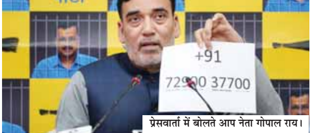
प्रसवार्ता में बोलते आप नेता गोपाल राय।