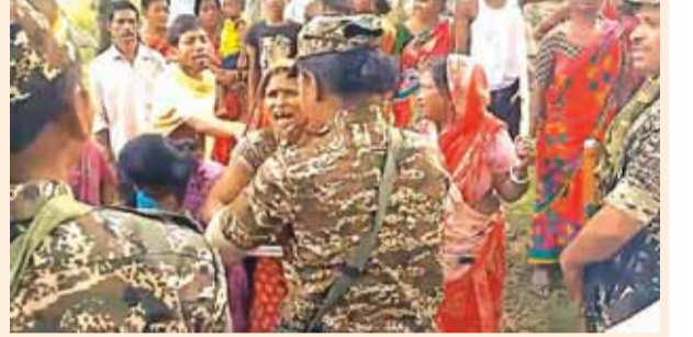
पश्चिम बंगाल के पूर्वी मेदिनीपुर में सुरक्षा बलों के साथ बहस करते ग्रामीण।

राष्ट्रीय अन्वेषण अधिकरण (एनआईए) ने पश्चिम बंगाल के पूर्वी मेदिनीपुर जिले में भीड़ की ओर से जांच एजेंसी की टीम पर हमला किए जाने के बीच 2022 के विस्फोट मामले में शनिवार को दो प्रमुख साजिशकर्ताओं को गिरफ्तार किया।