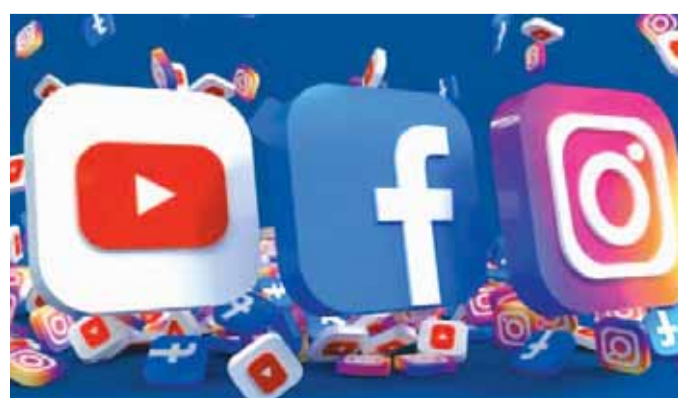
22,640 मतदान केंद्रों के पार्टी कार्यकर्ताओं के साथ बातचीत की। उन्होंने भाजपा वृथ कार्यकर्ताओं को सोशल मीडिया की ताकत का उपयोग करने की सलाह दी।