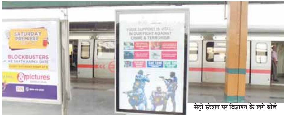
मेट्रो स्टेशन पर विज्ञापन के लगे बोर्ड

दिल्ली मेट्रो रेल कॉरपोरेशन ने शनिवार को कहा कि उसके नेटवर्क पर 60 से अधिक स्टेशनों की सह-ब्रांडिंग प्रतिष्ठित कॉरपोरेट,