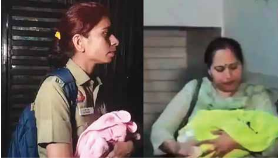
नई दिल्ली में ऑपरेशन के दौरान सीबीआई अधिकारियों ने केरापुरम रिहत एक मकान से दो नवजातों को बचाया।

केंद्रीय जांच ब्यूरो (सीबीआई) ने सोशल मीडिया विज्ञापनों के साथ-साथ अन्य अवैध उद्देश्यों के लिए भारत भर में शिशुओं को खरीदने और बेचने में शामिल तस्करी के एक नेटवर्क का भंडाफोड़ किया है। सीबीआई ने कहा कि उसने राष्ट्रीय राजधानी क्षेत्र में कई स्थानों पर छापेमारी की और तीन बच्चों को बचाया, जबकि इस संबंध में सात आरोपियों को गिरफ्तार किया। सीबीआई सूत्रों ने कहा, नवजात शिशुओं को काले बाजार में वस्तुओं के रूप में खरीदा और बेचा जा रहा था। बच्चों को बेचने और खरीदने में कथित तौर पर शामिल महिलाओं और एक अस्पताल कर्मचारी सहित सात लोगों को सीबीआई ने गिरफ्तार किया है और उनसे पूछताछ की जा रही है। सीबीआई फिलहाल इसमें शामिल सभी पक्षों से पूछताछ कर रही है, जिसमें बच्चों को बेचने वाली महिला और खुद खरीदने वाले दोनों शामिल हैं।