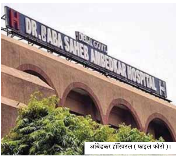
आंबेडकर हॉस्पिटल ( फाइल फोटो )।

उपराज्यपाल विनय कुमार सक्सेना ने यौन उत्पीड़न के आरोपी मेडिकल कॉलेज के सहायक प्रोफेसर को तत्काल निलंबित करने के प्रस्ताव को मंजूरी दे दी है। मुख्यमंत्री अरविंद केजरीवाल के जेल में होने की वजह से प्रशासनिक और शासन व्यवस्था में आई रुकावट के बावजूद, एलजी ने डॉ. बीएसए अस्पताल में हुए कथित यौन उत्पीड़न मामले के कथित आरोपी, सहायक प्रोफेसर के खिलाफ कार्रवाई करने की सहमति दे दी है। उपराज्यपाल कार्यालय के अनुसार, इस तरह के मामलों में अनुशासनात्मक कार्रवाई केवल राष्ट्रीय राजधानी सिविल सेवा प्राधिकरण द्वारा ही की जा सकती है और उपराज्यपाल के इसके लिए सक्षम नहीं होने के बावजूद, उन्होंने छात्राओं के लिए खतरनाक वातावरण और एनसीसीएसए के अध्यक्ष मुख्यमंत्री के न्यायिक हिरासत में होने की विपरीत परिस्थितियों को देखते हुए, मामले के कथित आरोपी,