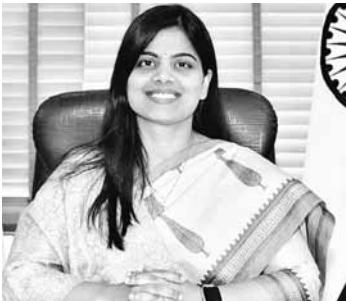
मतदाता अपने वोटर कार्ड की डिजीटल कॉपी डाउनलोड भी कर सकते हैं। इसके साथ-साथ मतदाता से जुड़ी सभी आवश्यक जानकारी भी इस एप से प्राप्त की जा सकती

इसके अलावा नए मतदाता ऑनलाइन माध्यम से भी अपनी वोट बनवाने के लिए एप्लॉड कर सकते हैं। ऑनलाइन वोट बनवाने के लिए नागरिक वोटर हेल्पलाइन एंड्रॉयड मोबाइल ऐप तथा चुनाव आयोग के पोर्टल पर अपना आवेदन कर सकते हैं। यही नहीं इस ऐप या पोर्टल के माध्यम से मतदाता पहले से बनी हुई अपनी वोट की जानकारी प्राप्त कर सकता है और नए