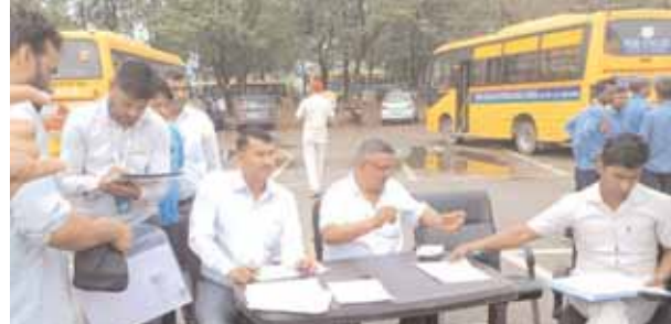
दो दिवसीय स्कूलों की बसों की जांच के दूसरे दिन कागजात जांचते अधिकारी।

जिला की स्कूल बसों की चेकिंग का कार्य दूसरे दिन रविवार को भी दिनभर जारी रहा। बच्चों को सुरक्षित स्कूल वाहन उपलब्ध कराने के उद्देश्य से जिला में पांच स्थानों पर स्कूली बसों का सघन जांच अभियान चलाया गया। रविवार को 143 स्कूलों की 1260 बसों का निरीक्षण किया गया। इनमें से 406 बसों का चालान किया गया और तीन को जब्त किया गया है। डीसी निशांत कुमार यादव और पुलिस आयुक्त विकास अरोड़ा की निगरानी में इस अभियान के तहत रविवार को जिला में बसों की जांच की गई। डीसी निशांत कुमार यादव ने कहा कि यह अभियान निरंतर जारी रहेगा। स्कूली विद्यार्थियों की सुरक्षा के