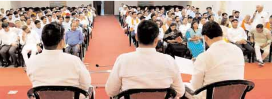
गुरुग्राम भाजपा कार्यालय में संगठनात्मक बैठक में मौजूद पदाधिकारी।