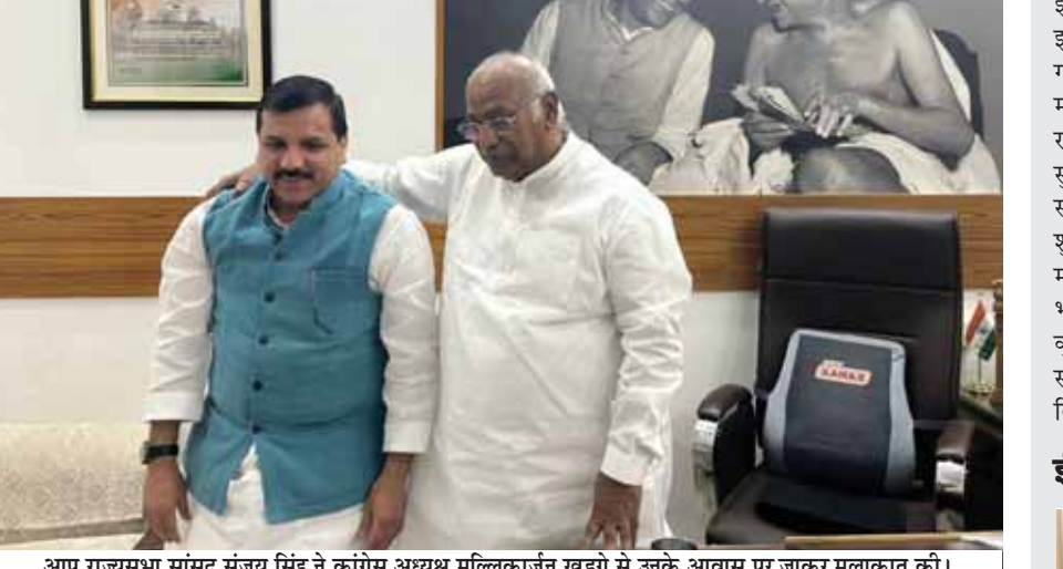
आप राज्यसभा सांसद संजय सिंह ने कांग्रेस अध्यक्ष मल्लिकार्जुन खड़गे से उनके आवास पर जाकर मुलाकात की।

दिल्ली में कथित आबकारी नीति घोटाळे से जुड़े धनशोधन मामले में प्रवर्तन निदेशालय (ईडी) द्वारा गिरफ्तारी के बाद केजरीवाल तिहाड़ जेल में बंद हैं। आप के राज्यसभा सदस्य ने कहा कि संसद के उच्च सदन में विपक्ष के नेता के रूप में, खरगे हमारा समर्थन करते रहे हैं और इसलिए मैं जेल से रिहा होने के बाद उनसे मिलना चाहता था। उन्होंने कहा, बैंक के दौरान कई मुद्दों पर चर्चा हुई। हमने