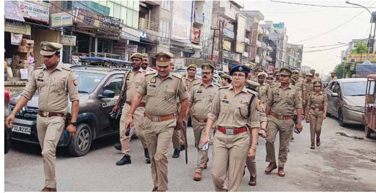
लोकसभा चुनावों को लेकर नोएडा पुलिस सतर्क है। सुरक्षा व्यवस्था का जायजा लेने के लिए एसएचओ फेस-2 ने भंगेल में पैदल मार्च किया।

साथ दुष्कर्म का प्रयास किया। इस बीच आरोपी ने बच्ची को गंदी वीडियो भी दिखाई। इसके बाद आरोपी बच्ची को लहलुहान अवस्था में छोड़कर फरार हो गया। घटना के शिकायत पर पुलिस ने बच्ची का मेडिकल कराया और आरोपी को खिलाफ मुकदमा दर्ज कर उसकी तलाश शुरू कर दी। इस संबंध में पुलिस का कहना है कि घटना के बाद से पुलिस आरोपी की तलाश में जुटी थी। इस बीच आरोपी पर 25 हजार रुपये का इनाम घोषित किया गया। जांच कर रही टीम ने शनिवार को आरोपी भंडारा खिलाने के बहाने बच्ची को अपने साथ कमरे पर ले गया। आरोपी ने वहां से बच्ची के