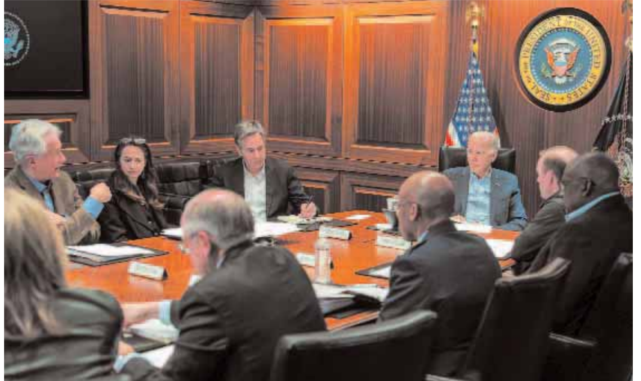
सुरक्षा अधिकारियों से चर्चा करते अमेरिका के राष्ट्रपति जो बाइडन