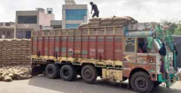
सोहना अनाज मंडी में सरसों से भरे कट्टों का उठाव कार्य में आई तेजी।