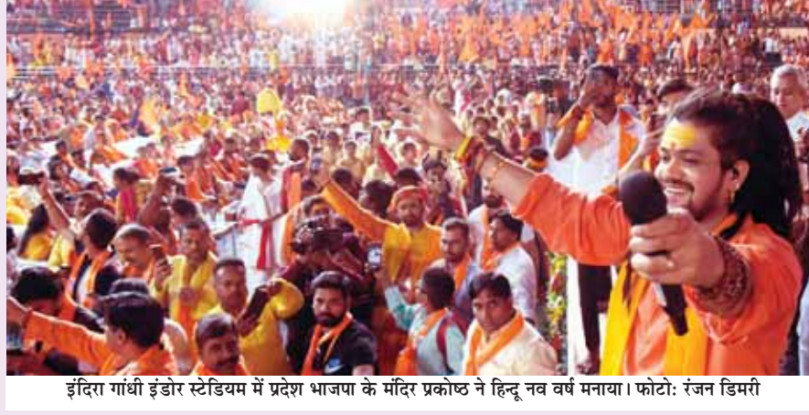
इंदिरा गांधी इंडोर स्टेडियम में प्रदेश भाजपा के मंदिर प्रकोष्ठ ने हिन्दू नव वर्ष मनाया।

राजधानी दिल्ली में खचाखच भरे इंदिरा गांधी इंडोर स्टेडियम में अयोध्या जैसा माहौल दिखा। चुनावी मौसम में प्रदेश भाजपा के मंदिर प्रकोष्ठ ने रविवार को हजारों लोगों के साथ हिन्दू नव वर्ष मनाया। स्टेडियम में बने मंच पर राजनेता और संत, महामंडलेश्वर एक साथ दिखे। लोगों ने यहां पर सामूहिक हनुमान चालीसा का पाठ करते हुए भगवा झंडा लहराया। वहीं जानेमाने भजन गायक हंसराज रघुवंशी के भजनों से पूरा वातावरण भक्तिमय हो गया।