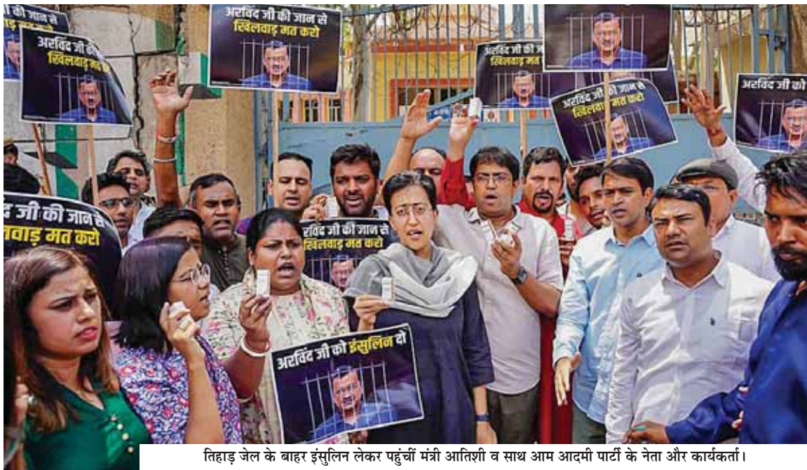
तिहाड़ जेल के बाहर इंसुलिन लेकर पहुंची मंत्री आतिशी व साथ आम आदमी पार्टी के नेता और कार्यकर्ता।

कैबिनेट मंत्री आतिशी समेत अन्य नेता अरविंद केजरीवाल के लिए दिल्ली के लोगों द्वारा भेजी गई इंसुलिन के इंजेक्शन लेकर पहुंचे थे। आतिशी ने जेल के बाहर मौजूद अधिकारियों को इंसुलिन देने की कोशिश की, लेकिन उन्होंने नहीं ली। इस पर आतिशी ने कहा कि दिल्ली की जनता को अपने मुख्यमंत्री की सेहत को लेकर चिंता है। इसलिए उन्होंने अरविंद केजरीवाल के लिए इंसुलिन भेजी है। लेकिन जेल अधिकारियों ने इंसुलिन लेने से इंकार कर दिया। उन्होंने आरोप लगाया कि भाजपा इंसुलिन को रोक कर अरविंद केजरीवाल की जान को खतरने में रखने की साजिश कर रही है। इस दौरान 'आप' नेता हाथों में 'अरविंद केजरीवाल को इंसुलिन दो और अरविंद केजरीवाल की जान से खिलवाड़ मत करो' लिखी तख्तियां, पोस्टर और बैनर लेकर पहुंचे थे। आतिशी ने कहा कि अरविंद केजरीवाल का शुगर लेवल लगातार ज्यादा स्तर पर बना हुआ है। इससे किडनी, लीवर, आंखों समेत नर्वस सिस्टम पर असर पड़ता है। आतिशी ने एक प्रश्न का जवाब देते हुए कहा कि दिल्ली सरकार के वकील को कोर्ट में