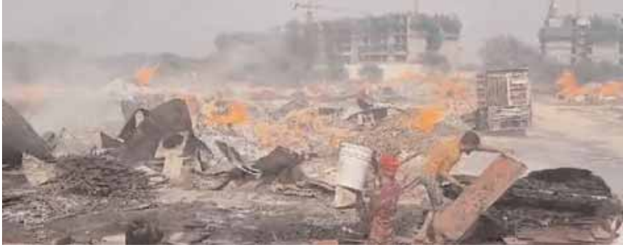
गुरुग्राम में द्वारका एक्सप्रेस-वे किनारे बजबेड़ा गांव के पास लकड़ियों के गोदाम में लगी भीषण आग।

जानकारी के अनुसार द्वारका एक्सप्रेस-वे के किनारे पर बजबेड़ा गांव के पास लकड़ियों का एक खुले