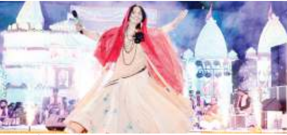
हनुमानजी के जागरण में भजन प्रस्तुत करती कलाकार।