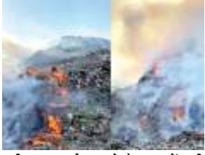
फरीदाबाद मार्ग पर कूड़े के पहाड़ में लगी आग।

गुरुग्राम-फरीदाबाद मार्ग पर बंधवाड़ी गांव के पास गुरुग्राम और फरीदाबाद नगर निगम क्षेत्रों का कूड़ा डाला जाता है। दोनों शहरों के कूड़े से अब बंधवाड़ी में कूड़े का ढेर कूड़े के पहाड़ में तब्दील हो चुका है।