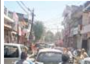
सोहना के नागरिक अस्पताल मार्ग पर लगा जाम।

सोहना। शहर की सड़कों से लेकर बाजारों में अवैध पार्किंग से लेकर अतिक्रमण कम होने का नाम नहीं ले रहा है। जिससे शहर में आम रास्तों से लेकर बाजार में यातायात जाम की समस्या विकराल रूप लेने लगी है। जिससे पैदल चलने वालों को भी यातायात जाम परेशानी दे रहा है।