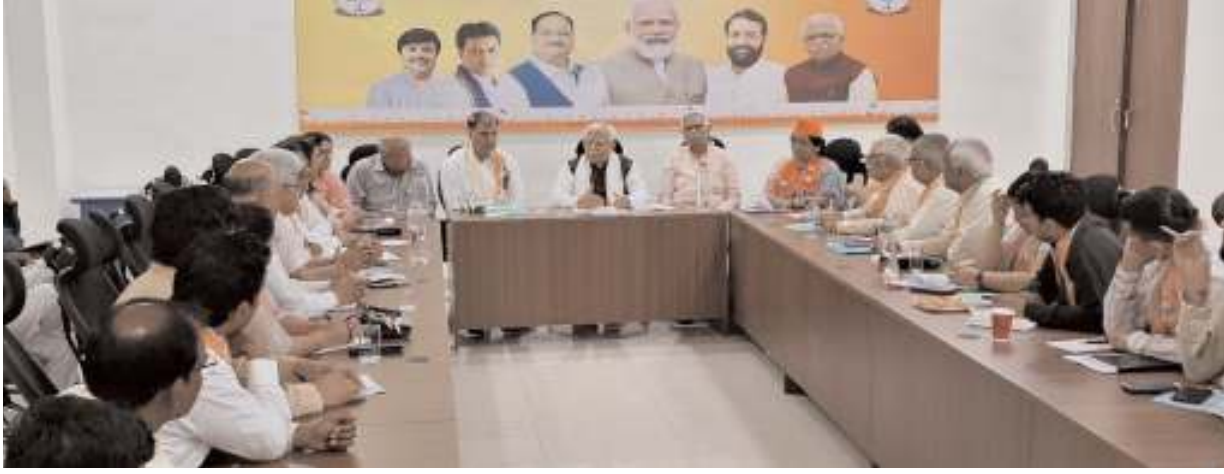
बैठक को संबोधित करते पूर्व मुख्यमंत्री मनोहर लाल।

हरियाणा के पूर्व मुख्यमंत्री मनोहर लाल ने कहा कि प्रधानमंत्री नरेंद्र मोदी सभी समाज की तकलीफों के बारे में सोचते हैं और उनका समाधान भी करते हैं। पूर्व सीएम ने कहा कि कांग्रेस ने तीन तलाक पर हमेशा तुष्टिकरण की राजनीति की है, जबकि प्रधानमंत्री नरेंद्र मोदी ने मुस्लिम महिलाओं की पीड़ा को समझते हुए उन्हें तीन तलाक से निजात दिलाई है। ये बातें मनोहर लाल ने सोमवार को रोहतक में चुनाव प्रबंधन की बैठक के बाद पत्रकारों से बातचीत करते हुए कही। यहां उन्होंने यह दावा भी किया कि भाजपा हरियाणा में 10 की 10 सीटें जीत रही है।