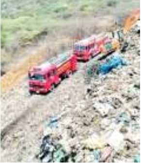
गुरुग्राम-फरीदाबाद मार्ग पर कूड़े के पहाड़ में आग बुझाने पहुंची दमकल विभाग की गाड़ियां।

हालांकि गुरुग्राम-फरीदाबाद का डोर-टू डोर कूड़ा उठाने वाली इको ग्रीन कंपनी को यहां पर कूड़े से बिजली संयंत्र लगाना था, लेकिन यह योजना सिर नहीं चढ़ पाई। हालांकि दावे बड़े-बड़े किए गए थे। ऐसे में कूड़े का निस्तारण होने की कोई संभावना नजर नहीं आ रही। कूड़े का पहाड़ खत्म नहीं हो पा रहा। इसी कूड़े