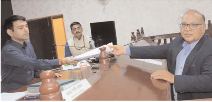
पायनियर संवाददाता < सक्ती www.dailypioneer.com