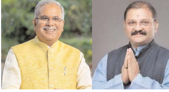
रही है। प्रियंका गांधी आगामी 21 अप्रैल को आएंगी। लोकसभा चुनाव की बिसात बिछ चुकी है।

मौसम खुलते ही गर्मी के तीखे तेवर के साथ सियासी पारा चढ़ता जा रहा है और प्रत्याशी व उनके समर्थक पसीना बहा रहे हैं लेकिन चुनावी रंग से कोटर्स दूर हैं। ना जुलूस और न ही रैलियों का नजारा दिख रहा है। गर्मी के कारण लोग घरों में ही दुबके रहते हैं। शादी सौजन के साथ ही नवरात्रि की व्यस्तता है। प्रचार में अब सिर्फ आठ दिन ही शेष हैं और इतने ही दिनों में सब कुछ पार्टियों को करना है। ऐसे में अब आज रामनवमी के बाद ही भाजपा और कांग्रेस की असल लड़ाई जनता को देखने मिलेगी। भाजपा के बाद कांग्रेस भी अब अपने स्टाफ प्रचारकों को बुलाने की तैयारी कर