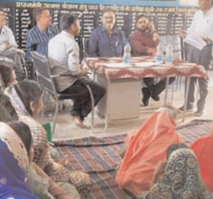
मुन्देरा के ग्रामीण, चुनाव बहिष्कार का किया ऐलान

बयान लिया गया, वही खलारी से मुन्देरा सड़क और तवेरा मोड़ से मुन्देरा सड़क का प्रस्ताव भेजे जाने की बात पीएमजीएसवाय विभाग ने कही। वही एसडीएम ने सभी लोगों से सार्थक चर्चा की। साथ ही अन्य समस्याओं का भी जल्द से जल्द निराकरण करने ग्रामवासियों को आश्वासन दिया। मौके पर एसडीएम ने पंचनामा बना उपस्थित पंचायत के जनप्रतिनिधि एवं ग्रामीणों का हस्ताक्षर लिया गया। उल्लेखनीय हो कि पायनियर ने 23 अप्रैल के अंक में शीर्षक -विकास के दावों ने तोड़ा