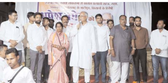
पायनियर संवाददाता < कवर्धा www.dailypioneer.com

छत्तीसगढ़ के पूर्व मुख्यमंत्री एवं राजनांदगांव लोकसभा सांसद प्रत्याशी भूपेश बघेल लगातार चुनावी दौरा पर कवरीधाम जिले अंतर्गत अनेक क्षेत्रों में दौरा कर जनसंपर्क कर रहे हैं। वे अनेक ग्राम पहुंचे वहां के कार्यकर्ता एवं ग्रामीणों से भेंट मुलाकात कर, भाजपा के कुशासन से लोगों को अवगत करा रहे, बढ़ती महंगाई बेरोजगारी एवं भ्रष्टाचार को लेकर भाजपा नेताओं पर निशाना साधते हुए। कांग्रेस की पूर्व छत्तीसगढ़ सरकार की उपलब्धियों से लोगों का अवगत कराते हुए, वर्तमान भाजपा सरकार की नाकामियाबियों को सबके समक्ष रख रहे साथ ही, केंद्र