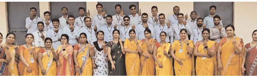
पायनियर संवाददाता < सरयपाली

स्वामी आत्मानंद शासकीय अंग्रेजी माध्यम उत्कृष्ट विद्यालय में समस्त टीचर्स एवं स्टाफ द्वारा मतदाता जागरूकता अभियान अंतर्गत शत प्रतिशत मतदान करने का संदेश दिया। मतदाता जागरूकता के लिए एक अनूठी पहल करते हुए विशेष पोशाक में उपस्थित देते हुए लोकसभा आम निर्वाचन 2024 में शत प्रतिशत मतदान हेतु वोटर्स को प्रेरित करने