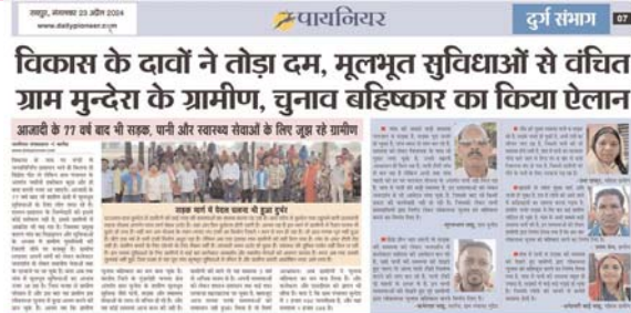
विकास के दावों ने तोड़ा दम, मूलभूत सुविधाओं से वंचित ग्राम मुन्देरा के ग्रामीण, चुनाव बहिष्कार का किया ऐलान