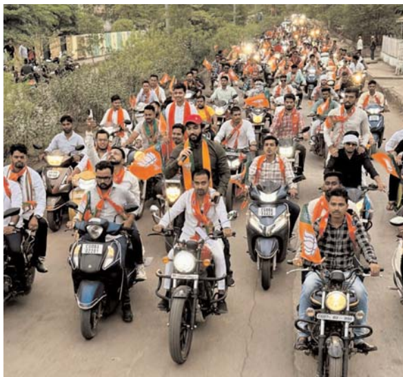
भाजयुमो की यह रैली नंदई, लखौली, खिखली और आखिर में मोतीपुर पहुंची। इन स्थानों पर जनसभा