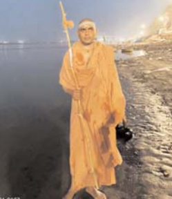
सरस्वती जी महाराज के नाम से जानें जाएंगे दंड संन्यास की दीक्षा