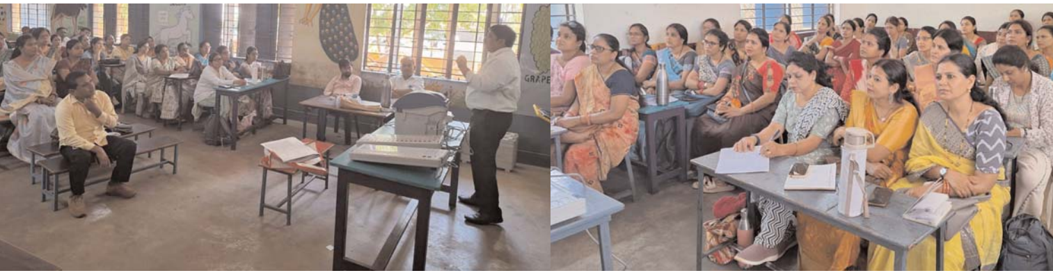
पायनियर संवाददाता < धमतरी www.dailypioneer.com