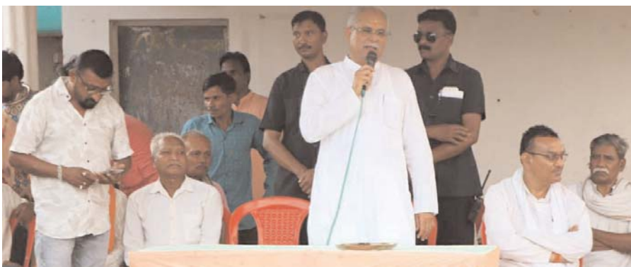
कहीं मतदाता परिचय बंट रही, कहीं अभी तक कोई प्रचार नहीं... भ्रष्टाचार, घोटाले के मामलों पर जनता की नजर पायनियर संवाददाता राजनांदगांव

आखिरी दौर के चुनावी अभियान में प्रत्याशियों ने पूरा जोर लगा दिया है। इधर, तकरीबन महिने भर के चुनावी माहौल के बीच वोटर अब अपनी मानसिकता बना रहे हैं। लोकसभा चुनाव में शहरी और ग्रामीण वोटों पर ही सीधा फोकस है। जातीय समीकरण जैसे पहलुओं का असर इसमें