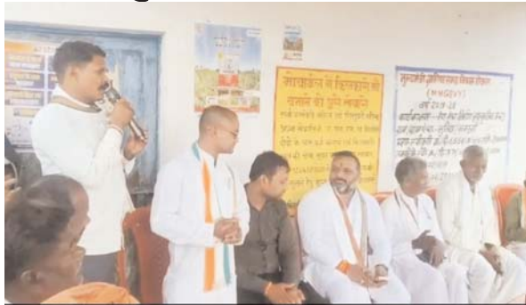
पायनियर संवाददाता < कवर्धा www.dailypioneer.com

कवर्धा के सुतिया गांव के लोगों ने भूपेश बघेल को चुनाव के लिए सहयोग राशि भेजी