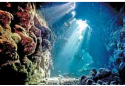
पायनियर समाचार सेवा। हैदराबाद

भारत 2026 में अपने पहले अंतरिक्ष मिशन के लिए कम्प कस रहा है, उसी साल गहरे समुद्र में मानव भेजने की योजना भी बन रही है, जिससे देश के अग्रणी वैज्ञानिक