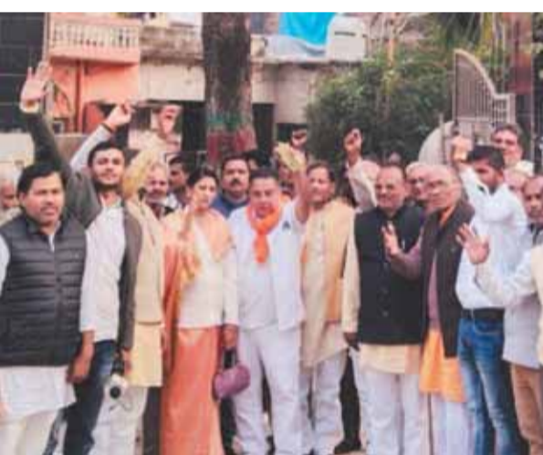
संवाददाता। उरई जालौन

बुंदेलखंड संयुक्त मोर्चा पृथक बुंदेलखंड के लिए गाँव गाँव काम कर रही है और यह यात्रा उसके उद्देश्यों से जुड़ी है। इस पदयात्रा के माध्यम से सरकार भी यह बात समझेगी। अलग राज्य बनने पर बुंदेलखण्ड भारत का मुकुट बनेगा। राजा बुंदेला ने कहा कि बुंदेलखंड की लड़ाई को जनमानस तक ले जाने के लिए यह पदयात्रा आयोजित की गई है। उन्होंने कहा कि भाजपा छोटे राज्यों की समर्थक है। हमें आशा है कि प्रधानमंत्री नरेंद्र मोदी के नेतृत्व में नया बुंदेलखंड 2027 तक आकार लेगा और जल्द बुंदेलखंड की घोषणा होगी। लेकिन हमें सरकार तक बुंदेलखंड की बात पहुंचाना है और यह भी कि बुंदेलखंड राज्य बुंदेलियों की प्राथमिकता है। उन्होंने विभिन्न संगठनों का एक मंच पर अपने समर्थन में अपना समर्थन पत्र भी सौंप करे हैं।