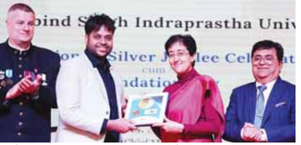
गुरु गोबिंद सिंह इंद्रप्रस्थ विवि की सिल्वर जुबली में सीएम आतिशी व अन्य।

स्कूलों को भी मात दे रहे हैं। पिछले सात साल से लगातार दिल्ली सरकार के स्कूल प्राइवेट स्कूलों से अच्छे रिजल्ट ला रहे हैं। देश के इतिहास में यह पहली बार हो रहा है। हमारी सरकार बनने से पहली 2014 में दिल्ली के विश्वविद्यालयों में मात्र 83,600 छात्र पढ़ते थे और दस साल