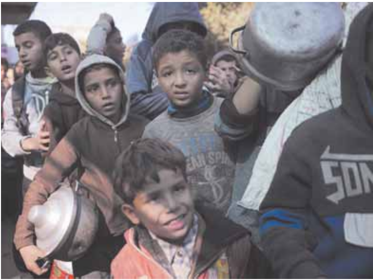
गाजा पट्टी में हमले में प्रभावित छोटे बच्चे

गाजा पट्टी पर इजराइल के हवाई हमले में कम से कम 25 फलस्तीनी मारे गए और कई घायल हो गए। फलस्तीनी चिकित्सकों ने यह जानकारी दी। यह हमला ऐसे समय में हुआ है जब अमेरिका के राष्ट्रपति जो बाइडन के राष्ट्रीय सुरक्षा सलाहकार ने कुछ घंटे पहले ही गाजा में युद्ध समाप्त करने के लिए संघर्ष विराम समझौते की उम्मीद जताई थी। गाजा पट्टी के उत्तर में स्थित अल-अवदा अस्पताल और मध्य गाजा के अल-अस्सा अस्पताल के प्राधिकारियों ने बताया कि बृहस्पतिवार को शहरी नुसेरात शरणार्थी शिविर में एक बहुमंजिला आवासीय इमारत पर इजराइल द्वारा किए गए हमले के बाद कुल 25 शत्रु अस्पताल लाए गए। फलस्तीनी चिकित्सकों ने बताया कि हमले में घायल हुए 40 से अधिक लोगों का इन दोनों अस्पतालों में उपचार किया जा रहा है और इसमें अधिकतर बच्चे हैं। उन्होंने बताया कि इजराइल के हमले में नुसेरात में कई घर भी क्षतिग्रस्त हो गए। इस घातक हमले के संबंध में इजराइली सेना ने फिलहाल कोई जानकारी नहीं दी है। अमेरिका के राष्ट्रपति बाइडन के राष्ट्रीय