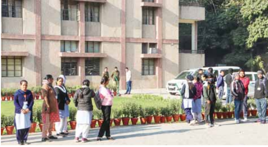
श्रीनिवासपुरी स्थित कैब्रिज स्कूल के बाहर अपने बच्चों को लेने पहुंच अभिभावक। साथ में पुलिसकर्मी जायजा लेते हुए।

इस घटनाक्रम पर प्रतिक्रिया व्यक्त करते हुए दिल्ली के पूर्व मुख्यमंत्री अरविंद केजरीवाल ने कहा कि एक सप्ताह में दूसरी बार ऐसा हुआ है। उन्होंने सवाल किया कि बम की इन धमकियों का बच्चों पर क्या प्रभाव पड़ेगा। दिल्ली अग्निशमन सेवा के