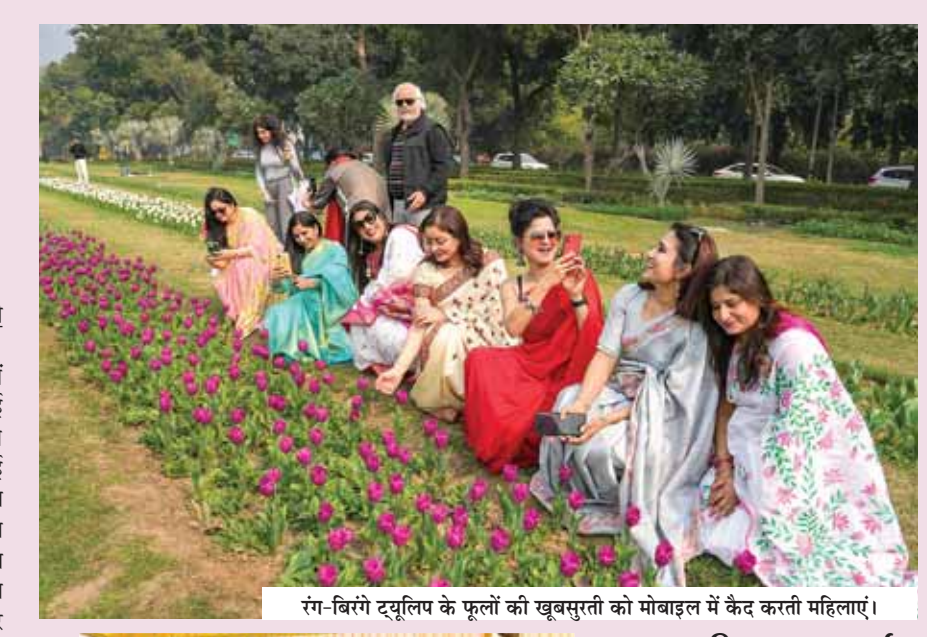
रंग-बिरंगे ट्यूलिप के फूलों की खूबसूरती को मोबाइल में कैद करती महिलाएं।

एनडीएमसी के ट्यूलिप फेस्टिवल के तहत, एनडीएमसी ने ट्यूलिप के इतिहास के साथ-साथ हॉलैंड से लुटियंस दिल्ली तक की यात्रा के दर्शने के लिए सूझान दूतावास के पास चाणक्यपुरी के राजनयिक क्षेत्र में ट्यूलिप फ्लावर बेड के पास एक प्रदर्शनी लगाई इस प्रदर्शनी में विभिन्न प्रकार के ट्यूलिप के रंग और विशेषताओं को भी प्रदर्शित किया गया है। शनिवार को ट्यूलिप वॉक में स्कूलों के सैकड़ों विद्यार्थियों ने हिस्सा लिया और प्रदर्शनी देखी। गिव मी ट्री स्ट्रट के इशतयाक ने