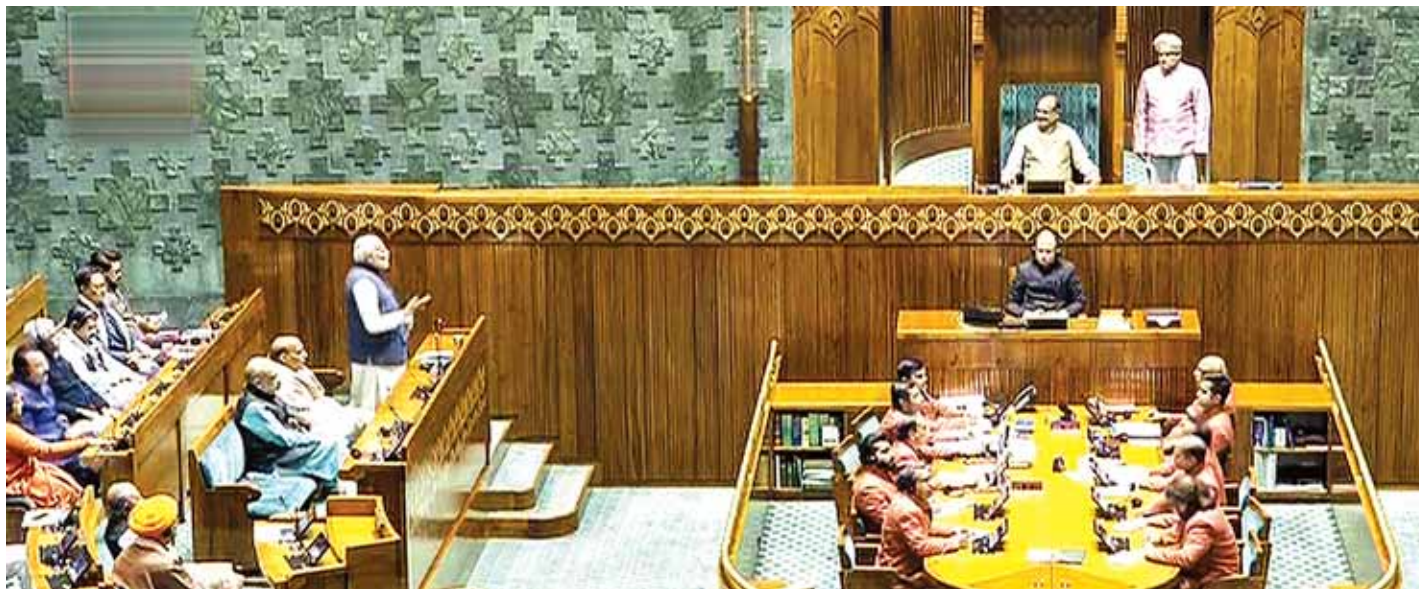
प्रधानमंत्री नरेंद्र मोदी शनिवार को लोकसभा में बजट सत्र के दौरान संबोधित करते हुए

अनुष्ठान किया था। प्रधानमंत्री ने 17वीं लोकसभा के कामकाज में योगदान के लिए सदन के सभी सदस्यों को धन्यवाद दिया। मोदी ने कहा कि 17वीं लोकसभा के पांच साल सुधार, प्रदर्शन और परिवर्तन का काल था और देश तेज गति से बढ़े बदलावों की ओर बढ़ रहा है। प्रधानमंत्री ने लोकसभा चुनाव से पहले अंतिम सत्र में कहा, देश तेज