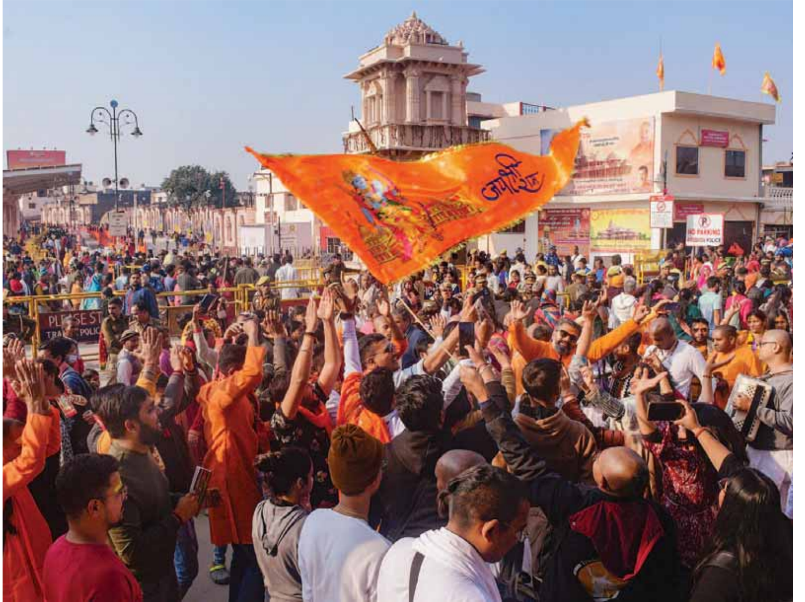
अयोध्या। शनिवार को अयोध्या में राम मंदिर के दर्शन के लिए जाते श्रद्धालु।