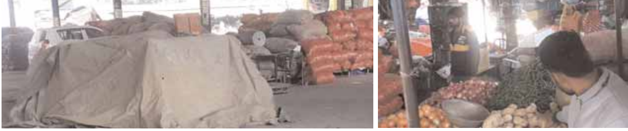
सोहना मंडी में आढ़तियों द्वारा लगाई जाने वाले सब्जी की खुली बोली वाला परिसर खाली पड़ा हुआ।