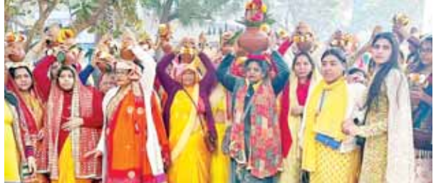
गुरुग्राम के सेक्टर-43 स्थित खोखरा जोहड़ हनुमान मंदिर में मूर्ति प्राण प्रतिष्ठा समारोह में कलश यात्रा निकालती महिलाएं।