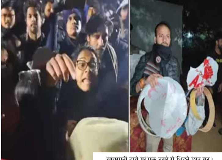
साबरमती ढाबे पर एक दूसरे से भिड़ते छात्र गुट।

दोनों पक्षों ने इस झड़प के लिए एक-दूसरे पर आरोप लगाए हैं जबकि जेएनयू प्रशासन ने अभी इस पर कोई प्रतिक्रिया नहीं दी है। परिसर में 2024 के जेएनयू छात्र संघ चुनाव के लिए निर्वाचन आयोग के सदस्यों को चुनने के लिए साबरमती ढाबे पर विश्वविद्यालय आम सभा की बैठक (यूजीबीएम) बुलाई गई थी और इस दौरान