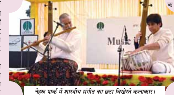
नेहरू पार्क में शास्त्रीय संगीत का छाटा बिखरेते कलाकार।

छात्रों के ट्यूलिप के इतिहास और यात्रा के बारे में बताया और ट्यूलिप के बारे में उनकी जिज्ञासा पर छात्रों से बातचीत भी की। छात्रों ने शांति पथ और आसपास के क्षेत्र चाणक्यपुरी में ट्यूलिप महोत्सव का आनंद लिया, जहां विभिन्न प्रकार, रंगों और छटा में खिल रहे फूल हैं। नई दिल्ली के ट्यूलिप महोत्सव में उसाह के साथ हजारों फूल प्रेमियों ने एनडीएमसी