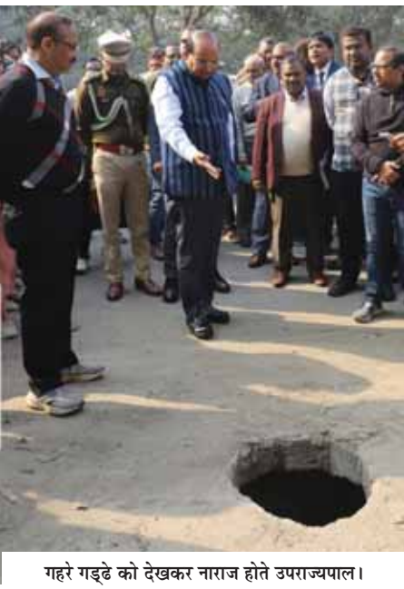
गहरे गड्ढे को देखकर नाराज होते उपराज्यपाल।

उपराज्यपाल कार्यालय के एक वरिष्ठ अधिकारी ने बताया कि स्थानीय लोगों के अनुरोध और सफाई समेत बुनियादी नागरिक सुविधाओं की कमी की शिकायतें मिलने के बाद, उपराज्यपाल सक्सेना ने शनिवार को किराड़ी क्षेत्र का दौरा किया। किराड़ी को रोहिणी और रिठाला से जोड़ने वाले भगवान महावीर मार्ग से शुरुआत करते हुए, एलजी ने कचरे से पेटे और जलभराव की संभावना वाले कई स्थानों का दौरा किया, जिसकी वजह से यहां के निवासियों को नारकीय परिस्थितियों में रहने को मजबूर होना पड़ता है।